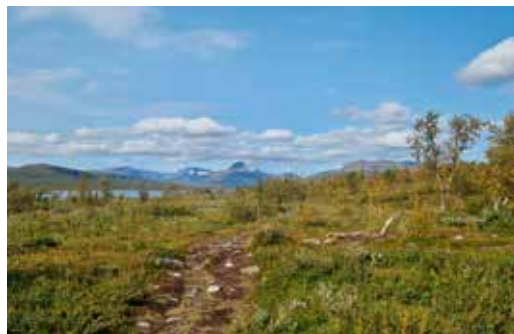
Etter Treriksrøysa, innover mot Goldahyttene. Nydelig utsikt mot Parastinden/Bárrás.