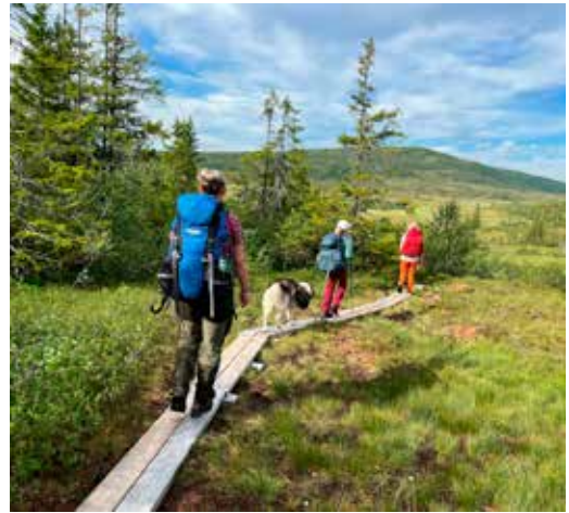
Dag 3 fra Prestøyhytta til Schulzhytta. Dagen startet på en autostrada av klopper.

komme først fram til dagens hytte. Militærentene og kunstjentene (i 20-åra) var irriterende spreke, sto alltid seinere opp og startet seinere enn oss, stakk innom de høyeste toppene på veien, men kom likevel først fram til hytta.