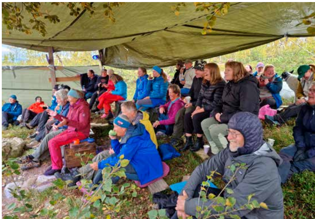
Publikum koste seg.

Lørdag 17. august ble det arrangert «Goldafest» for aller første gang. Tilsynene hadde lenge prata om å få til en konsert inne på Golda, og vi som var med og arrangerte Monsen-minutt-for-minutt i 2018 hadde også drømt om et nytt arrangement inne på det flotte Goldatunet. I sommer ble det snekret plattning foran nye Goldahytta, og dermed var «scenen» på plass sånn at vi kunne invitere til fest.