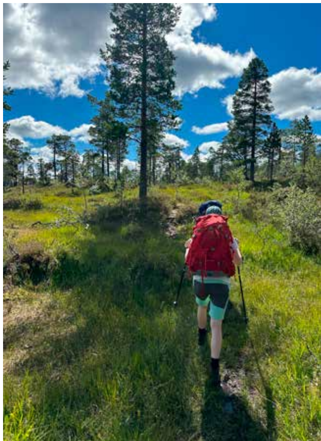
De to første dagene vandret vi i åpent skoglandskap med mye vakker furu og myr. Her på vei til Kvitfjellhytta.

De neste sju dagene ble en vandring i overraskende variert og vakkert terreng. Blaserte nordlendinger hadde på forhånd tenkt at sååå vakkert kunne det jo ikke være der nede i Trøndelag. Men vi skulle la oss imponere og sukke mang en gang de neste sju dagene over åpen furuskog, vakkert myrlandskap, fjell i det fjerne som vi gradvis nærmet oss og så gikk tett inntil, mektige elver og u-daler og kulturlandskap. Vi vandret gjennom nasjonalpark, landskapsvernområde og naturreservat, og kom sta-