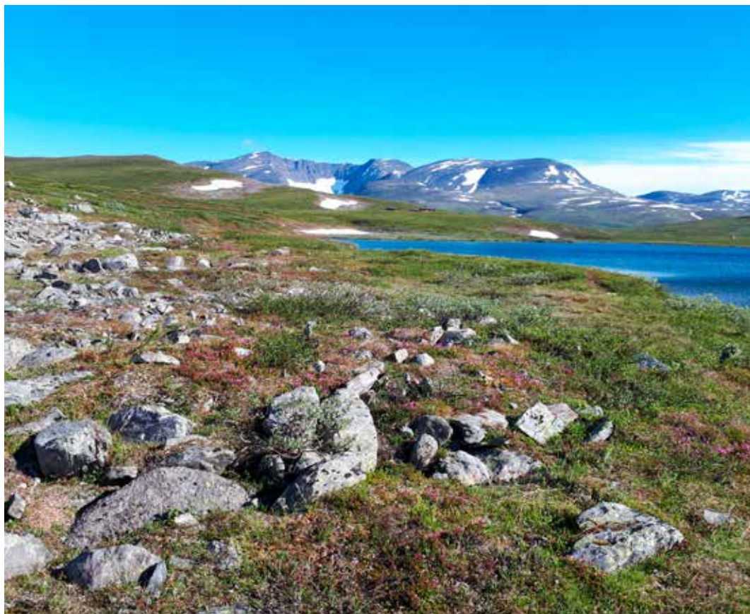
Utsikt mot Vuomahyttene.

botanisering og fuglekikking. På vannet svømmer flere par havelle og sjørre, i småvannene mot Gasgas finner vi bergand. Fjelljoen speider etter inntrengere med sitt skarpe blikk og klager høyt og inntrengende hvis vi kommer for nær. Sjelden har vi sett maken til blomstring. Landskapet er dekket av tepper med blålyng, kantlyng og fjellfiol, reinrosen er tallrik og rosenrota er på vei inn i blomstring allerede nå ved St. Hanstider. Vi koser oss med uforglemmelige fiskemåltider gjennom uka.