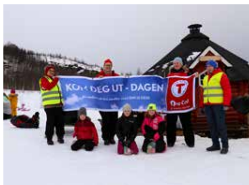
Kom deg ut dag i Sørkjosen