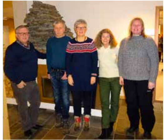
Det første styret valgt på årsmøtet 2015