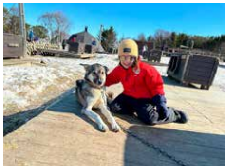
Kos med sledehund - BT på Villmarksenteret.