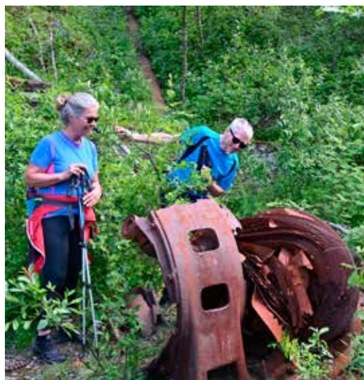
Inspiserer rester etter gruvedrifta