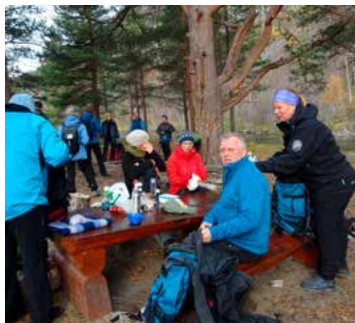
Den aller første turen, 2014

ke vandringer, samiske og kvenske stedsnavn og skredkvelder.