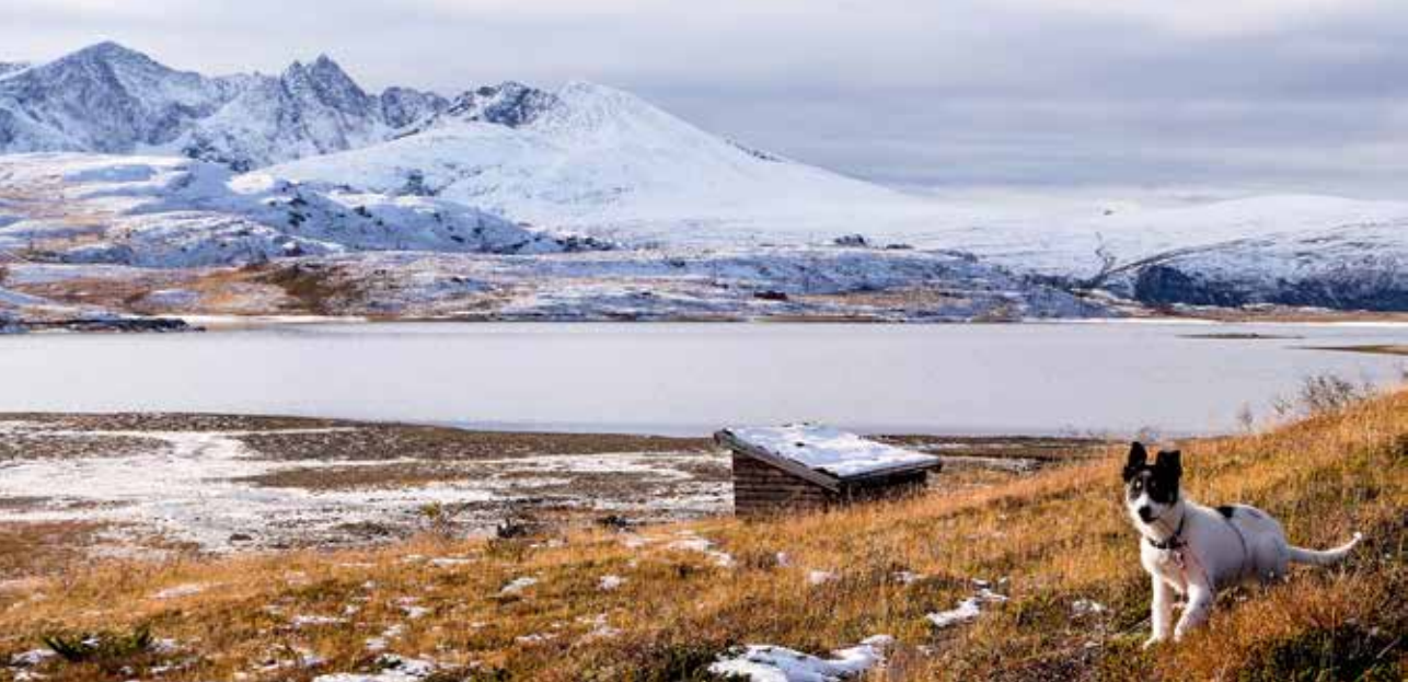
Fra eget nærområde; Sikka.

igjen. Det er vennskap, samhold og gode møter som er belønningen i tillegg til alle naturopplevelsene man deler. Ikke minst er det en glede å se hvor mye turlaget har vokst i løpet av disse til årene. NTT teller nå cirka 240 medlemmer, et imponerende antall.