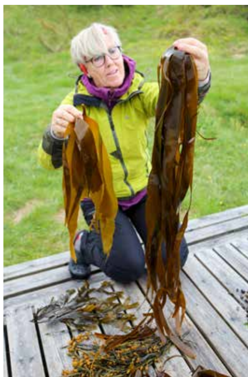
Tang og tare kurs