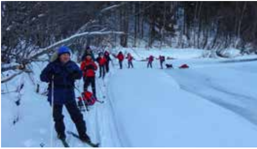
Vintertur på Reisaelva