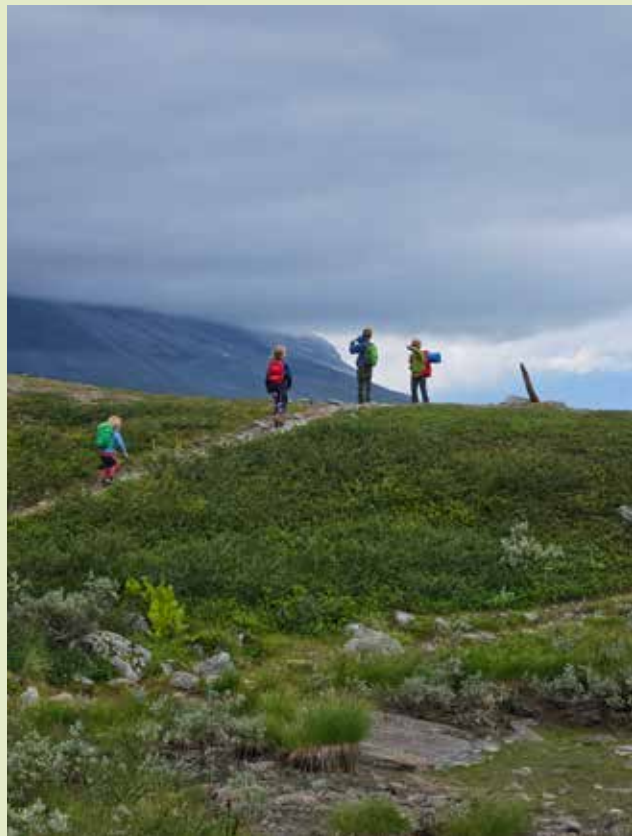
Spente små turledere speider nedover Rostadalens villmark

Barn som lærer å bli glad i naturen og som