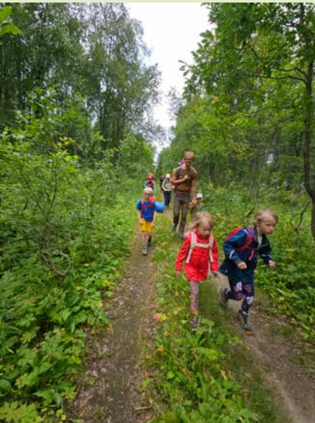
Fortsatt ivrige barn på tur opp i Villmarken Det er mye interessant å se langs stien