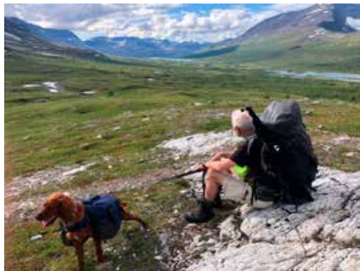
Utsikt mot Anjavatnet

Like plutselig, som alltid når ankomsten er via Anjavassdalen, ligger hyttene der, tunet som består av Vuomahytta, Vuomastua og uthus med hundeanneks. Vi får