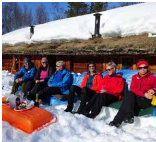
Gourmettur til Dalstuene i Kvænangen