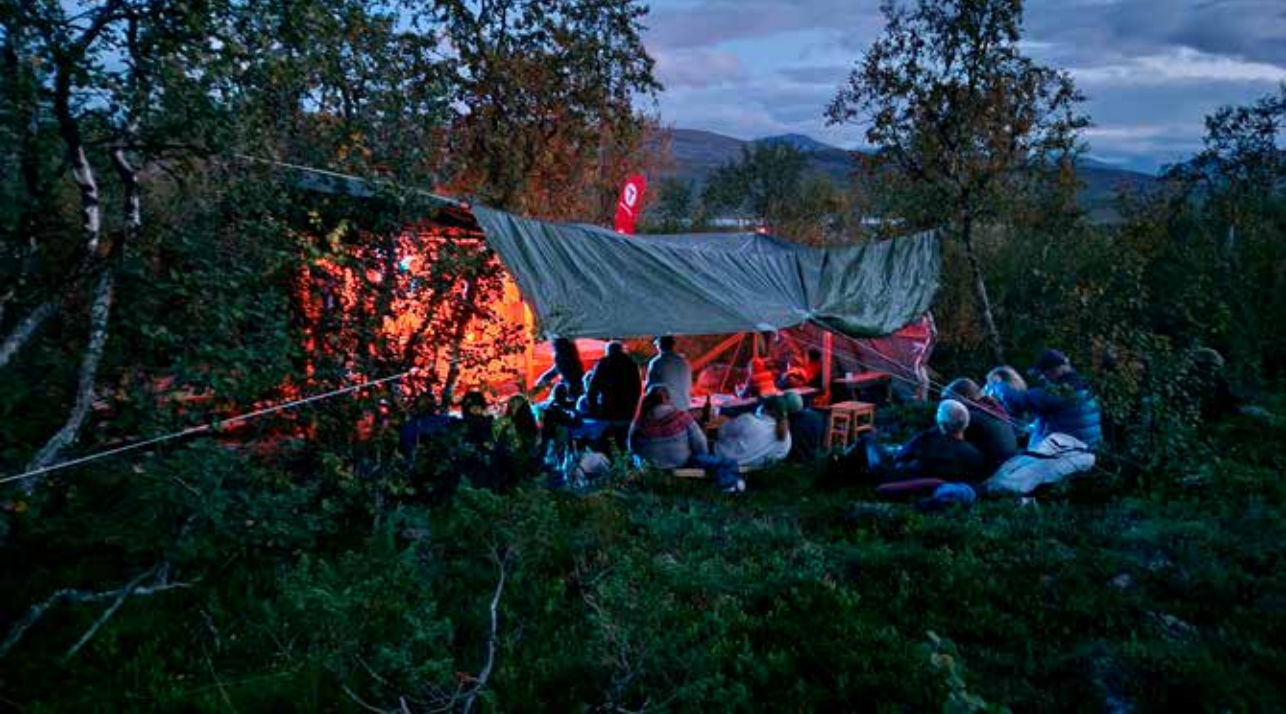
Stemningsfullt utpå kvelden. Det var trukket en stor presentning over publikumsbenkene i tilfelle regn, men været holdt seg hele kvelden.