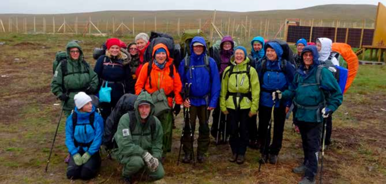
Første tur til Reisavann 2015