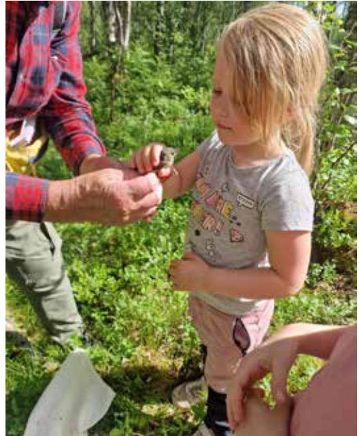
En fugl i hånden... Spennende møte med naturen

Barna fant også en kasse som det var «gjort innbrudd i», mest sannsynlig av en mår eller lignende. Alt i alt var mange kasser fulle av små, søte fugleunger. Noen var så ferske og små at det var for tidlig å ringmerke dem enda, mens noen var blitt store og snart skulle forlate redet. Vi lærte her at kjøttmeisen er den som er raskest til å forlate fuglekassen,