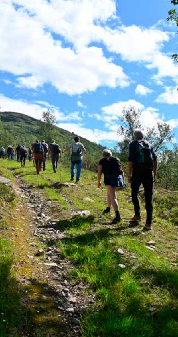
Bratte bakker mot luovosskaidi men fin vei