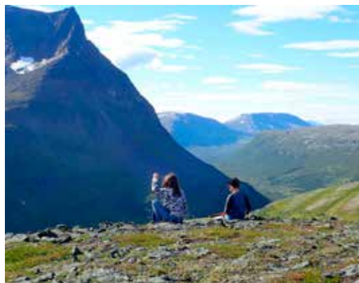
Utsikt fra luovosskaidi mot steile vaddastinder

Vaddas er samisk og betyr utilgjengelig , fortalte Elvebakken videre. Når man ser seg