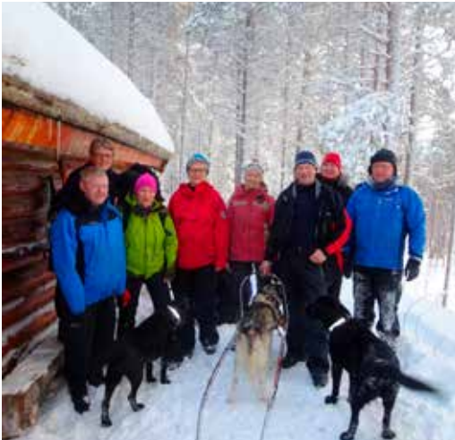
Turleder og styresamling Ansamukka februar 2015