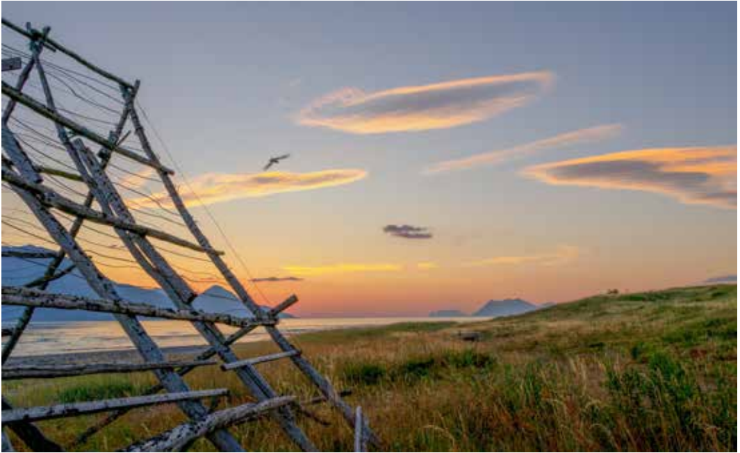
Fra Uløya.