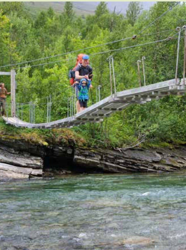
Første hengebru over den lange og store Rostaelva