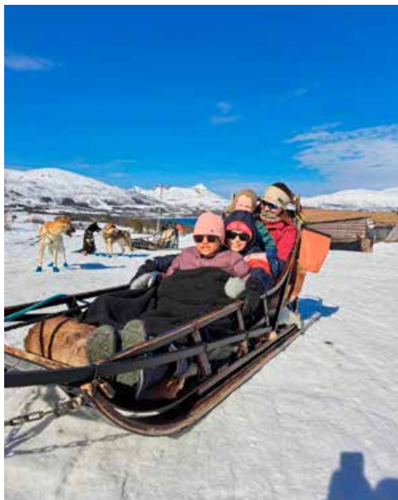
På plass i sleden på Villmarksenteret.