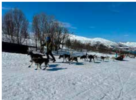
På BT tur til Villmarksenteret.

Forsida: Barnas turlag på tur til Rostahytta, ivrige barn leder an.