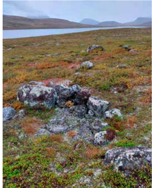
Čilla/skyteskjul på sørøstsiden av Rávdovjávri.

Stalloftufter er svakt nedgravde rundt/ovale tufter med liten voll rundt og sentralt ildsted. Tuftene ligger gjerne ovenfor skoggrensa i åpent terreng. I likhet med de rekkeorganiserte ildstedene opptrer Stallotufterne også oftest i grupper som ligger på ei rett rekke. Mange slike tufter er undersøkt i Sápmi, og hovedbruksfasen dateres til Vikingtid, 800-1050 AD. Lenge har forskere tolket tuftene som spor etter gammer, men den senere tid er det kommet tolkninger om at dette er spor etter store telt (bealljegoahti) som har hatt en lett nedgravd gulvflate. Dette for å gjøre dem varmere under bruk i høyfjellet i forbindelse med villreinfangst under høsttrekket. I Indre Troms er det så langt dokumentert to lokaliteter med til sammen 12 Stallotufter i henholdsvis den nordlig og sørlige fjellsi-