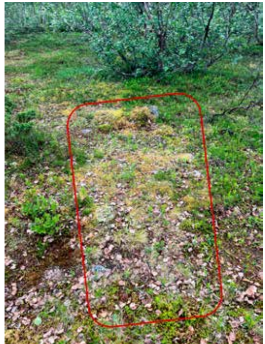
Rekkeorganisert ildsted ved Suhttegaldojohka. På et flatt ned ved elva ligger seks godt overgrodd ildsteder som ikke er lett å få øye på. Like ved ligger det et fangstanlegg med 76 fangstgroper på en sammenhengende rekke over en strekning på 1,2 km.