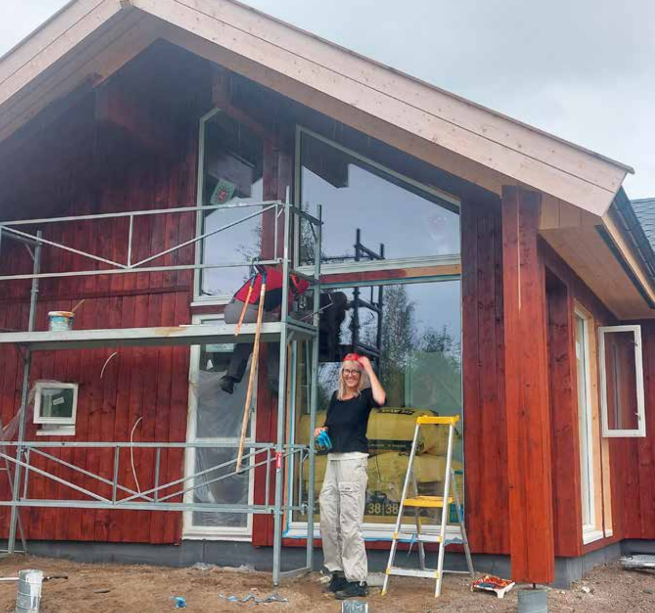
Karibu under oppføring.

«Drivkraften til å delta på dugnadsarbeide er å bli kjent med mange nye folk og ha det hyggelig sammen med dem. I september var æ en helg på Dividalshytta sammen med en fantastisk gjeng i forbindelse med bytting av vindu på hytta. Der så æ på Facebook at de kunne trenge litt hjelp.»