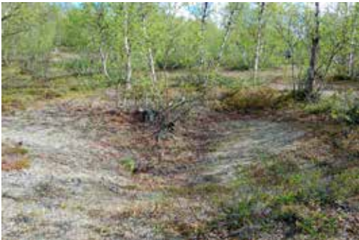
Hustuft ved Buolzagorssajohka.

Forhistoriske, nedgravde hustufter er sirkulære, ovale eller rektangulære med omgivende jordvoll og, på innlandet i Troms, sjeldent særlig dypt nedgravde. Bunnen fremstår som regel svakt hvelvet eller plan (se Figur 3). Tidsmessig finnes de helt tilbake til 5. årtusen f.Kr.