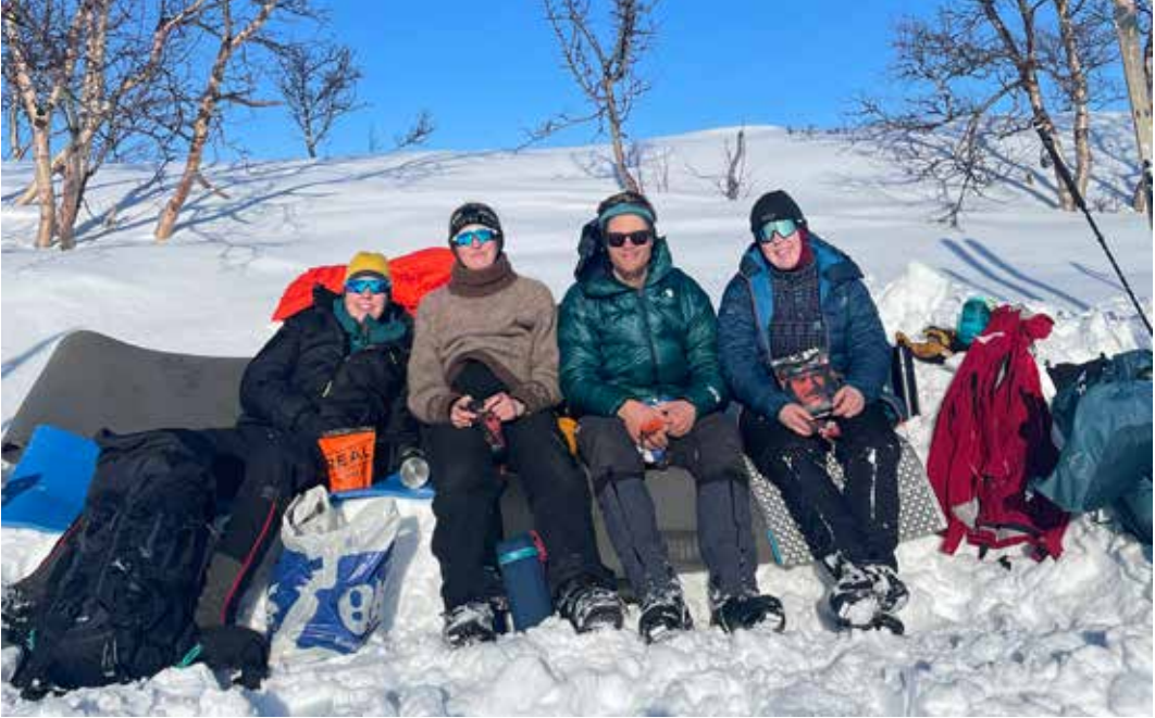
Lunsjen smaker ekstra godt med påskesola midt i fleisen og snøsofa!

Finnland som vi møtte på Goldahytta første dagen. Her ble det også tid til både badstue og kortspill.