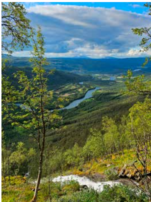
Utsikt retning Bardufoss.