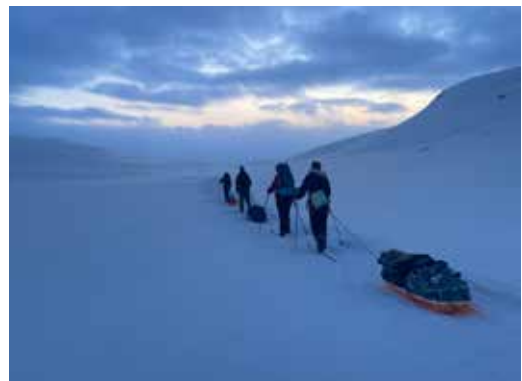
På vei inn til Goldahytta på dag 1. Godt å være ute på tur igjen!

Takk for nok en super påsketur i Indre Troms!