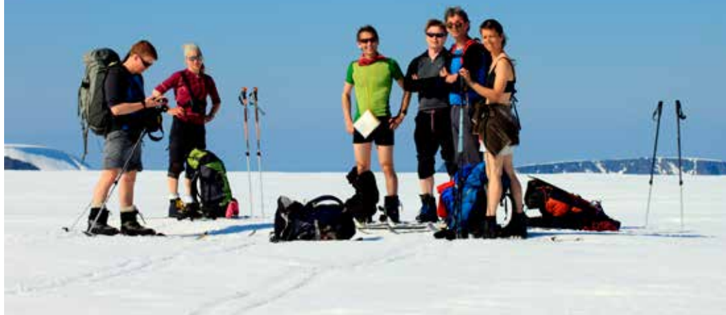
På toppen av Finnmark

Folk samler på så mangt – frimerker, mynter, biler, sko, tegneserier, likes osv. osv. Motivene varierer, hvis de finnes. Jeg vet ikke sikkert når ideen om å bestige det høyeste fjellet i hvert fylke kom. Men prosjektet strakk seg fra omkring 2009 til 2021.