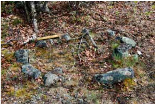
Steinsatt ildsted ved Politiodden.