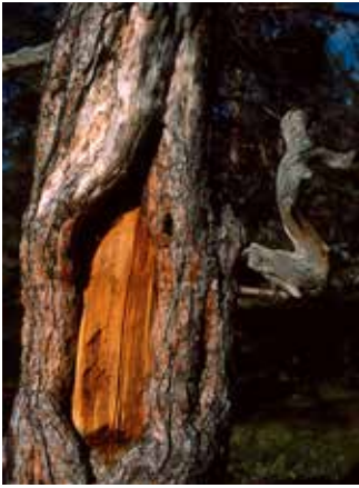
Barktatt furu tett på elva i Dieváidvuovdi/Dividalen hvor uttaket er datert til 1620.