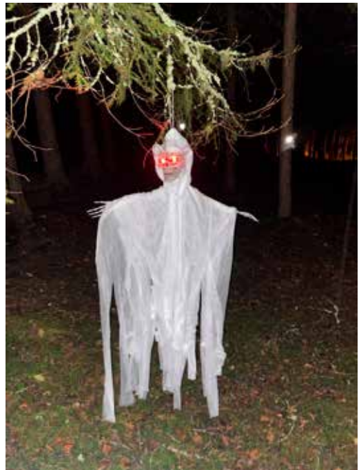
Spøkelse i treet.