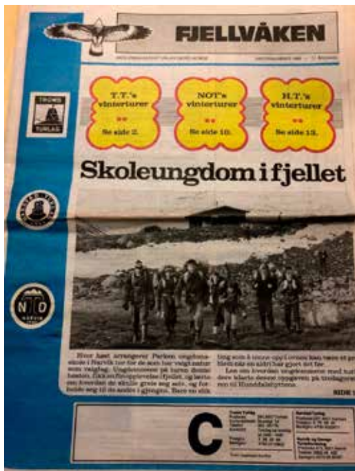
Fjellvåken anno 1989.