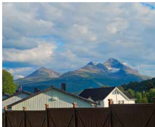
Istinden fra Rustalia.