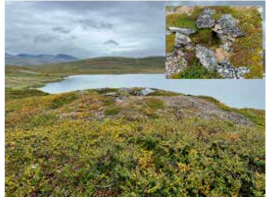
På en markert liten haug med morenegrus sør for elva ved Vuomahyttene er det gravd ei grop og bygd et kammer av steinheller medi gropa.

Oftest er det kun inndeling av den indre golvflata i teltet vi finner etter reindriftsamenes teltboplasser. Steiner som har ligget rundt ytterkanten av teltet (teltring), slik de vi ofte ser på nye lavvoplasser, finnes sjelden på de eldre teltboplassene. Sporene i marka etter reindriftsamenes teltboplasser