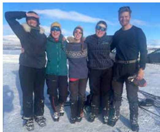
5 stk. fornøyde turfolk på parkeringsplassen etter endt tur!