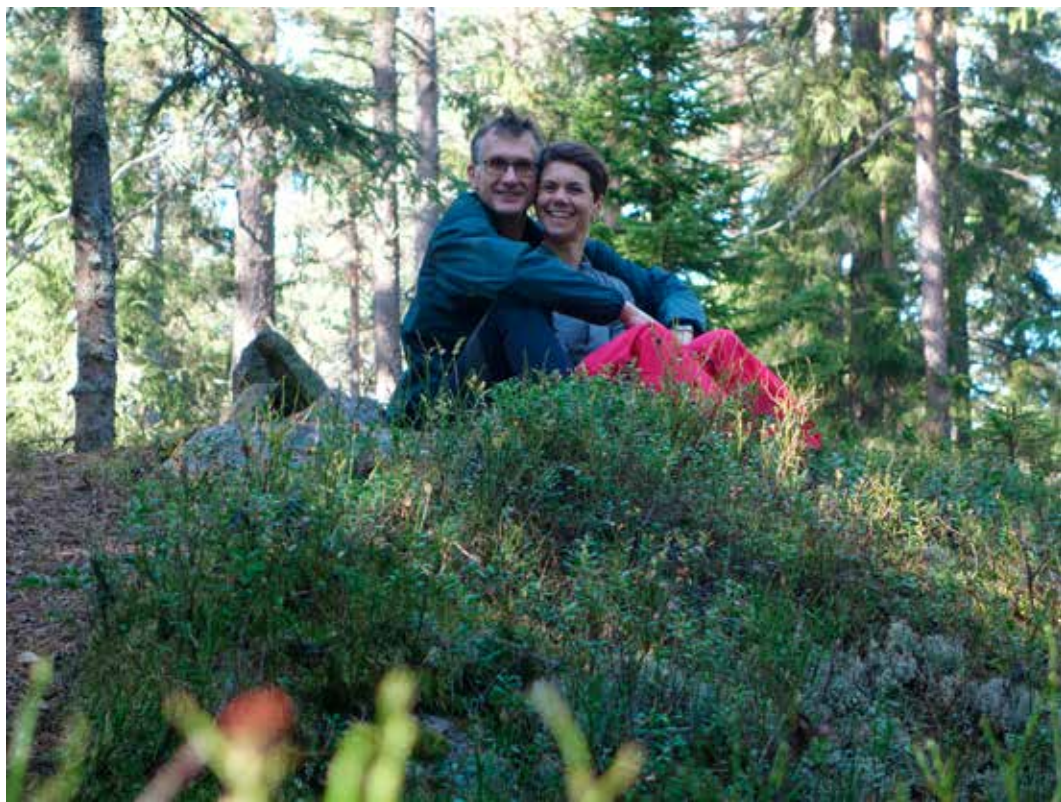
Endelig fant vi toppen! Slavasshøgda, Østfold.

Sør-Trøndelag? Seff, det må jo være Snøhetta på Dovre, 2286 moh. Feil! Snøhetta ligger i Oppland og blir der trumfet av Galdhøpiggen. Slik lærer nerder norsk geografi.