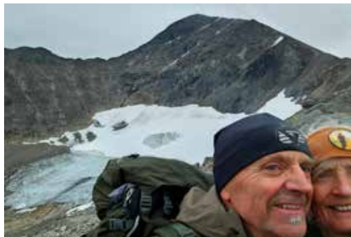
Breen før toppen.

Istinden har fortsatt sin plass i hjertet. Jeg kan nesten si at den har vært en «veiviser» eller «reiseleder» i livet. Men sannelig tror jeg den er finest å se fra Heggelia.