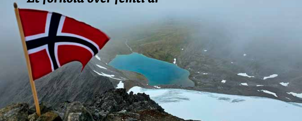
Flagget på Istinden.