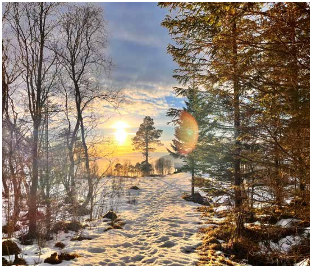
Sola lyser våren inn.