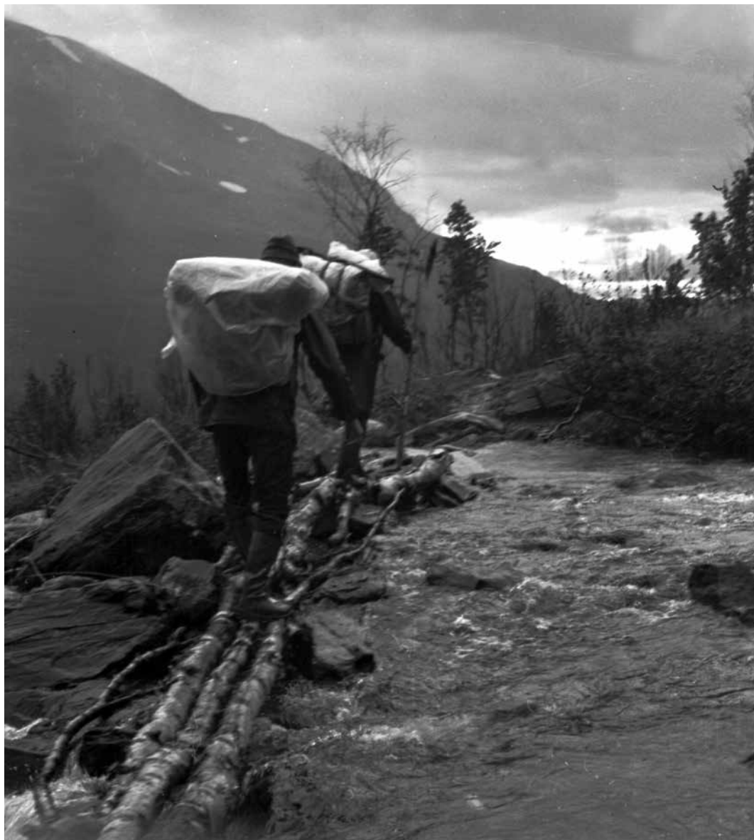
Bildet viser det gamle vadestedet over Trollelva i Rostadalen. Det var lagt ut bjørkestranger for å kunne ta seg over elva.

ørnefjæra! Og sånn fortsetter praten, stadig nye anekdoter fortelles.