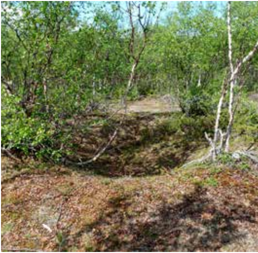
En av 76 fangstgroper ved et sammenhengende anlegg langs Suhttesgaldojohka.

Ildstedene er store, rundt 1x2m, og ligger oftest nedenfor skoggrensene. Rekkeorganiserte ildsteder er de seneste årene blitt påvist i området ved Guomojávrrit og Suttsgaldojohka. De har vært ildsteder inni i telt som må ha vært ganske store. De er ofte svært overgrodd og kan være vanskelig å få øye på. Det finnes nok mange av disse i Indre Troms som ikke er påvist.