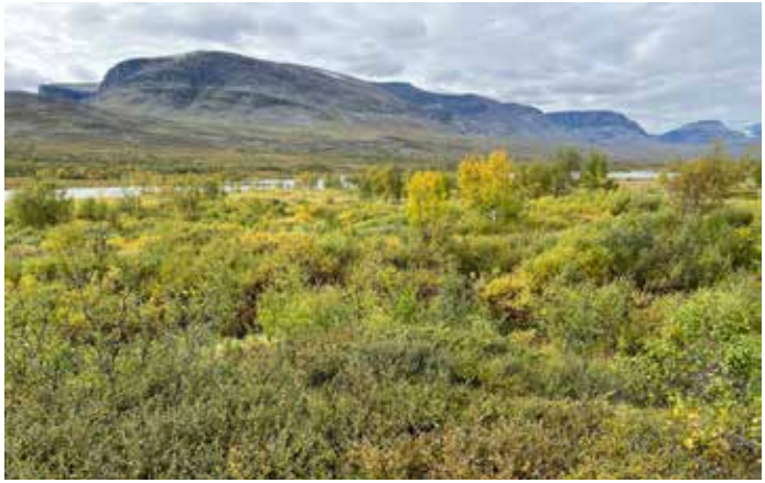
Langs nordsiden av Ánjajohka/Anjavasselva oppe i Ánjavuopmi/Anjavassdalen forteller eldre kilder om flere reindriftsamiske sommerboplasser Disse er det ikke lenger mulig å finne grunnet tilvekst av tett krattvegetasjon.

bark. Innerbarken på furutrær har vært benyttet som mat og sporene i trærne etter slik høsting bevares i flere hundre år. Et barktatt tre kan dateres til året uttaket skjedde. Den eldste datering fra slike tre i Dividalen er fra 1619 og den yngste fra 1863.