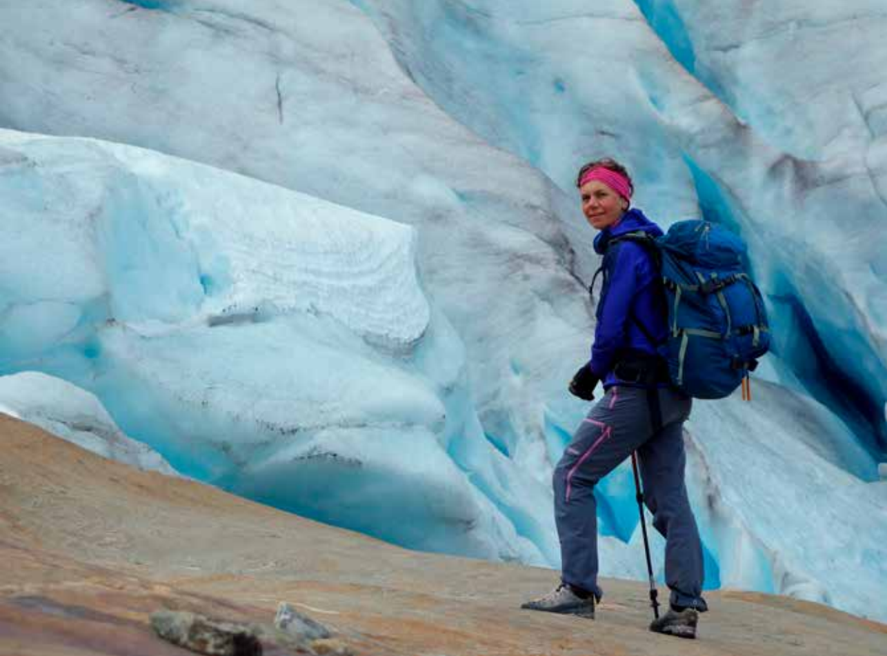
Tredje forsøk på Oksskolten.