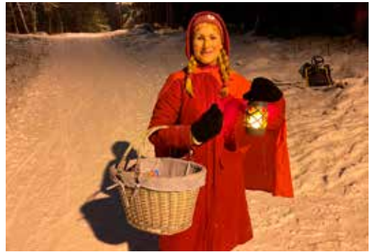
Rødhette anno 2024