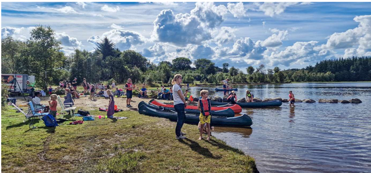
Kom-deg-ut-dagen ved Melsvatnet 4. september

Turlaget arrangerte Kom-deg-ut-dagen i februar i Kleppeloen og ved Melsvatnet i september med god deltaking. Det vart og gjennomført Natt-i-naturen i samband med Kom-deg-ut-dagen i september. I september var det tur med ulike postar rundt Melsvatnet. Det var moglegheit for kanopadling for dei som ville. Trekning av premiar blant dei som hadde levert inn svar på postane og alle barn fekk kvar sitt grillspyd.