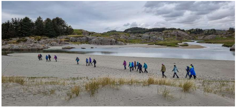
Nærtur på Sirevåg