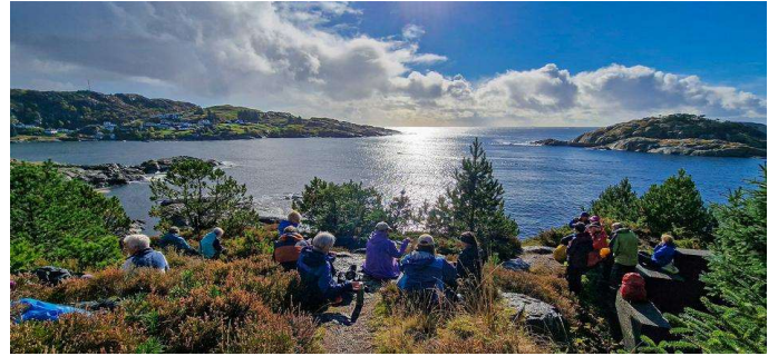
Hestnes i Eigersund