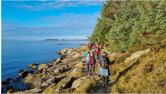
Hundvåg i Stavanger