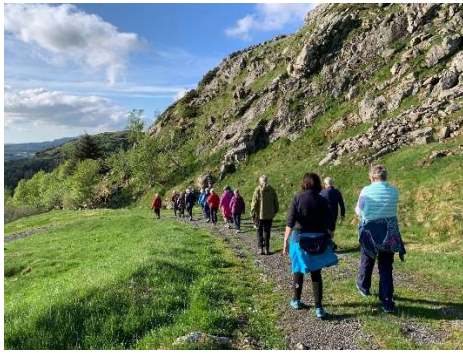
Nærtur på Undheim