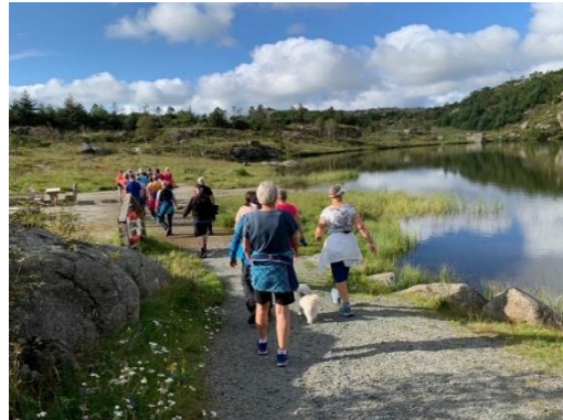
Nærtur «Grasdalen» Lyefjell