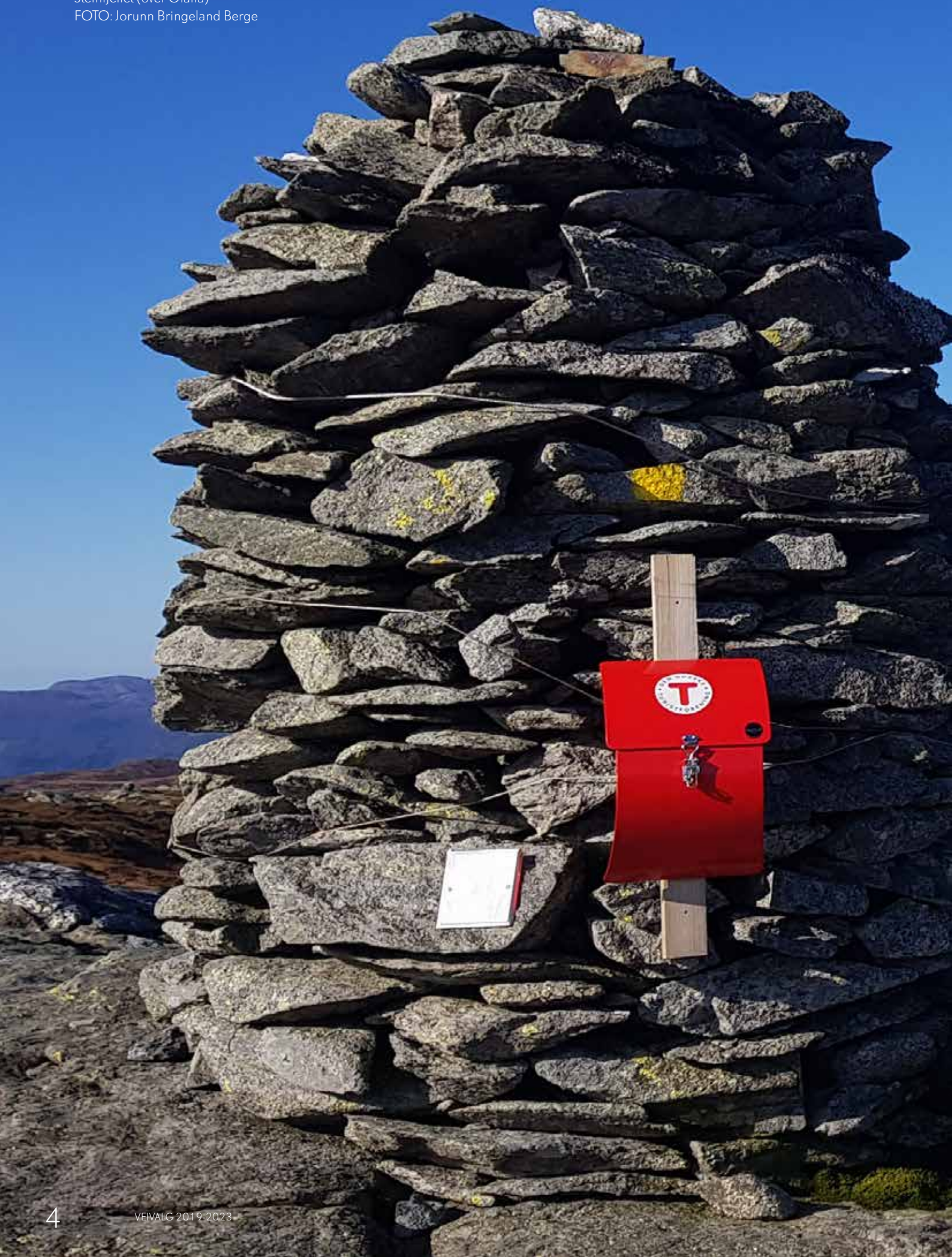
Steinfjellet (over Olalia)