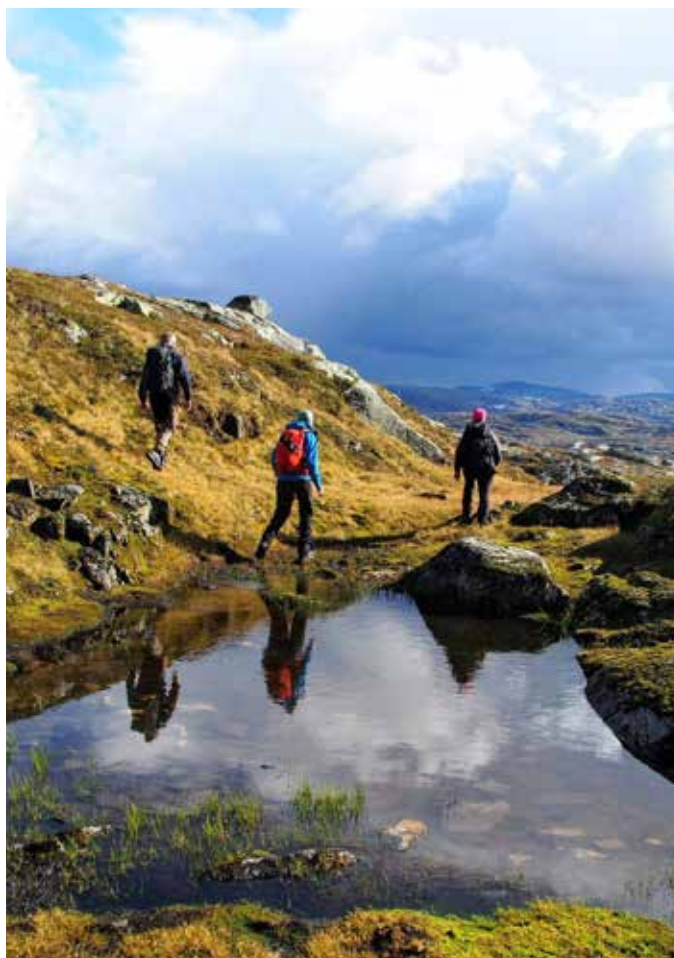
Til Grostølsnuten Seljestad.

Veivalg betyr å ta stilling til mål, prioriteringer og tiltak som setter HTs verdigrunnlag ut i livet.