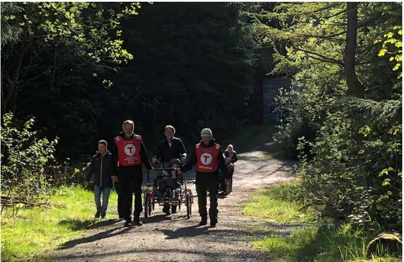
Friluftsliv for alle i Djupadalen.

Innen 2023 er vi godt rustet for videre vekst, og har møtt veksten på en måte som sikrer at frivillige, ansatte og medlemmer fortsatt er motiverte og engasjerte. HT skal forsøke å styrke viktige fellesfunksjoner som løfter samarbeidet og forenkler driften. Foreningene skal ha gode, lokale arenaer og aktiviteter som skaper tilhørighet og stolthet for medlemmer, frivillige og ansatte.