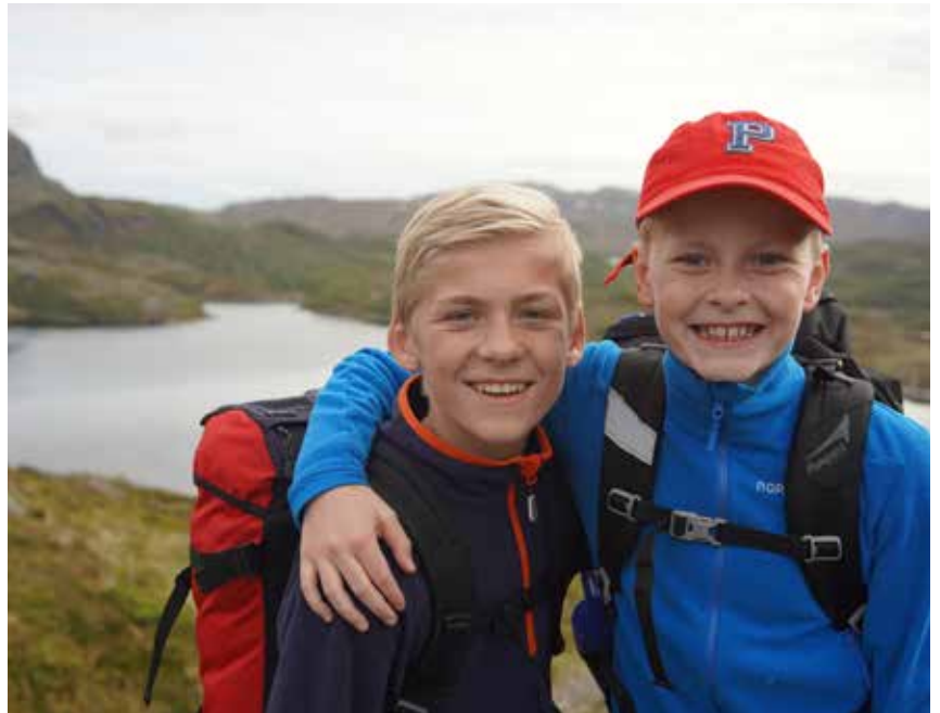
DNT skal sikre at barn og unge blir glade i naturen og tar vare på den, blant annet gjennom Barnas Turlag.

Bakgrunn: HT skal lykkes i å hindre naturinngrep og forstyrrelser som påvirker muligheten til et allsidig og opplevelsesrikt friluftsliv. Vi skal ha en tydelig og sterk stemme for å sikre natur- og friluftslivsinteressene. Innen 2023 har DNT, sammen med andre aktører, etablert en infrastruktur der våre hytter og ruter, sammen med miljøvennlig transport, gjør miljøvennlige turer enkelt å gjennomføre. Vi skal ha en drift som tar vare på klima og miljø i hele vår virksomhet, samt tiltak og retningslinjer for naturbaserte opplevelser som gjør at vi går foran med et godt eksempel og bidrar til å redusere klimautslippene.