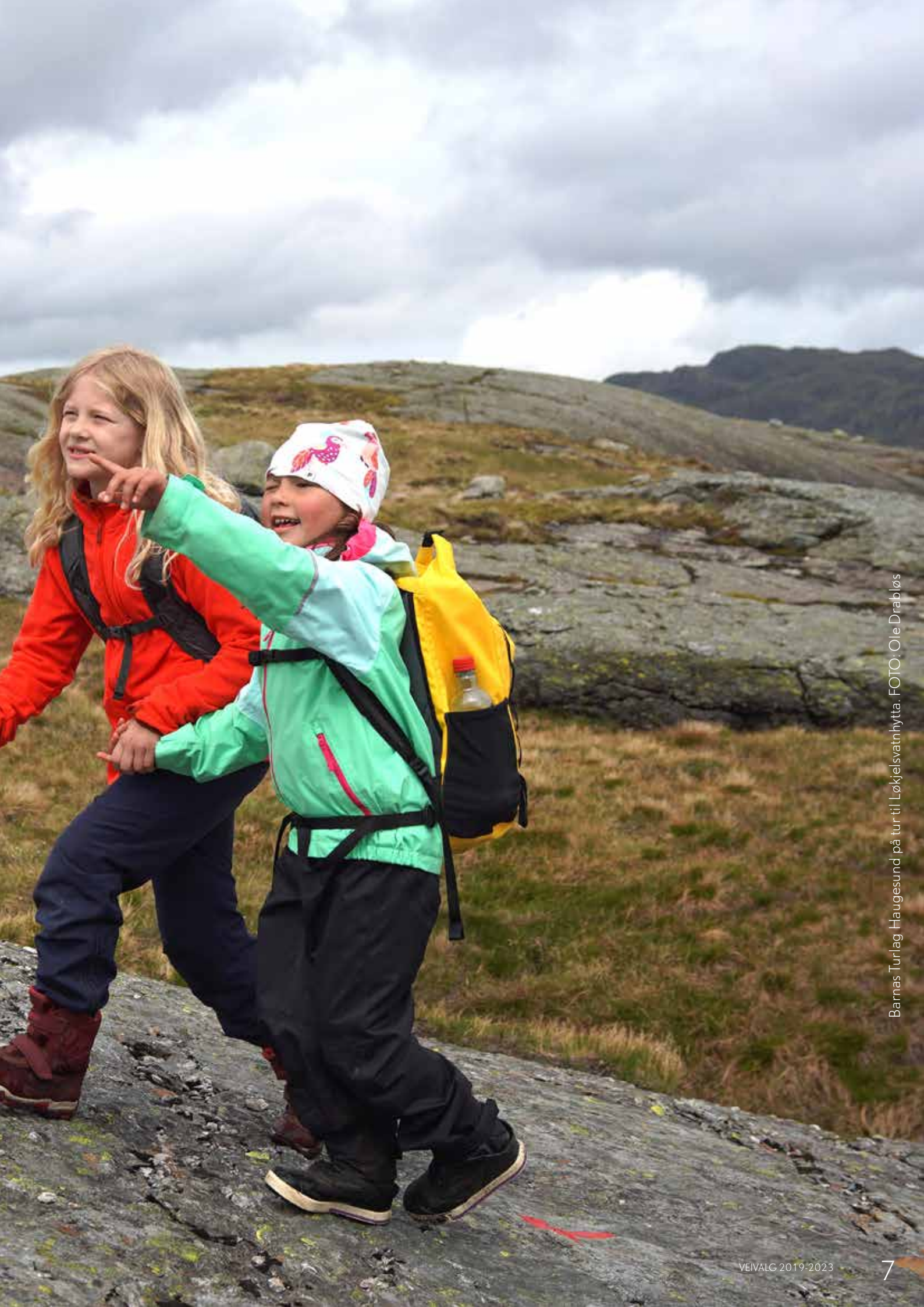
Barnas Turilag Haugesund på tur til Løkjelsvatnhytta.