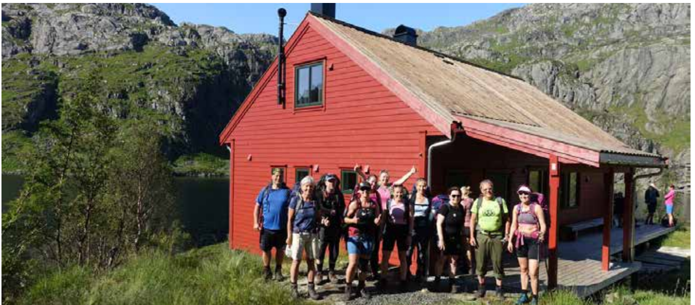
Fornøyd turfølge foran Storavassbu.