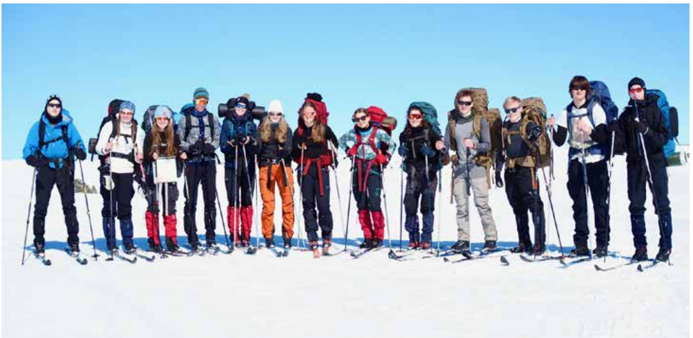
DNT ung Haugesund på den tradisjonsrike påsketuren over Hardangervidda.

Bakgrunn: For å oppfylle vårt oppdrag, er det viktig at HT er synlig utad. Skal vi få flere i aktivitet og ta vare på norsk natur, er vi avhengige av å samarbeide med andre, ikke minst politiske myndigheter. Vi er også avhengige av å være en sterk organisasjon med mange medlemmer i ryggen. Vårt politiske engasjement skal dreie seg om saker der vi har bred støtte blant våre medlemmer.