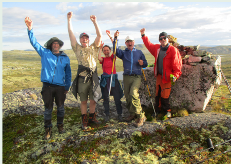
Rubenstur 2022

Rubenstur er en tilrettelagt ukestur på fjellet for personer med fysiske funksjonsnedsettelse i regi av DNT Telemark. Den arrangeres på Hardangervidda hver sommer, med ny rute fra år til år. Hensikten med Rubenstur er å gi mestringsfølelse, glede og selvtillit til mennesker med ulike fysiske funksjonsnedsettelse. Ønsket er å vise deltagerne at det er mulig å bevege seg i høyfjellsnatur, til tross for de utfordringene en funksjonshemming gir. Turene gir store helsegevinster for deltakerne, og er for mange årets høydepunkt.