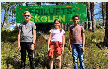
Friluftsskolen ble arrangert i flere turlag.