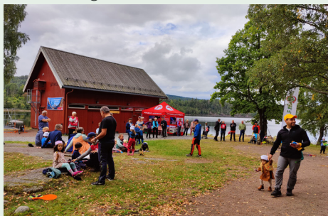
Feiring av Kom deg ut-dagen i Siljan høsten 2022.

til "ferskingkurs med overnatting ute", men dessverre ble dette arrangementet avlyst. Vi håper å kunne invitere til flere «Ferskingkurs» i 2023. På Ferskingkurset læres hva man bør ta med seg i sekken på tur, hvordan mat lages ute i det fri og hvordan man finner fram i skogen med kart og kompass. Kurset er beregnet på folk i alle aldre, som er åpne for litt konkrete tips fra en erfaren turleder. Kursopplegget er basert på praktisk læring i løpet av en kortere tur og etablering av leir med overnatting.