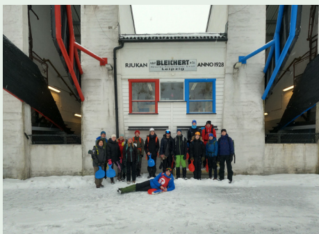
Vinterbasecamp med DNT ung Telemark på Rjukan.

I årene som kommer skal vi jobbe for å opprette enda flere DNT junior-grupper rundt om i Telemark – og derfor er vi veldig glade for at vi på tampen av 2022 fikk tilslag på denne 3-årige prosjektsøknaden hos Sparebankstiftelsen DNB, som gir oss mulighet til å ansette en ny fagansvarlig for barn og ungdom her hos på vårparten i 2023. Vedkommende skal først og fremst jobbe for å opprette flere DNT junior-grupper, i tillegg til å videreutvikle tilbudet for alle mellom 0 og 25 år her i DNT Telemark – herunder Barnas Turlag, Turboklubber, Unge Naturtalenter og DNT ung.