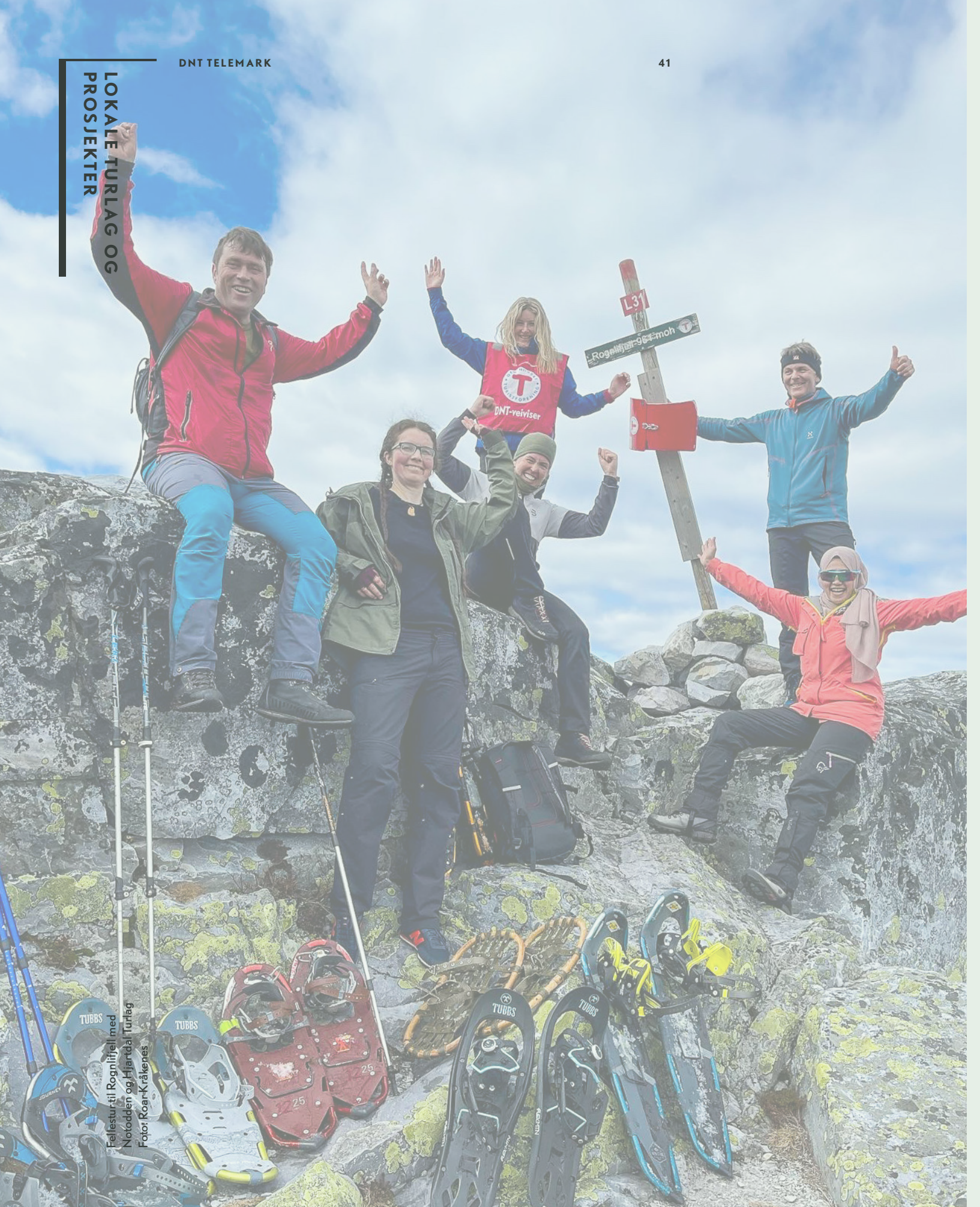
Fellesskur til Rognlifjell med Notodden og Hjarødal Turklubb