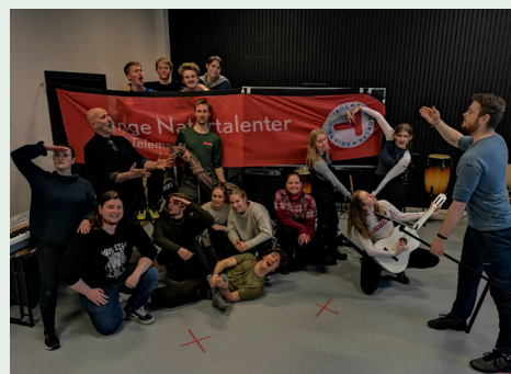
Unge Naturtalenter på Urban Næstur.

I 2022 var DNT Telemarks første kull med Unge Naturtalenter «ferdigutdannet». Veldig mange av ungdommene er fortsatt engasjert i DNT ung Telemark som frivillige og turledere.