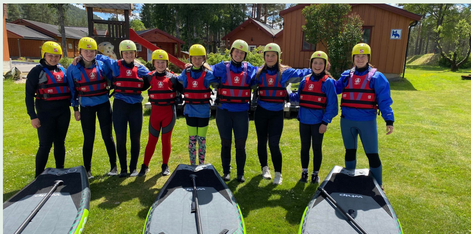
Basecamp med DNT junior Grenland i Evje.

DNT junior Seljord og DNT junior Kviteseid har også hatt litt aktivitet i