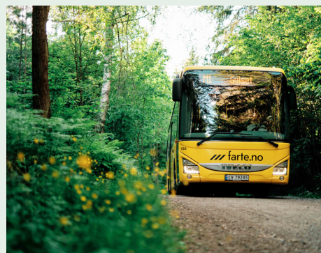
Bussen til bushen

leverandørsiden. På bakgrunn av det ble det bestemt å starte en prosess for å og flytte Ti-Topper'n til en ny og mer moderne teknisk løsning. Prosjektet skal ferdigstilles i 2023, og den nye nettsiden til Ti-Topper'n vil lanseres innen oppstart av ny sesong i mai. Fokuset i Bussen til Bushen-tilbudet har vært å bygge videre på samarbeidet med Fylkeskommunen og Farte. Målet er å jobbe for mer miljøvennlig transport, mindre bilbruk, mer hverdagsaktivitet, mer nærfriluftsliv og flere påstigninger på holdeplass som har skilting til turveger i Skien, Porsgrunn, Bamble og Siljan. Planen i 2023 er å merke og skilte flere turer i Grenland i samarbeid med turlaga, og