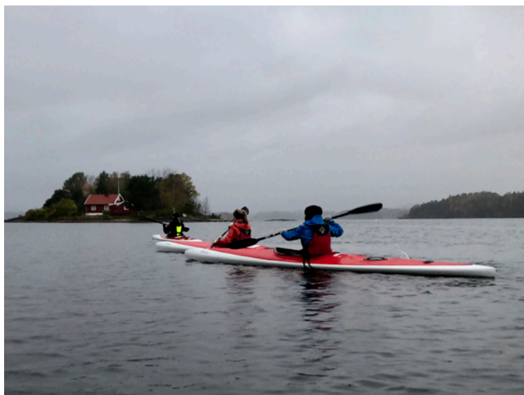
Padletur med DNT Ung Bærum