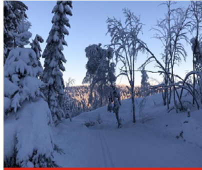
KOM DEG UT-DAGEN, VINTER

Arrangementet ble i år lagt til Nedre Gupu den første helgen i februar. Det ble en flott søndag i strålende vintervær. Ca. 400 barn og voksne tok turen til fots og på ski. Barnas turlag hadde hengt opp natursti med premie og lagt til rette for lek i snøen. Det ble steking av pinnebrød og grilling av pølser på bålplassen.