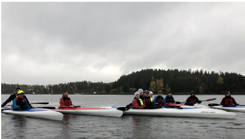
DNT UNG BÆRUM

Barnas turlag arrangerte kano-tur med overnatting til Fjorda ved Randsfjorden. I nydelig sommervær fikk 29 små og store en flott opplevelse.