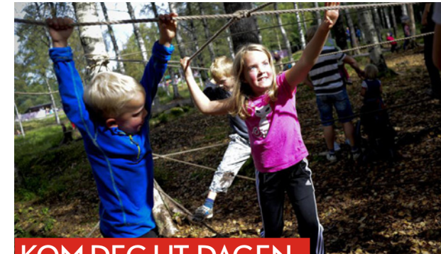
KOM DEG UT-DAGEN, 6. SEPTEMBER, 2020

Etter en lang og stille periode sendte Bærum turlag ut invitasjon til frivillige i turlaget. Nå er Bærum Turlag i gang igjen! Etter en kjedelig, stengt periode ønsket styret å takke de frivillige for fleksibilitet og kreativitet i en annerledes tid med krav om nødvendige smitteverntiltak. De frivillige har arbeidet med å endre, tilpasse og gjenåpne tilbudet med stor innsatsvilje. Om lag 50 personer takket ja til invitasjonen. Det var flere nye frivillige som deltok. En fin sommerkveld på Sæteren med super servering og hyggelig vertskap. De ulike aktivitetsområdene våre ble presentert.