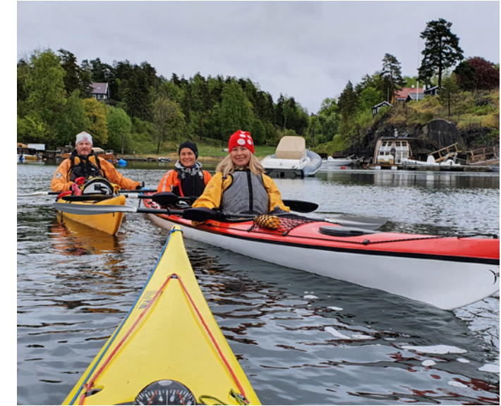
Kajakttur i Vestfjorden