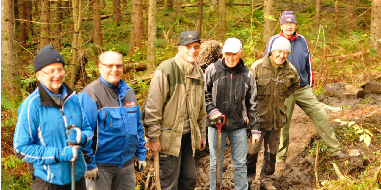
Glade stiryddere ved Bogstadvannet.