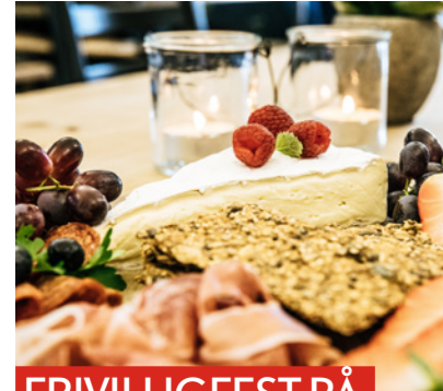
FRIVILLIGFEST PÅ SÆTEREN 25. JUNI

Bærum Turlag har i flere år arrangert «Den store turdagen» for sine medlemmer og innbyggerne i Bærum. I 2020 var det ikke noe unntak, men opplegget ble litt annerledes enn tidligere, på grunn av nasjonale pandemiregler og restriksjoner med å samle mange mennesker på ett sted. Bærum turlag inviterte til fem ulike turer som folk kunne gjennomføre på egenhånd med beskrivelse på turlagets hjemmeside/ ut.no: Brunkollen, Dælivann, Vestmarka, Tanum-platået, Gråmagan og Nordre Kolsåstopp.