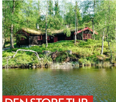
DEN STORE TUR-DAGEN 10. MAI 2020

I forkant ble det arrangert Natt i naturen med 22 påmeldte Turbofamilier. Det ble lek, eventyrstund og mat på bål. Alle sov ute i en stjerneklar natt.