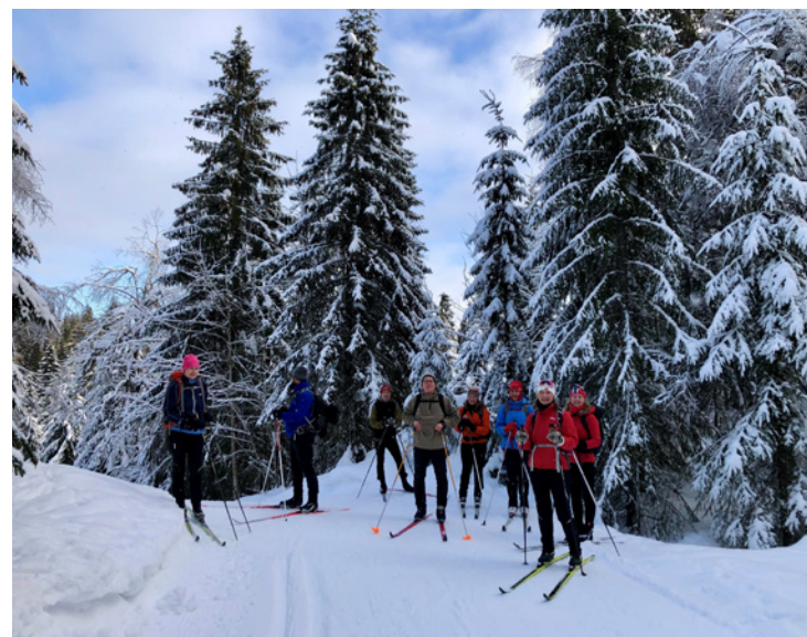
Skitur Franskleiv- Sollihøgda