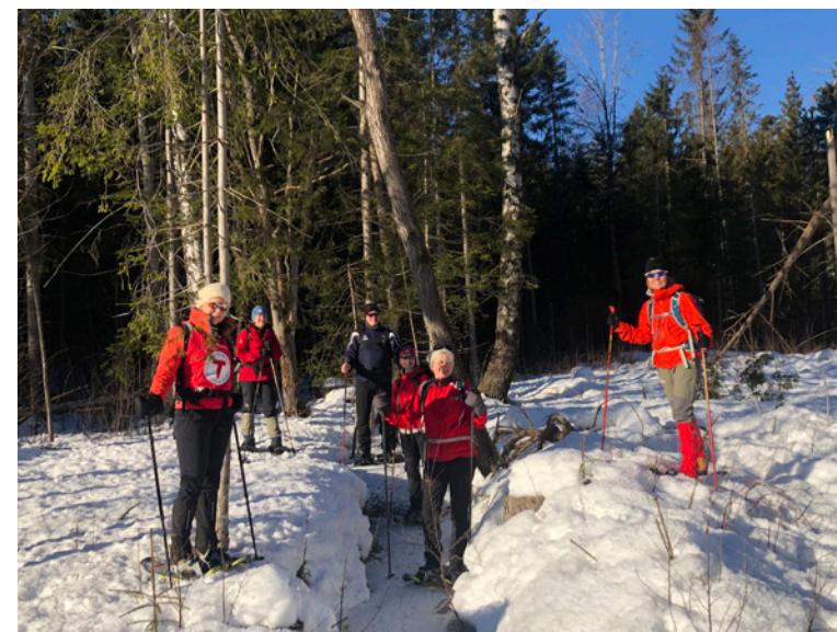
Trugetur i Bærumsmarka