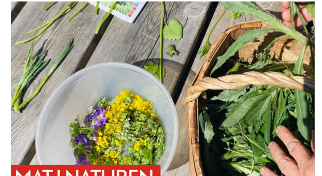
MAT I NATUREN

I stedet for å samle mange mennesker viste Bærum Turlag sin tilstedeværelse med stand på tre ulike steder i kommunen: På Kalvøya, på Nedre Gupu og på Sæteren gård. Turgåere møtte turlagets folk. Vi fortalte om våre tilbud i Bærum, ønsket dem god tur med litt karbohydrater til påfyll for turen videre. Mange blide og glade turgåere fikk en hilsen fra Bærum turlag denne dagen. Vi anslår at vi var i kontakt med 1200 – 1400 personer på de stedene vi var representert.