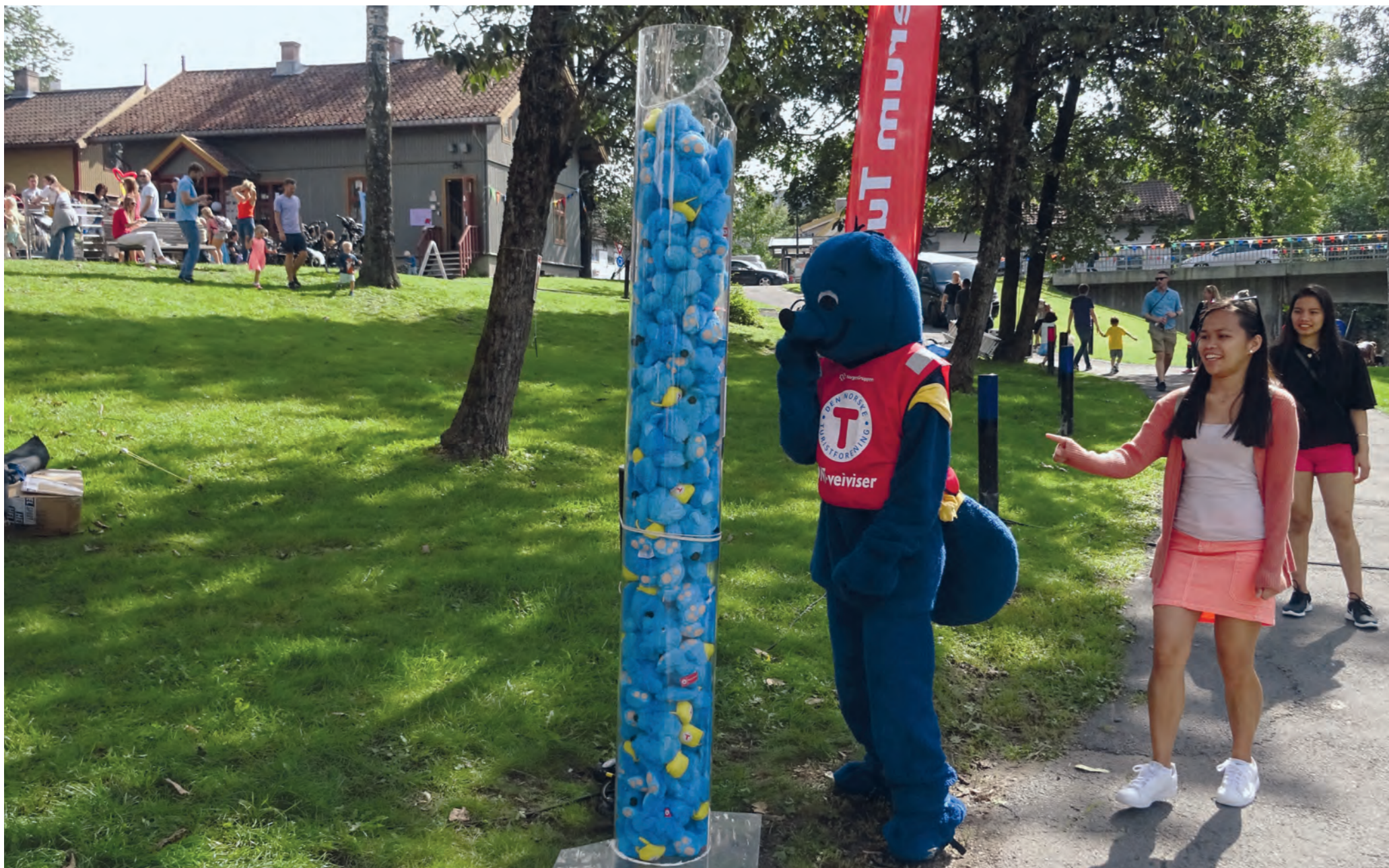
Byfesten i Sandvika.