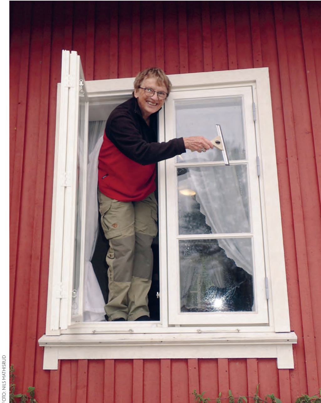
Høstdugnad på Nedre Gupu.

Bærum Turlag ønsker å utvikle tilbud og aktiviteter som kan bidra til skolenes arbeid på dette området. Vi mener at Nedre Gupu er et svært egnet sted for slike aktiviteter. Vi har i løpet av året kontaktet flere skoler for å få vite hvilke ønsker og krav de har til mulige tilbud fra turlaget. Dette arbeidet må intensiveres i 2020 og vil danne grunnlag for mulige praktiske tilpassinger på Nedre Gupu.