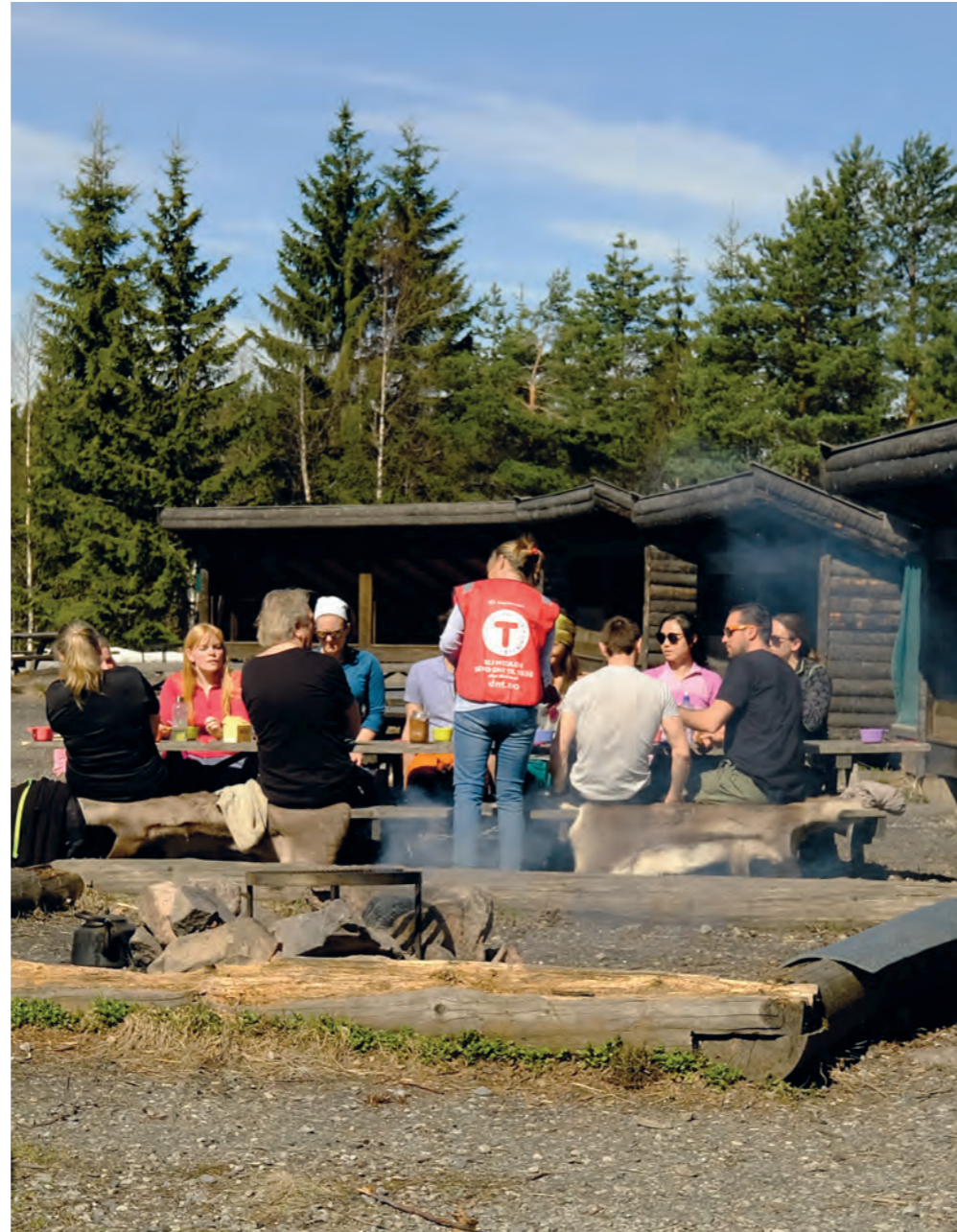
Ferskingkurs på Nedre Gupu.

Bærum Turlag har også arrangert fotokurs, yogakurs og arrangementer med matlaging, sjokoladesmaking og vinsmaking på Nedre Gupu. Alt i kombinasjon med turer og friluftsliv.