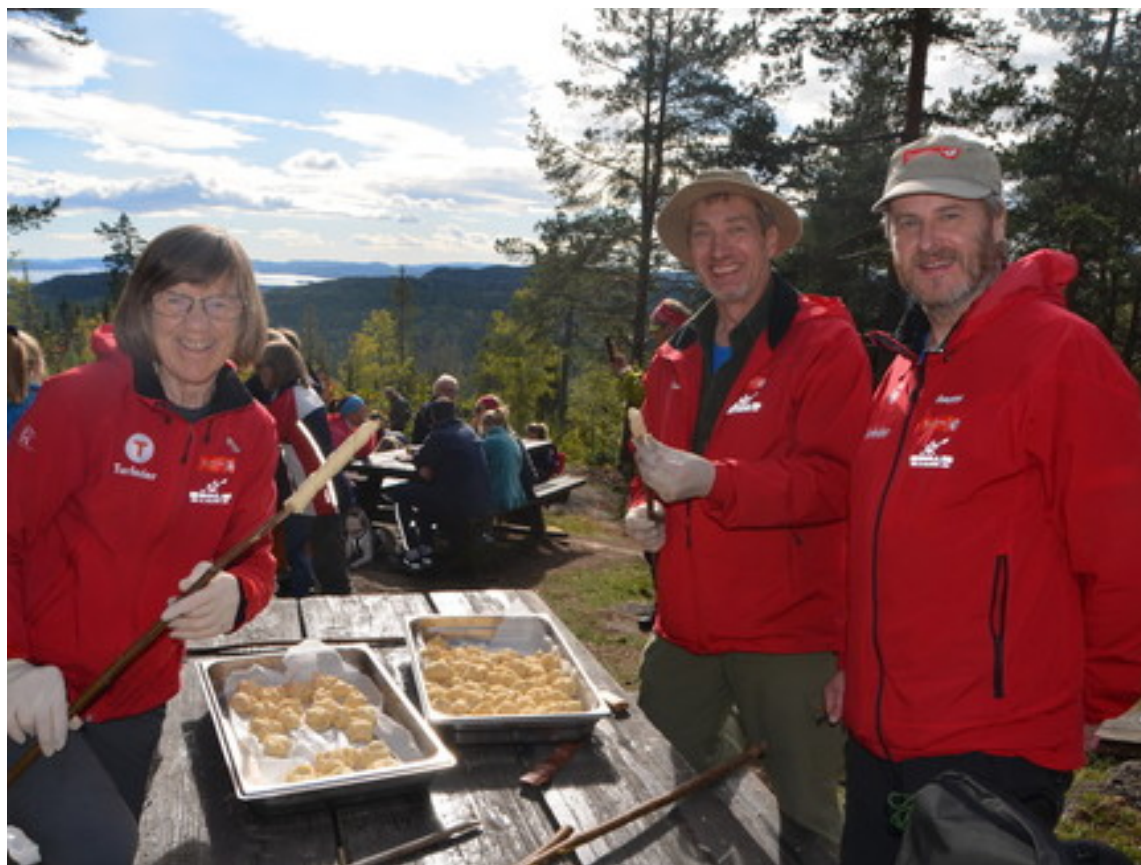
Frivillige på Den store turdagen.