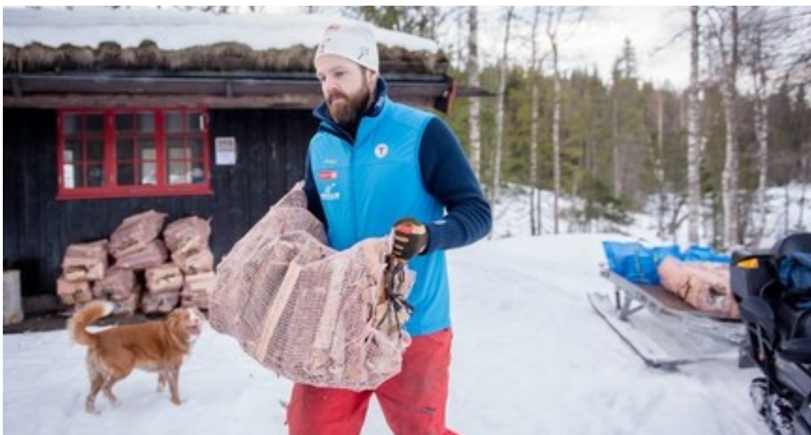
Veddugnad på Svartvannshyttta.