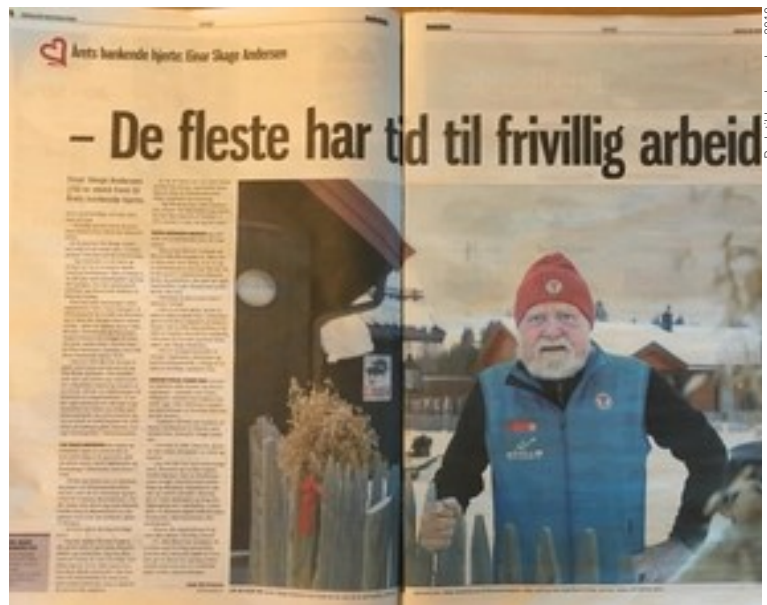
Budstikka desember 2018