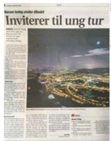
Budstikka november 2018