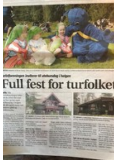
Budstikka september 2018