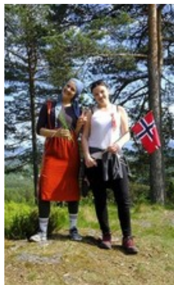
Fra 17.maiur.

Bærum Turlag kan oppløses på årsmøtet med minst \frac{3}{4} flertall. Styret i DNT Oslo og Omegn kan overprøve årsmøtets vedtak i en oppløsningssak. Styret i turlaget skal i dette tilfelle varsles om behandlingen i DNT Oslo og Omegns styre senest fire uker før styremøtet og gis anledning til å legge fram sine synspunkter skriftlig senest en uke før møtet. Ved oppløsning tilfaller alle midler DNT Oslo og Omegn.