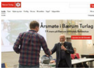
Utsnitt av www.baerumturlag.no

En siste sak vi har prøvd å rette oppmerksomhet mot er Presterud gård på Bekkestua. I dag står gården tom, men turlaget har gjort seg til talsperson for å gjøre innendørsarealene på gården om til et Frivillighetens hus i Bærum, der frivillige organisasjoner i Bærum kan få tilgang til kontor, møterom, lagerrom og arkivplass.