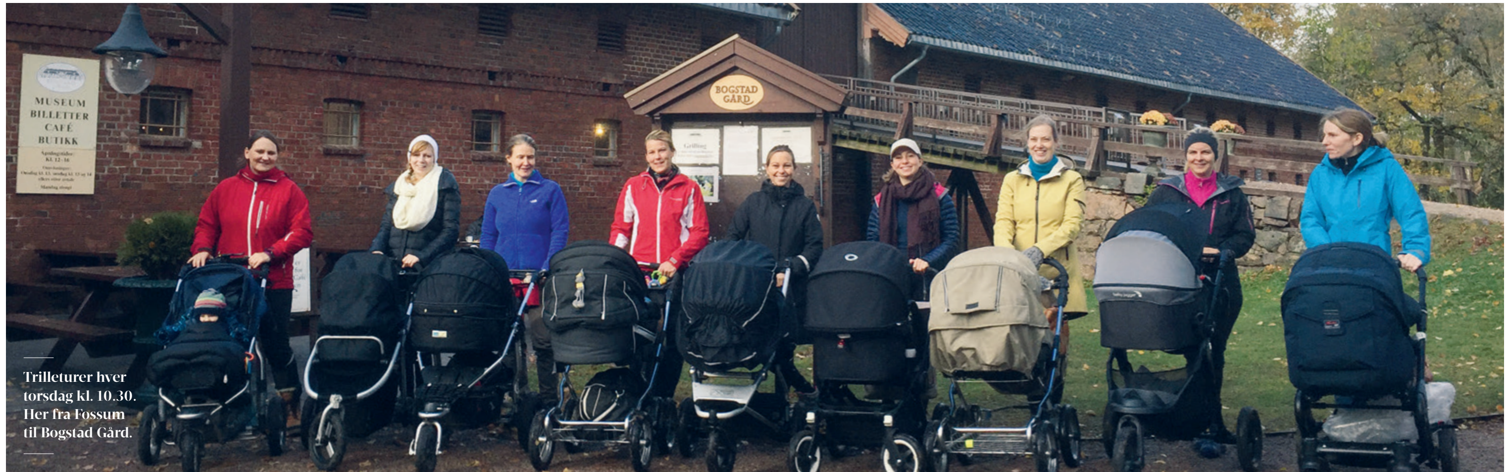
Trilleturer hver torsdag kl. 10.30. Her fra Fossum til Bogstad Gård.