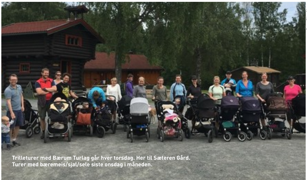
Trilleturer med Bærum Turlag går hver torsdag. Her til Sæteren Gård. Turer med bæremeis/sjal/sele siste onsdag i måneden.