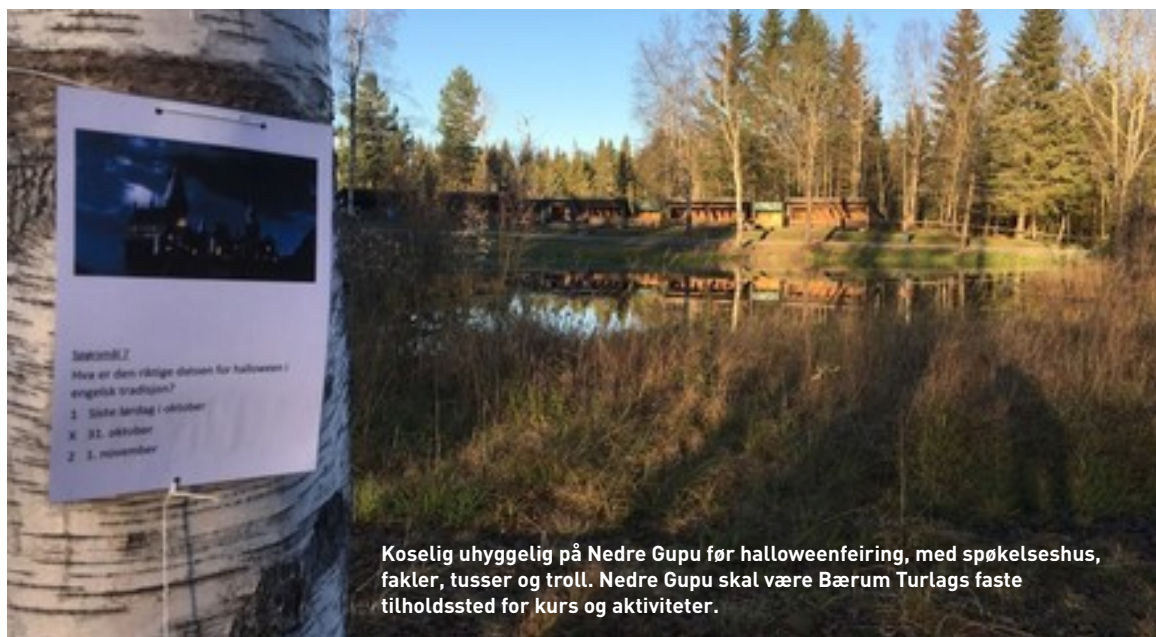
Koselig uhyggelig på Nedre Gupu før halloweenfeiring, med spøkelseshus, fakler, tusser og troll. Nedre Gupu skal være Bærum Turlags faste tilholdssted for kurs og aktiviteter.

Bærum Turlag vil arrangere minst to medlemskvelder i året.