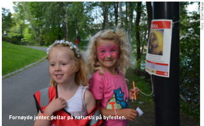
Fornøyde jenter deltar på natursti på byfesten.