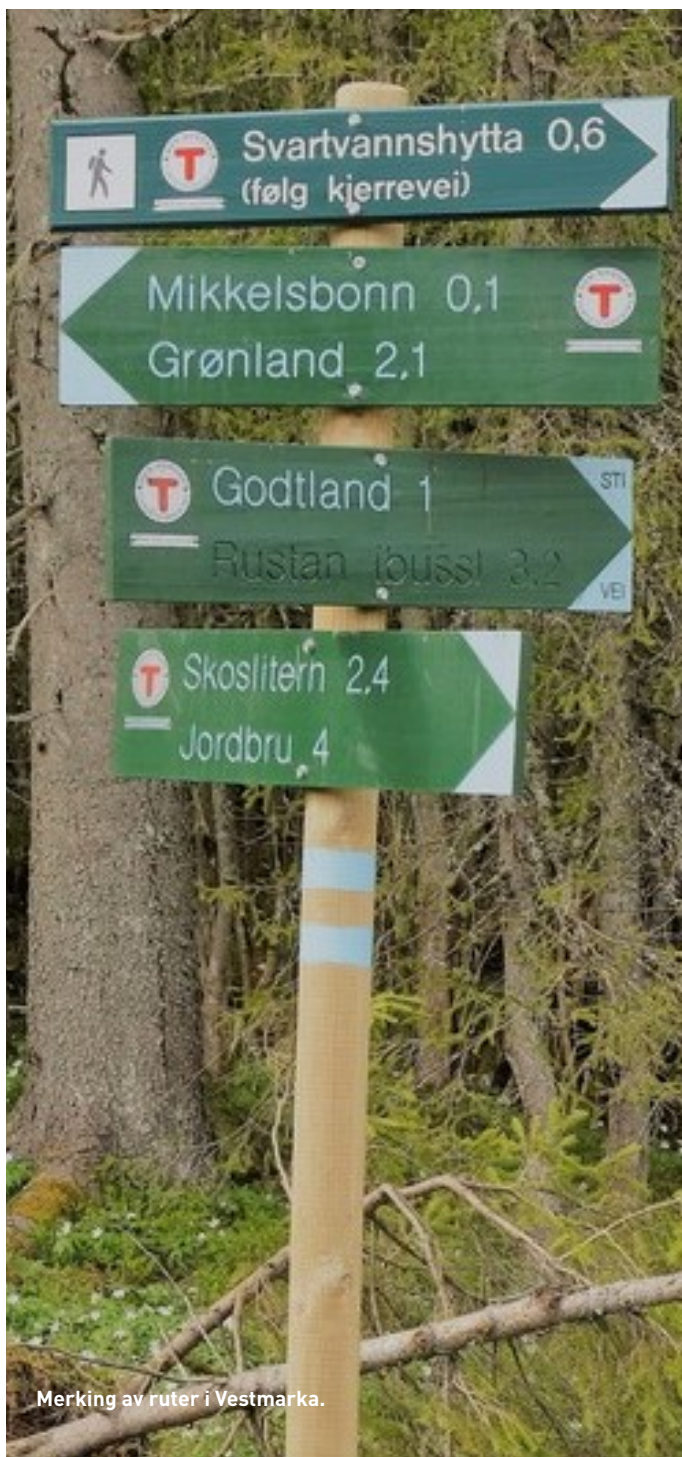
Merking av ruter i Vestmarka.