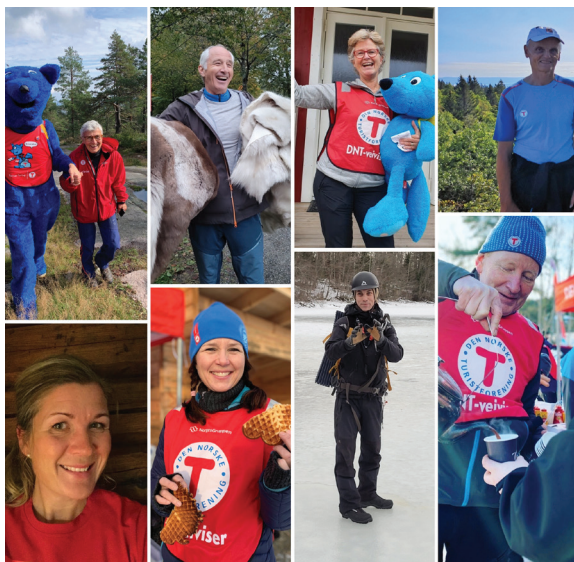
Styret i DNT Asker Turlag 2021