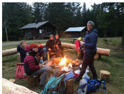
Hodelykt tur til Myggheim

Det ble gjennomført 12 aktiviteter i regi av Barnas Turlag i 2021; innekltring, overnattingstur til Småvannsbu, kveldsmatturer til ulike steder, søndagsturer, lommelykttur og åpne markahytter på Kom-deg-ut-dagen. Dette samlet mange turglade barn og voksne.