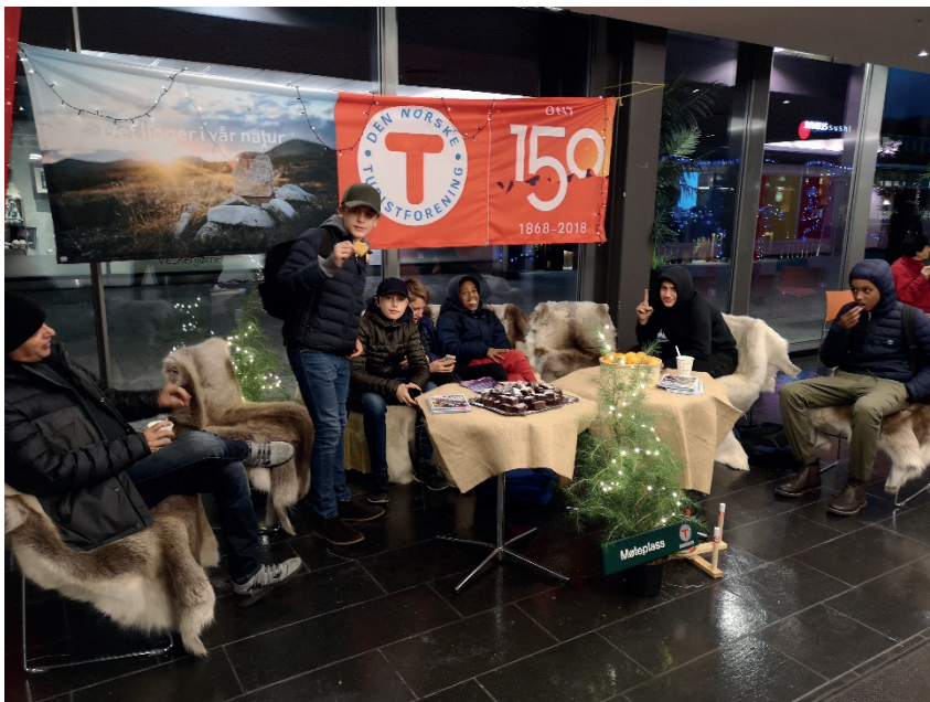
Grønn fredag.

Grønn Fredag ble for første gang arrangert i Asker. Grønn Fredag er en nasjonal byttedag i regi DNT ung som foregår over hele landet, som en motsats til Black Friday. Her kan man gi bort eller selge brukt friluftsutstyr og klær som man ikke lenger behøver, eller bytte til seg noe man trenger. Arrangementet ble avholdt i Asker Kulturhus i samarbeid med Kulturhjørnet og med fint bidrag av utstyr fra Yggeset gjennvinningsstasjon. Det ble en fin markering med fokus på miljø og bærekraft. Det ble i 2018 luftet muligheten for et samarbeid med valgfag friluftsliv om gjennomføring av arrangementet. Det legges opp til dette i 2019.