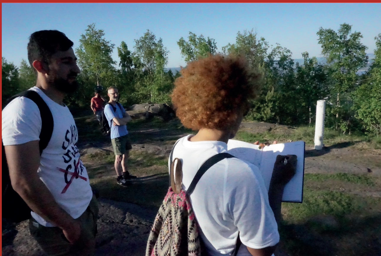
Internasjonal torsdagstur til Skaugumsåsen.

Partnerskap for Folkehelse; Asker kommune, Asker Turlag og DNT Oslo og Omegn