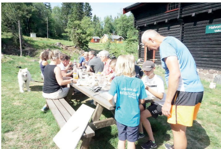
Dugnad på Halvorsenhytta