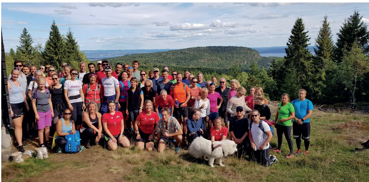
7-topperstur i Vestmarka, her utenfor Halvorsenhytta

Hytta var en periode preget av mye muselukt, men dette er helt borte etter jobben som asker kommune gjorde!