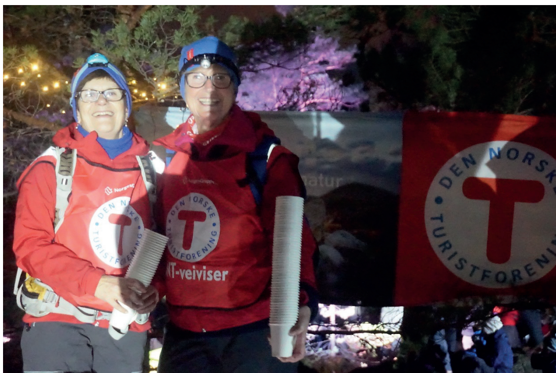
To fornøyde frivillige