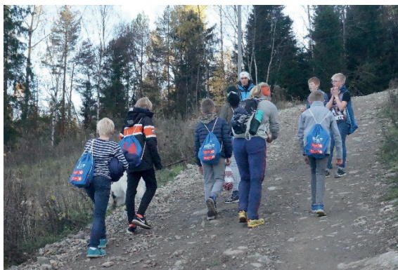
Vedbæring før nattevandringen