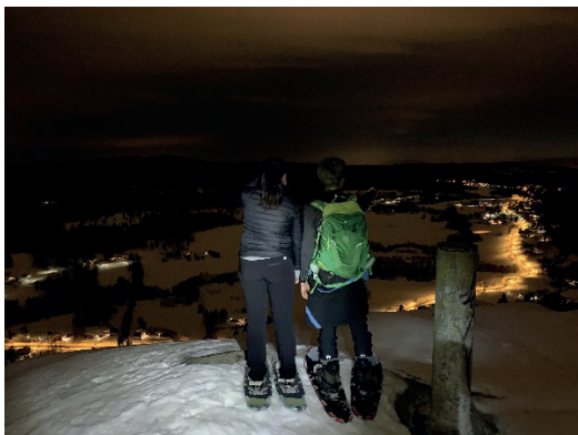
Trugetur til Vardåsen

Både Friluftsklubben for 7.trinn i Borgensonen og nyoppstartede #AskerOnsdag for ungdom i Asker har vært på turer til Wentzelhytta i løpet av året, og gleder seg til åpne dører!