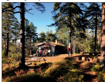
Dugnad på Småvannsbu.

Innsatsen gjenspeiler seg i mange hyggelige tilbakemeldinger i hyttbøkene om hvor bra hyttene blir vedlikeholdt og hvor godt fornøyde gjestene er med oppholdet.