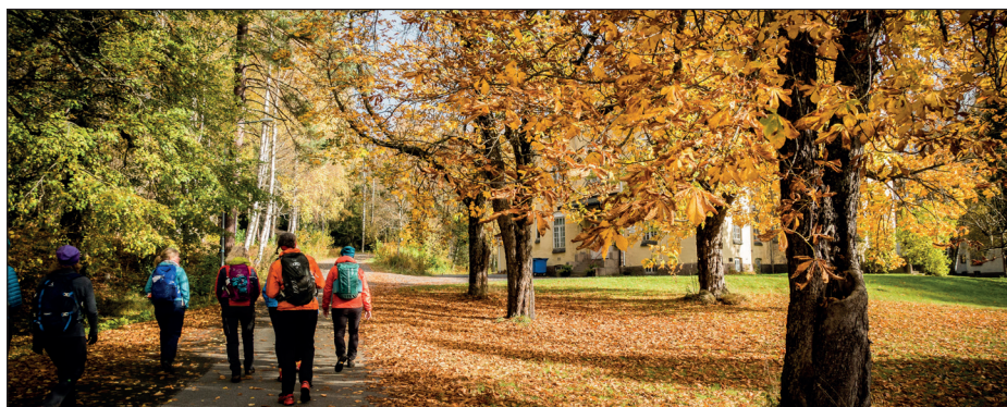
Pilegrimsleden ved Dikemark.

Tunsbergleden er pilegrimsleden fra Larvik til Haslum i Bærum. Leden er bindeleddet mellom pilegrimsleden på Jylland i Danmark og Gudbrandsdalsleden. Tunsbergleden er resultat av samarbeid mellom fylkeskommuner, kommuner og frivillige lag og organisasjoner.