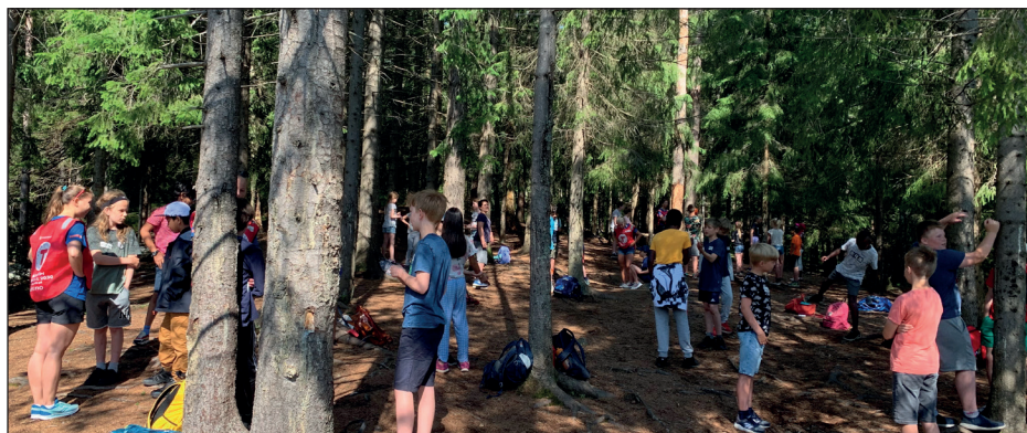
Pauselek på Friluftsskolen.