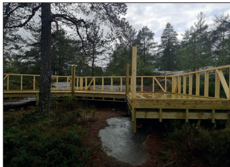
Ny gapahuk ved Wentzelhytta.