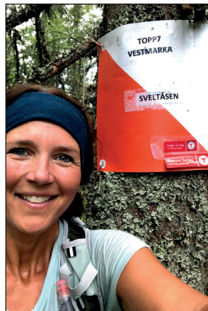
Svett deltager på Sveltåsen.

Grunnet koronarestriksjoner gikk årets arrangement uten turledere. Det ble brukt mye tid på å merke opp løypene slik at alle kunne gå turen alene eller i mindre grupper, når det selv passet dem. Turkart og turbeskrivelser ble gjort tilgjengelig på turlagenes nettsider fra 17. august.