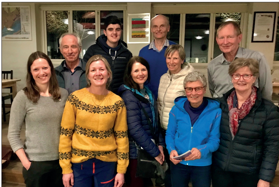
Styret og administrasjonen i DNT Asker Turlag 2020.