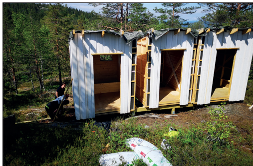
Dugnad på Wentzelhytta.