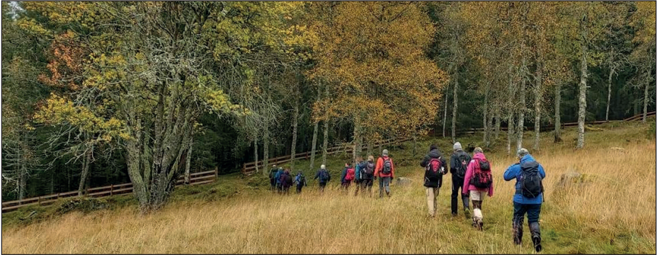
På vei ut fra Finnstad.

I 2020 er det befart og vedlikeholdt stier i hovedområdene Kjekstadmarka/Vardåsen, Vestmarka, Kyststien, rundturene og sentrumsområdet. Turlaget har ansvaret for omtrent 333 km med blåmerkede stier. Hvert hovedområde har egen områdeleder. Ansvarlige for hver enkelt blåmerkede sti utfører kontroll og vedlikehold av stiene minst to ganger i tursesongen.