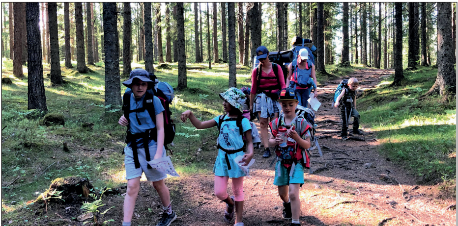
På vei til Småvannsbu for overnattingstur med DNT Barnas turlag.

Friluftsskolen ble arrangert i uke 25 i samarbeid med Asker Kommune, samt økonomisk støtte fra Viken Fylkeskommune og Bufdir. Dette var 4. året Friluftsskolen ble arrangert med 32 deltakere.