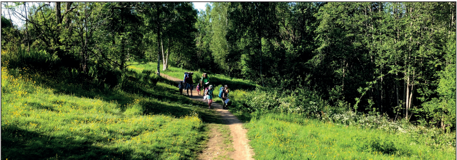
På vei til Småvannsbu med Barna Turlag.

Dokumentet er elektronisk godkjent og signert, og har derfor ikke håndskrevne signaturer.