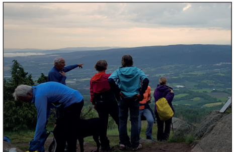
Glasåsen.