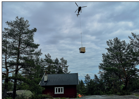
Dugnad på Wentzelhytta.

I 2020 har vi fått en helt ny tilsynsgruppe på Wentzelhytta. Det er også kommet nye tilsyn på de andre 3 hyttene.