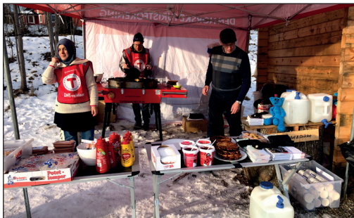
Kom deg ut dagen februar 2020.