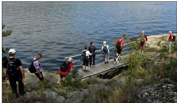
Verpenåsen - Sandspollen.

20 rundløyper på til sammen 80 km var ferdig merket i november 2018. I løpet av de to årene som har gått, er løypene blitt flittig brukt både av enkeltpersoner og arrangerte turer.