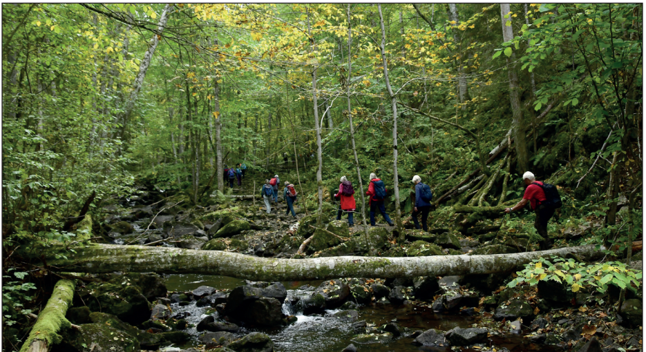
På tur ved Asdøljuvet.

I partnerskapsavtalen har partene et felles mål om å legge til rette for god folkehelse og en helsefremmende stedsutvikling gjennom friluftsliv for alle. Hovedmålet for avtalen er å tilrettelegge og utvikle tilbud som rekrutterer bredt til friluftslivet med et ekstra