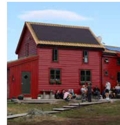
REN ENERGI: Stranddalen turishytte i Ryfylkeheiene har investert 2 millioner kroner i solcelleanlegg.