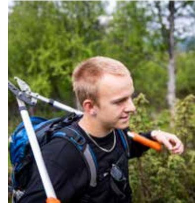
SAMARBEID: Sammen med Slidreøya fengsel har DNT Valdres hatt merkekurs med innsatte.