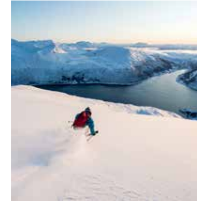
MILJØVENNLIG TRANSPORT: Troms Turlag har satt opp bussavganger til populære toppurtmål.