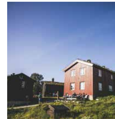
NÆRT: Mange av DNTs betjente hytter, som feks Svukuriset (bilder) har fokus på kortreist mat og lokale mattradisjoner.