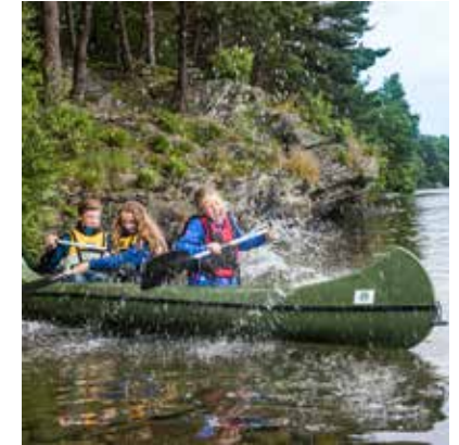
KANOURLÅN: Frilager i Rogaland har blant annet 124 kanoer til utleie.