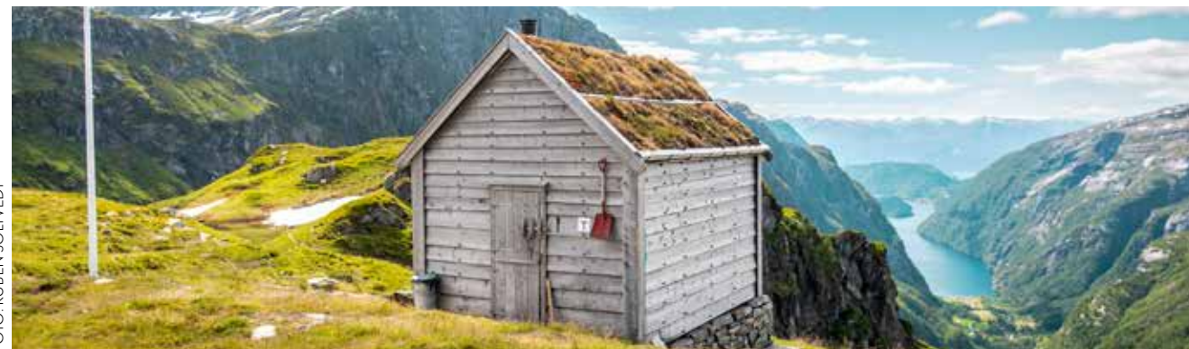
VAKKER UTSIKT: Kiellandbu, med utsikt mot Fykkesund og Hardangerfjorden.

Sirkulærøkonomi er viktig for bærekraftig hyttedrift og ved bygging av nye hytter. Det innebærer gjenbruk og effektiv utnyttelse av ressursene. Dette innebærer blant annet å redusere matsvinn og annet avfall, velge produkter med god kvalitet og lang levetid samt å gjenbruke materialer.