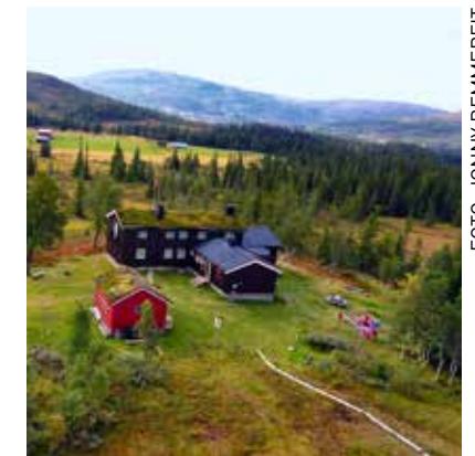
URØRT: Schulzhytta ligger i det siste store naturområde i Trøndelag uten kraftutbygging eller veiforbindelse.