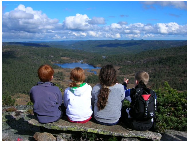
Utsikt fra kanten av Solhomfjell

Flere enn tidligere kommer også fra andre land. Toppturboka på Risfjell viser for eksempel i 2024 at hele 15 % av besøket kommer fra utlandet, (Tyskland, Nederland og Belgia).