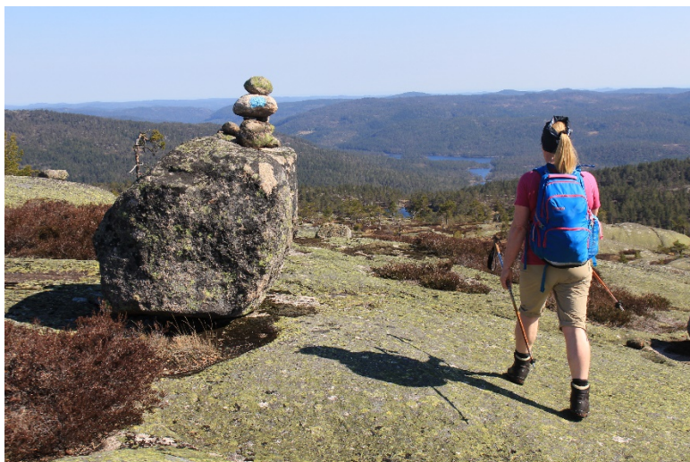
Utsikt fra turløypa over Marishei

Dette kommer ikke i konflikt med at kommunen kan satse på hytteutvikling i andre deler av kommunen, nærere grender og eksisterende infrastruktur. Dette er mer positivt for både næringsliv og lokalsamfunn. Det må da være mye bedre at skogeiere i Gjerstad bidrar til lokal verdiskaping, enn at utbyggingen skjer i det viktige området i Statskogen, der mye av verdiene går rett i statskassa og ut av bygda, mens vi blir sittende igjen med redusert tilgang til våre viktigste natur- og friluftsområder.