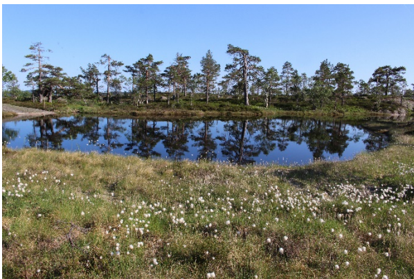
En av flere idylliske tjern på Risfjell – Trollfjell

På grunn av lang avstand fra vei og driftsteknisk vanskelig terreng er det på Risfjell og Trollfjell ikke lønnsomt med skogbruk. Naturen er derfor relativt urørt, med mye gammelskog, flere områder med viktige naturtyper, nøkkelbiotoper og rødlistearter. Deler av området er også registrert som inngrepsfri natur (mer enn 1 km fra tyngre menneskelige inngrep).