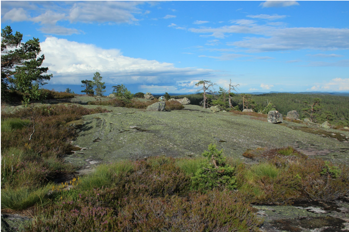
Risfjell med store åpne fjell midt i hjertet av Statskogen

Et område med spesielt høy verdi for natur og friluftsliv innenfor det regionalt viktige friluftslivsområdet i øvre del av Gjerstad, og som ennå ikke er verna som naturreservat er området Risfjell – Trollfjell.