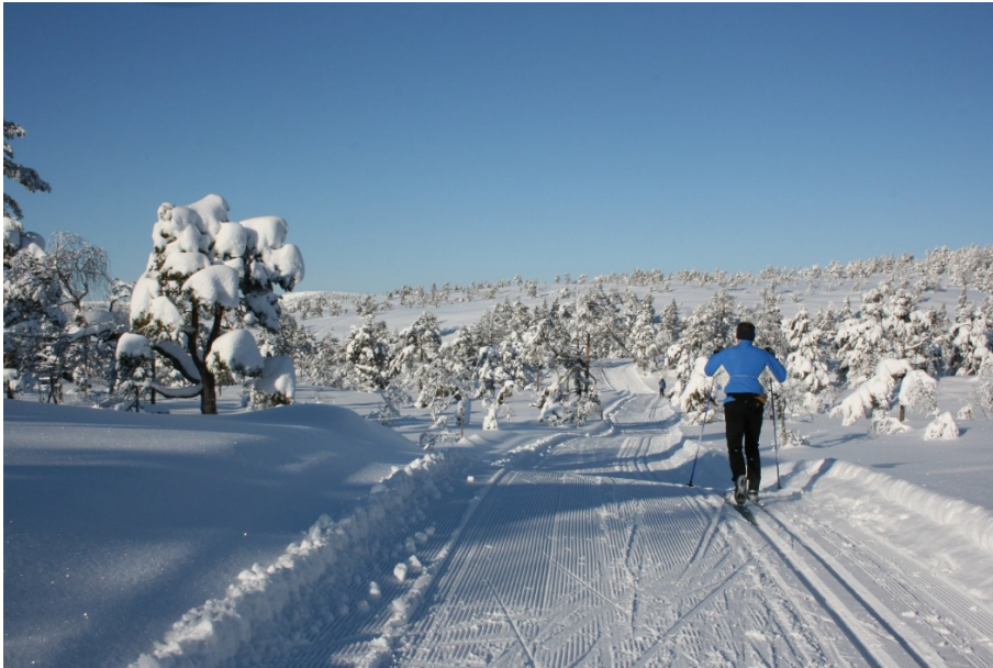
Skiløypene til Gjerstad IL innover Drivheia

Vest for Kleivvann har vi både Statskog og private eiendommer. Der har kommuneplanen gjennom mange 10-år hatt skjerming mot utbygging og der er det ikke nye hytter. Dette har gitt grunneierne muligheten til å stenge bilveien sin om vinteren for å bruke den til skiløype. Derfor kan Gjerstad IL hver vinter gi hele distriktet 25 km med spesielt godt preparerte skiløyper gjennom fin natur. I toppåret 2021 registrert vi over 33 000 besøk innover i disse løypene.