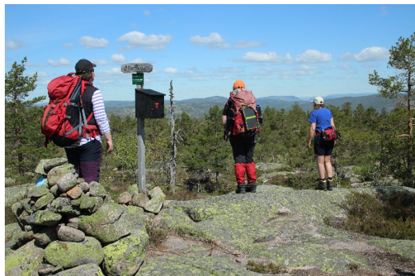
Toppen av Risfjell