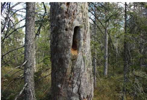
Hull etter svartspett nord i Risfjell

I 2020 leverte Havrefjell Turlag og Aust-Agder Turistforening, med tilslutning fra Forum for natur og friluftsliv Agder, inn et forslag om vern av Risfjell – Trollfjell til Miljødirektoratet, (fiolett strek).