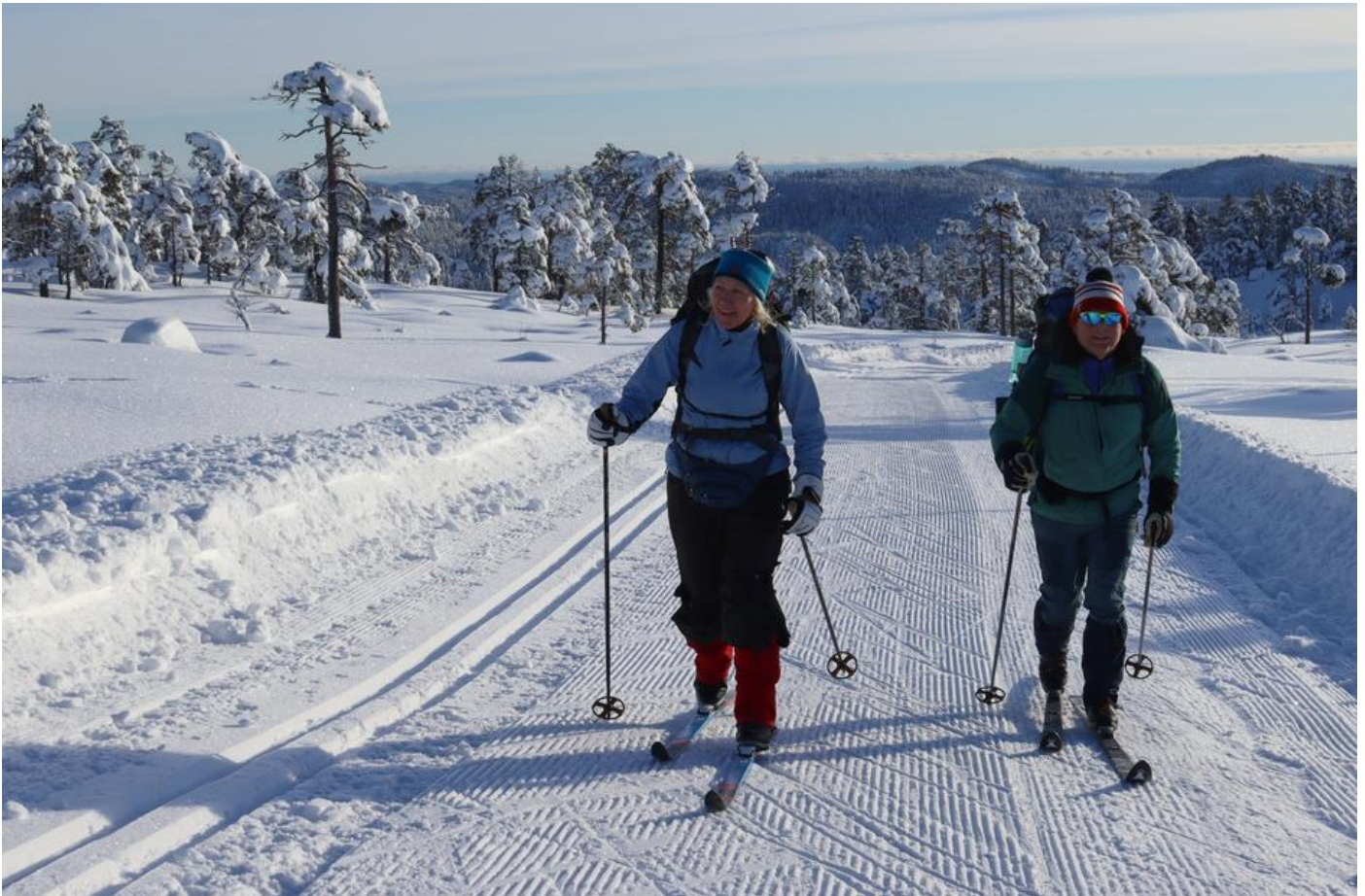
Drivheia laurdag 21. januar 2023.

Tysdag 11. april kl. 07.40: Det er nå meldt dagar med regn og mildvêr, og det ser ikkje ut til at blir aktuelt å preparere meir skiløyper denne sesongen. Vi takker Gjerstad IL og dei gode løypekøyrarane for ein fantastisk fin skivinter, og ynskjer velkommen igjen til fine forhold neste sesong. Sjå film her frå Drivheia laurdag 1. april.