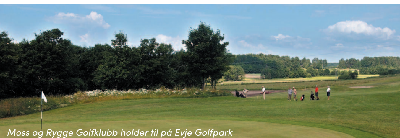
Moss og Rygge Golfklubb holder til på Evje Golfpark