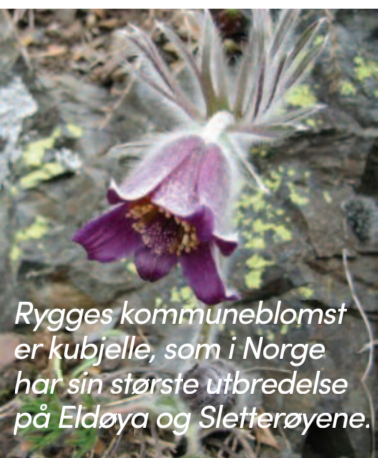
Rygges kommuneblomst er kubjelle, som i Norge har sin største utbredelse på Eldøya og Sletterøyene.

Larkollen var tidligere et lite ladested, som også på 1700- og først på 1800-tallet spilte en rolle i militære sammenhenger på grunn av gunstig strategisk beliggenhet. Larkollsundet ble også tidlig ansett som en god havn, skjernet og med stor dybde nær land. Tidligere lå kystfortet Fredriksodde ved Larkollsundet, men dette er forlenget revet. Etter 1. verdenskrig ble det imidlertid reist en monumental sommervilla over ruinene som ennå er markert synlige. Fortet ble anlagt i 1711, men kom aldri i kamp.