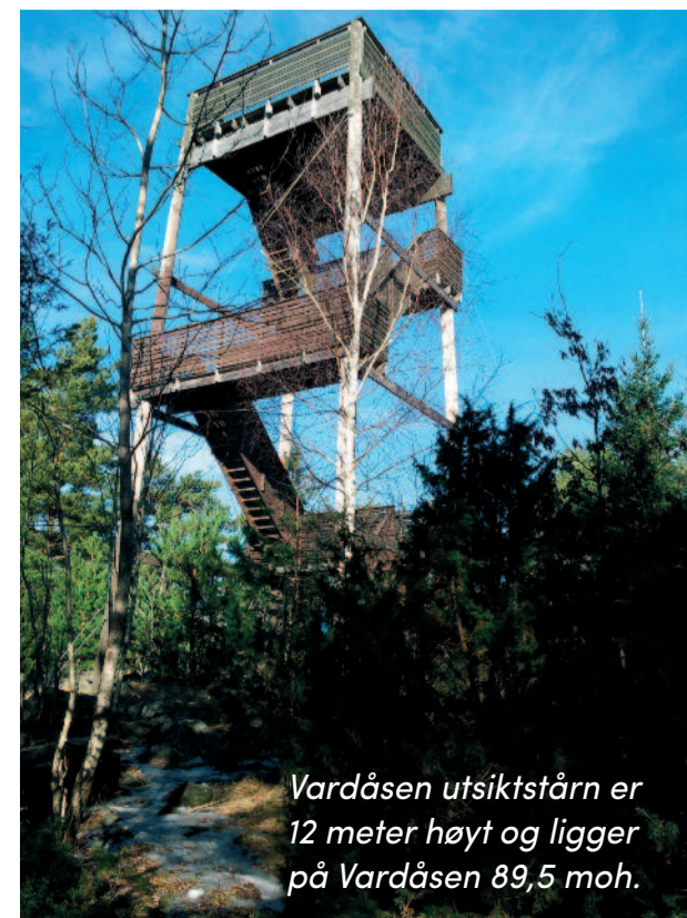
Vardåsen utsiktstårn er 12 meter høyt og ligger på Vardåsen 89,5 moh.