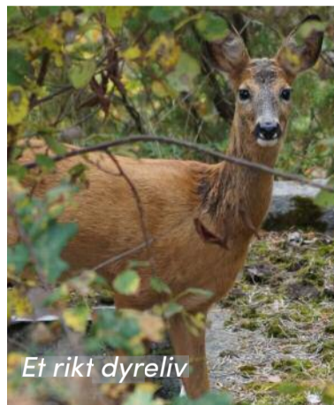
Et rikt dyreliv