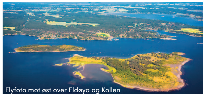
Flyfoto mot øst over Eldøya og Kollen

Teibern. Arbeidernes Båttforening i Moss har her camping for sine medlemmer. Fin vandretur mot vest til nedlagt kvartsgrove og tyske løpeganger fra annen verdenskrig.