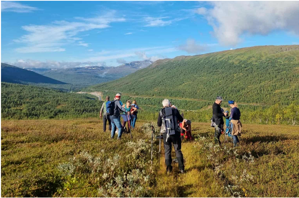
Historisk vandretur til Nasa sølvgruber.

Et variert turprogram gjennom året gjorde at deltakere kunne velge å delta på blant annet: