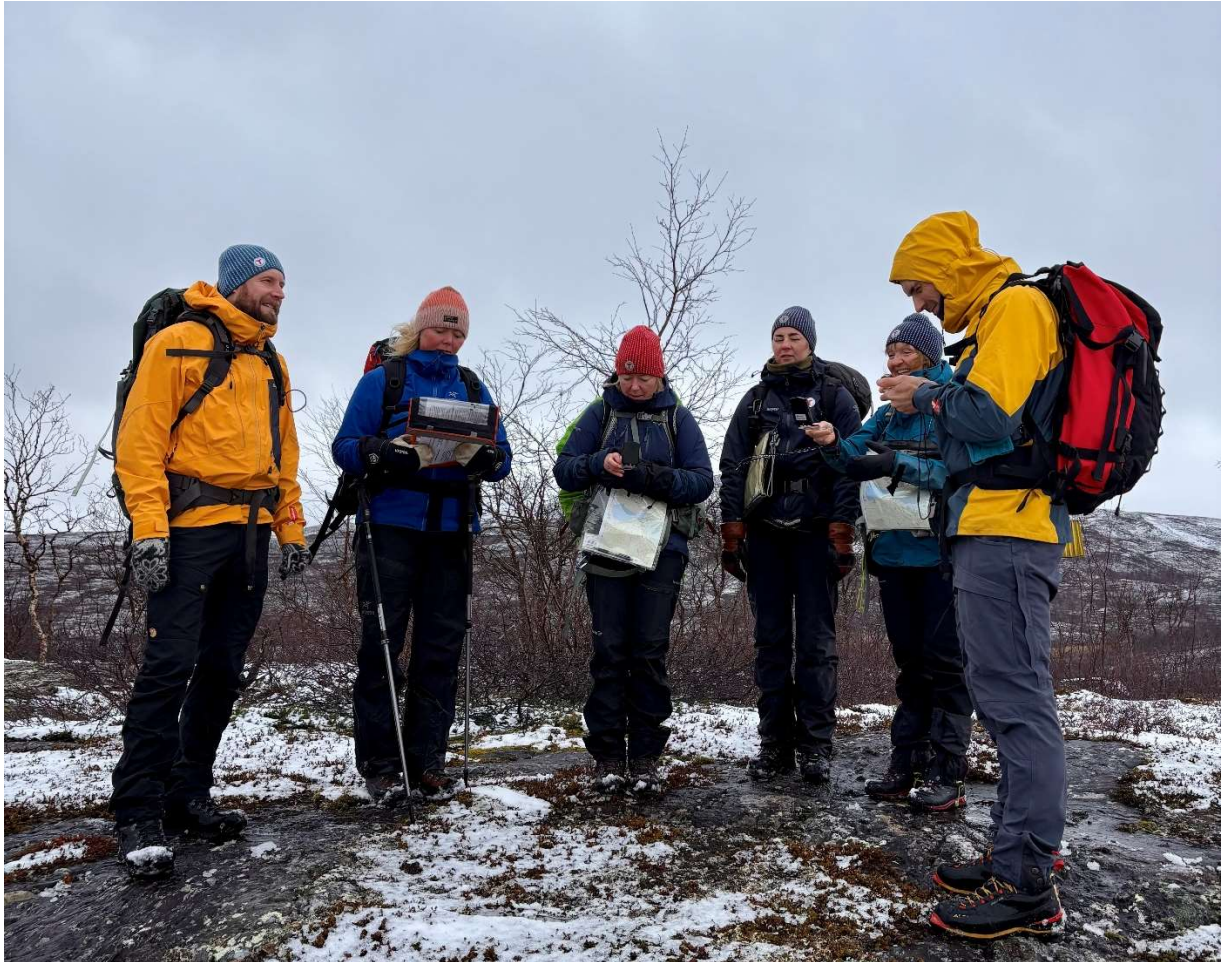
Kursdeltakere studerer kartet og sjekker om de har satt riktig kurs.

I oktober arrangerte vi sammen med DNT sentralt et kurslederkurs del 1 med base på Virvasshytta. Helga åpnet med snø, men ga oss likevel fine forhold for gjennomføring av kurs, og selve hytta og området rundt fikk de beste skussmål som arena for slike kurs. I tillegg til to deltakere fra DNT Rana og omegn kom det deltakere fra både Bodø og Brønnøysund.