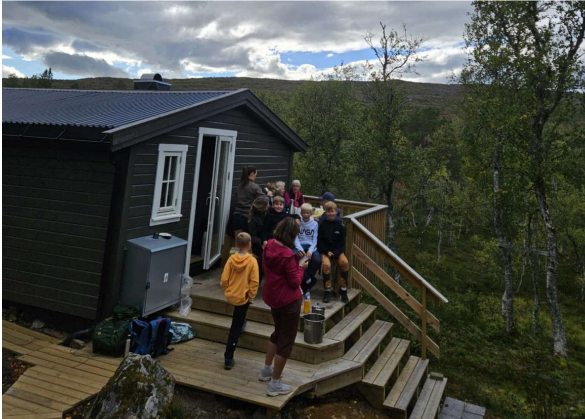
Uteservering på platten.

Etter noen år med renovering av Reinfjellhytta etter kjøp og overtakelse i 2020 er det kun små detaljer som gjenstår for at man kan flytte ut alt av verktøy. Hytta hadde derfor en gjenåpningsseremoni i september for å markere at hytta er åpen for bruk. Aud Jakobsen og Marit Dåbakk tok ansvar for arrangementet. Det var servering ute på nyplatten, og ziplinen fikk kjørt seg av alle barna som deltok.