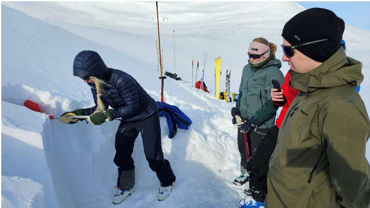
Snødekkeundersøkelse på skredkurs.

Fjellsportgruppa fikk også godkjent to kandidater som NF brefører etter fullførte praksisdager dette året. Ytterlige to kandidater skal ha sine siste praksisdager i 2026 og forventes også godkjent.