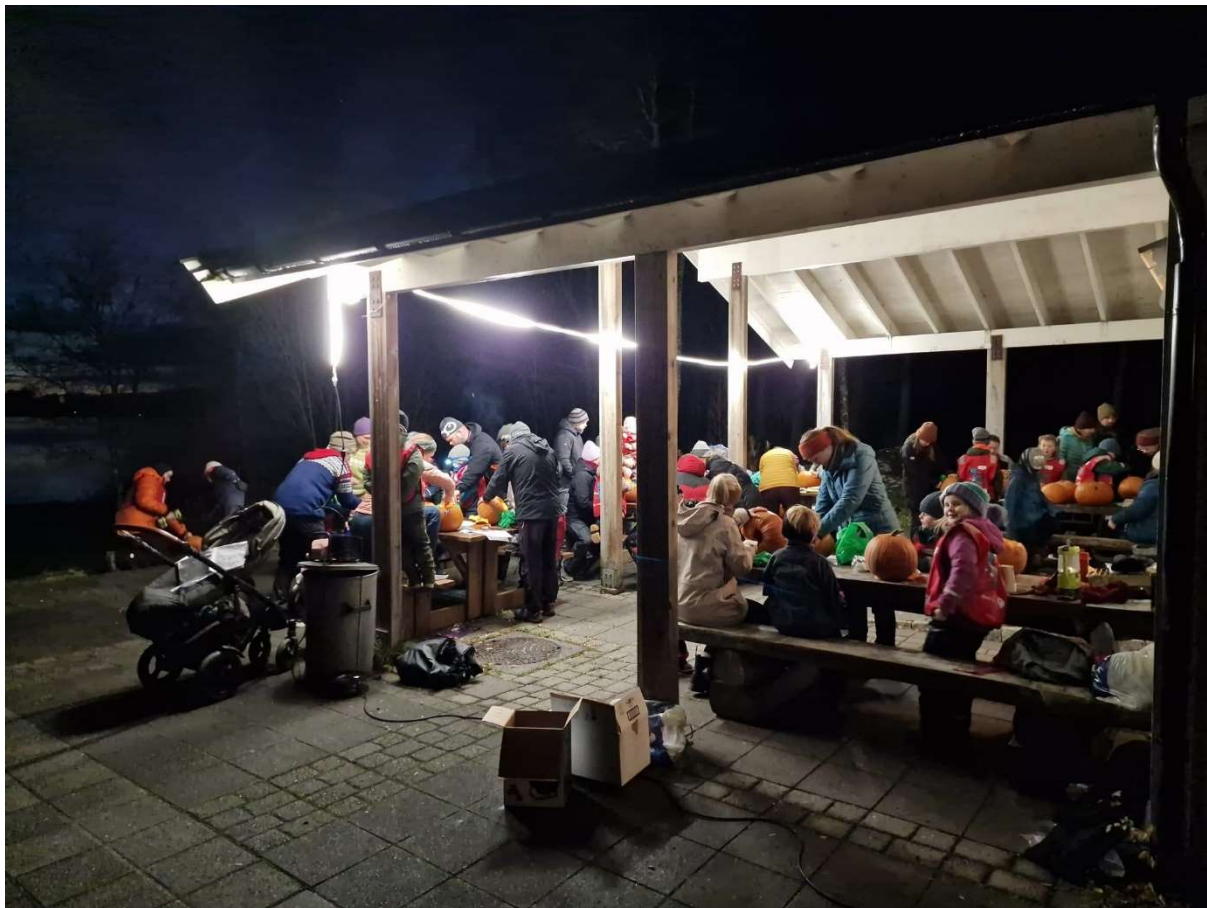
Gresskar-lykter lages i forkant av Halloween.