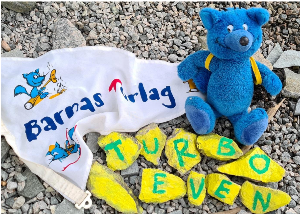
TURBOREVEN OG REBUSEN PÅ STOREHESTEN OPP