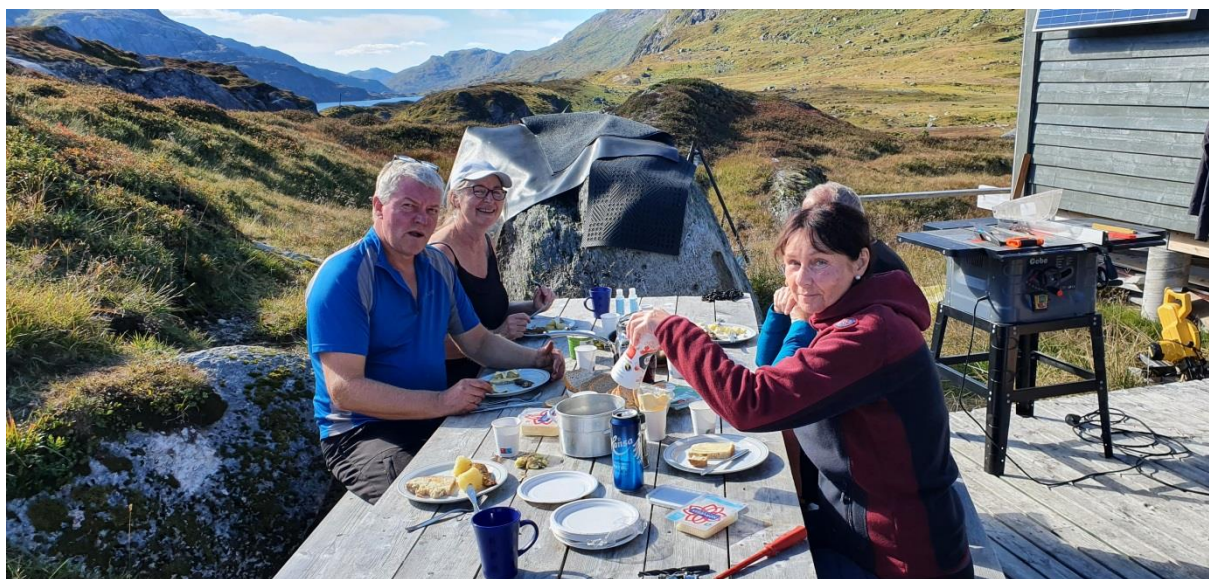
FRÅ DUGNAD PÅ LONGEVASSHYTTA, SEPT 22.

Føreståande og vurderte behov/tiltak: Beising av hytta og dei andre bygningane. Skifte dei små vidua på vaskerom og toalett. Skifte ytterdør. Alle nødvendige materialer og utstyr til dette er lagra på hytta.