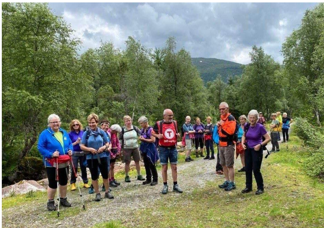
TYS DAGSTUR TIL FUREBØSTØYLEN, AUG 22

Seniorgruppa ser fram til mange fine turar i 2023 og framleis god deltaking!