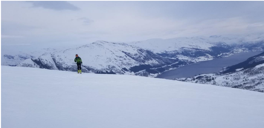
BILETER FRÅ DAGSKURS SKRED I MARS, SYKKELLØPET I JUNI OG BARNAS TURLAG FØRDE PÅ FØRDE OPP, 2022