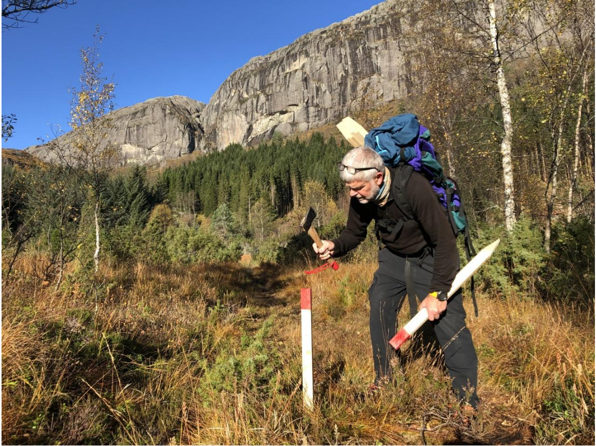
MERKENEMNDA I GODT DRIV, OKTOBER 2022