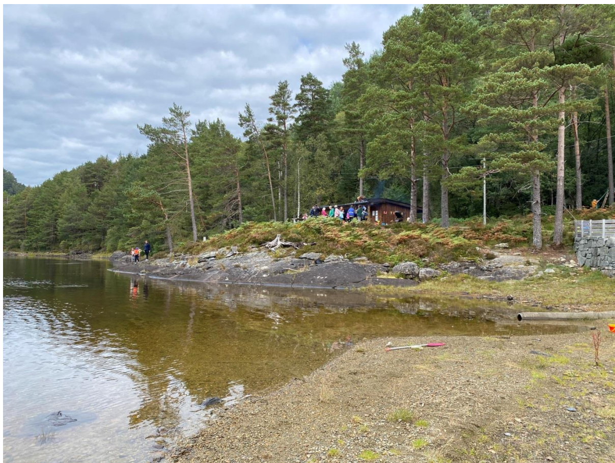
FRÅ KDU 2022

Totalt 5 turar med om lag 250 deltakarar. Stemninga er framleis god i gruppa, og vi ser fram til 2023.