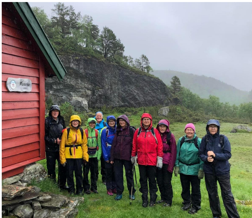
TYS DAGSTUR TIL MASSBU