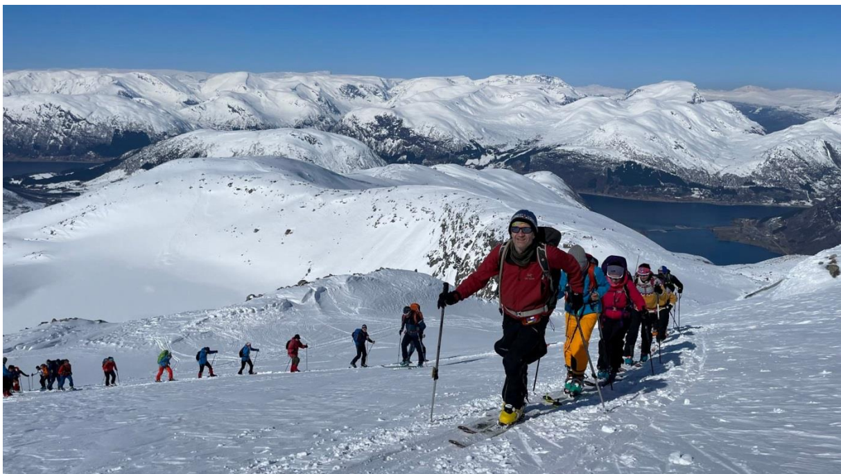
FJELLSPORTTUR TIL GROVABREEN, PÅSKEN 2022. NYDELEG VÆR OG FORHOLD.