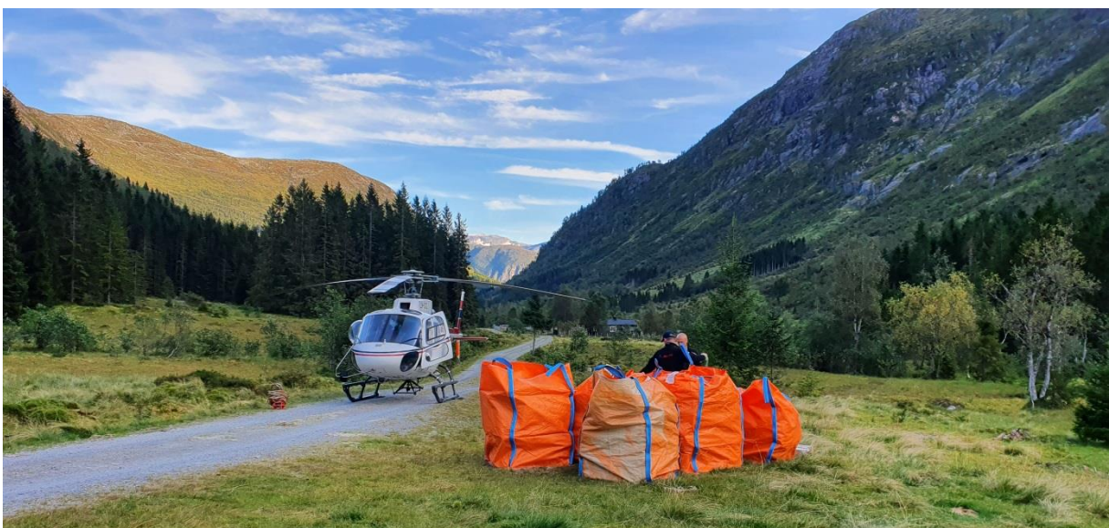
OVER: NIPEBU TIDLIG I HAUST. UNDER: HELIKOPTERLØFT TIL LONGEVASSHYTTA, 2022.