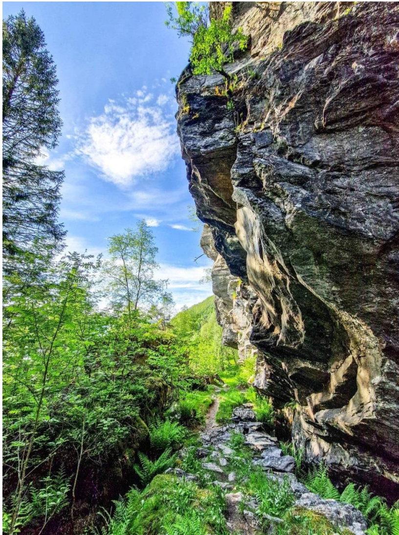
VINNERBILETET FRÅ INSTAGRAM, 2022

Den yngste deltakaren har vore 2 år, og den eldste deltakaren er 81 år. Snittalder er 49 år.