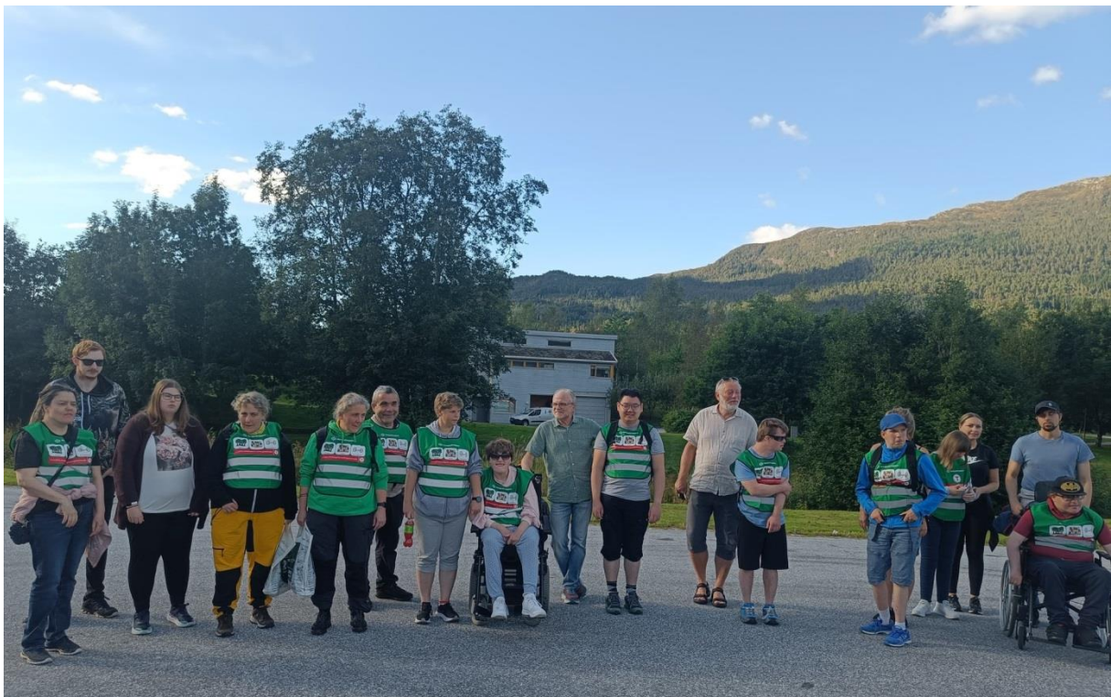
FTU SITT FYRSTE ARRANGEMENT I HAFSTADPARKEN, SEPT 22, MED OVER 30 DELTAKARAR

Det er planlagt eit nytt arrangement torsdag 1.des frå kl 17.30-19.00 på Mo, Jul i stallgata.