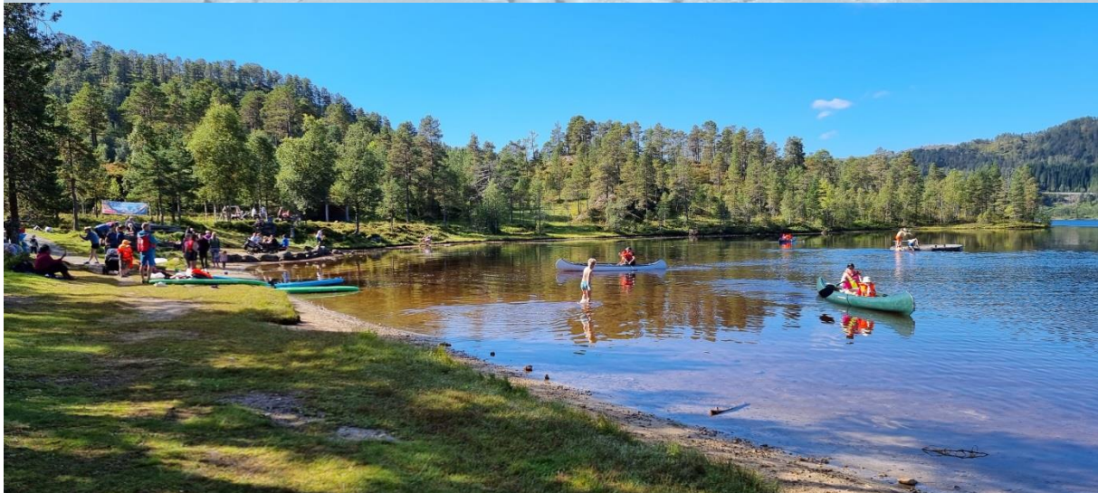
BILETER FRÅ SKITUR OG KDU HAUST, 2022