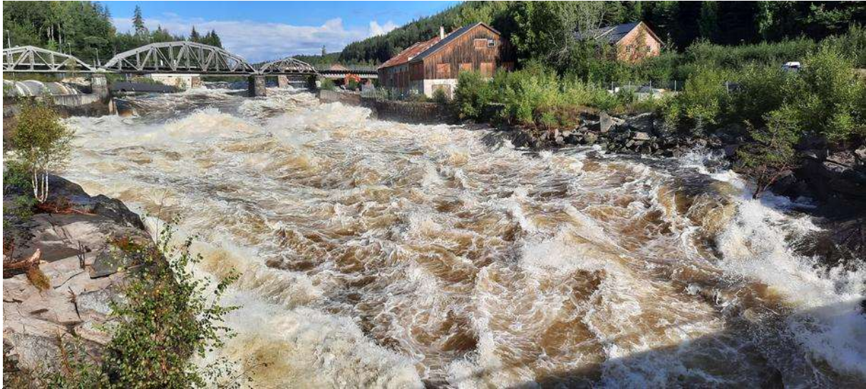
Hensfossen gikk stor. Her snudde Begna-/Ådalsbussen.