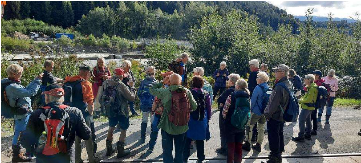
Historikk om Randsfjord- og Sperillbanen, bl.a. om fergen Bægna. Foto: