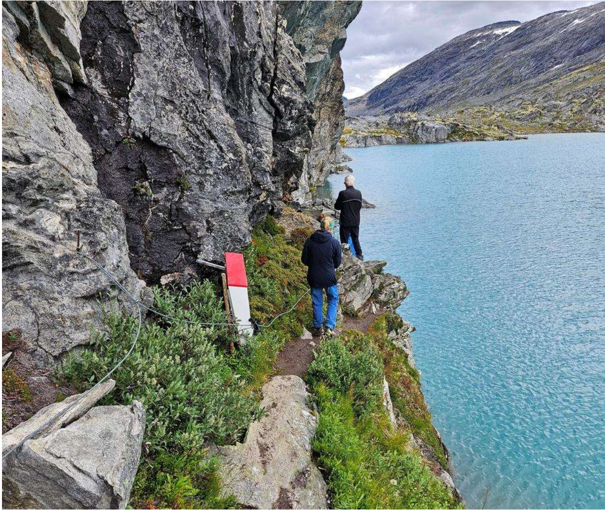
Utfordrende å komme seg til Fieldfarehytta.