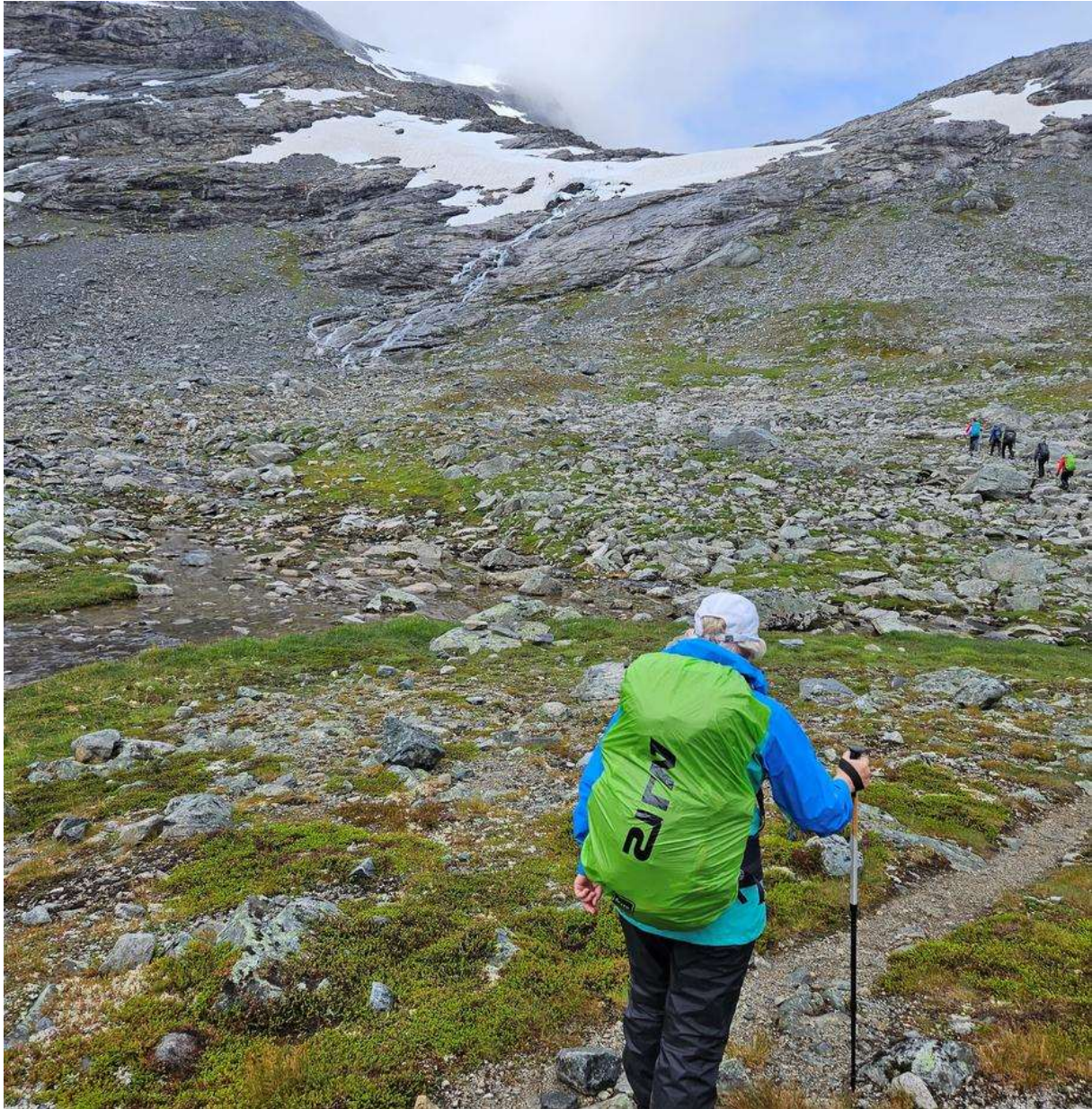
Mellom Pyttbua og Reindalseter.