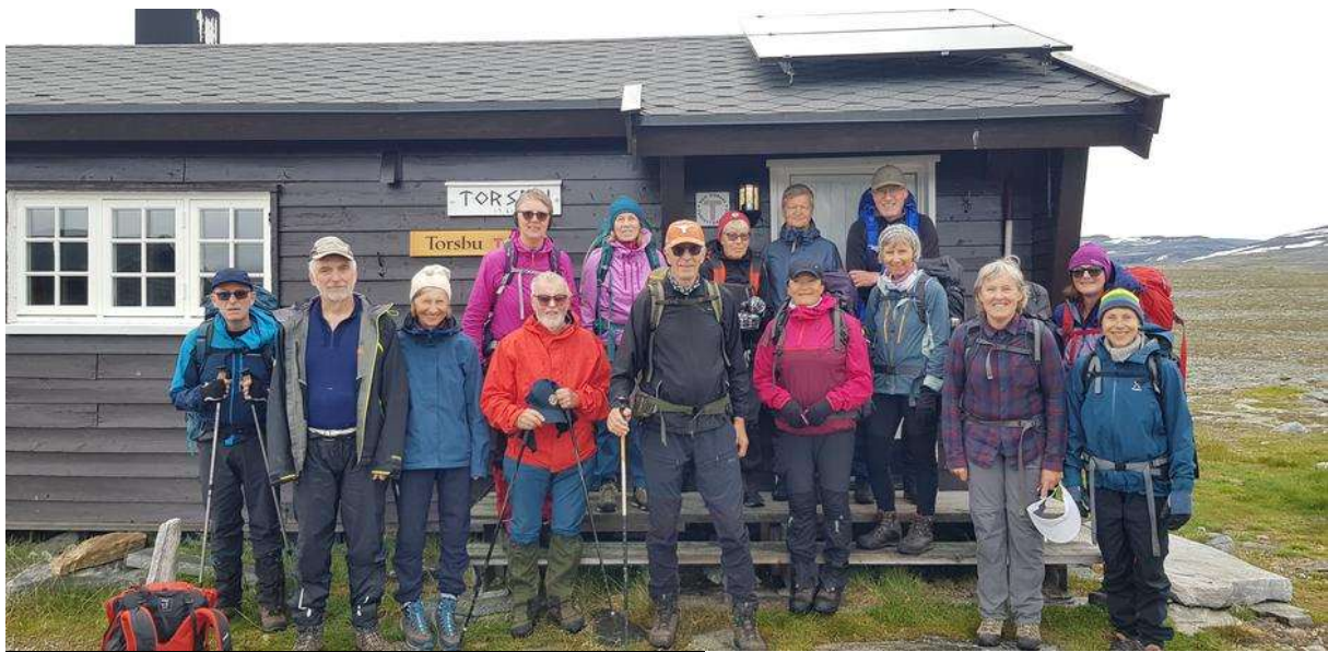
En flott gjeng utenfor Torsbu.