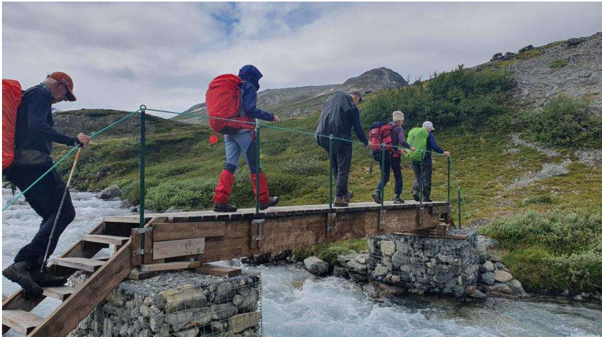
Mellom Pyttbua og Reindalseter.