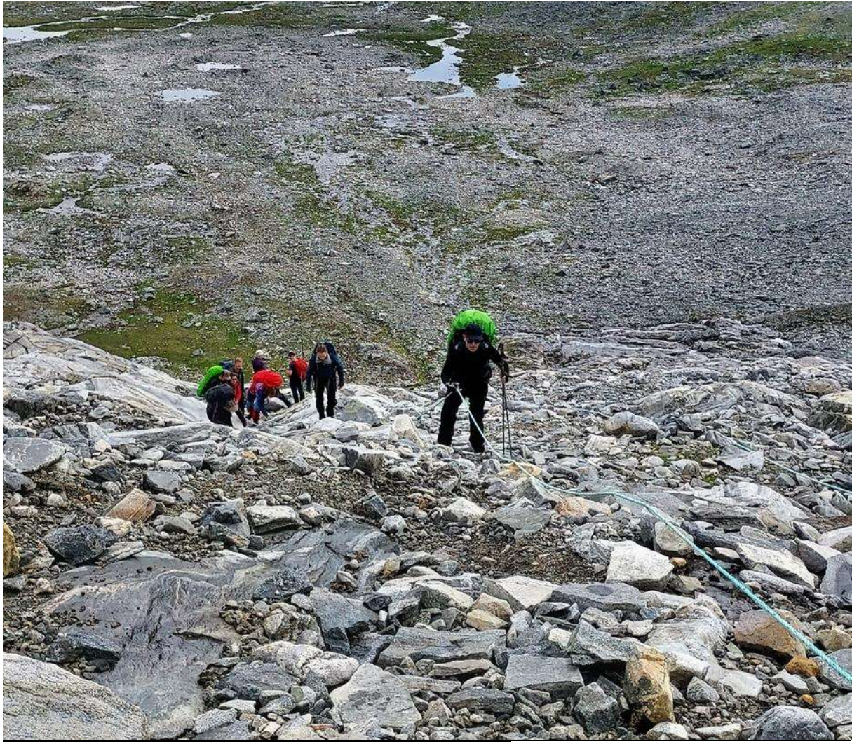
Godt å ha et tau til hjelp. Godt