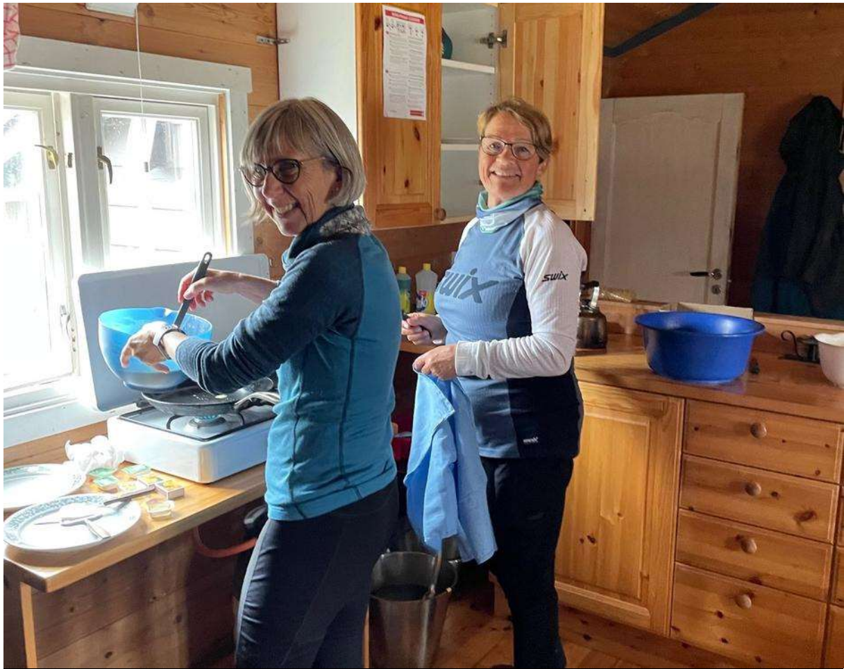
Her lages det pannekaker på Torsbu!