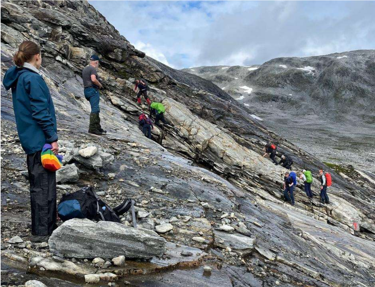
Utfordrende partier som krever godt samarbeid!