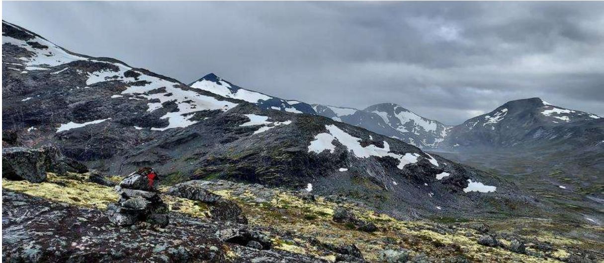
Karitinden, Høgstolen og Puttegga.