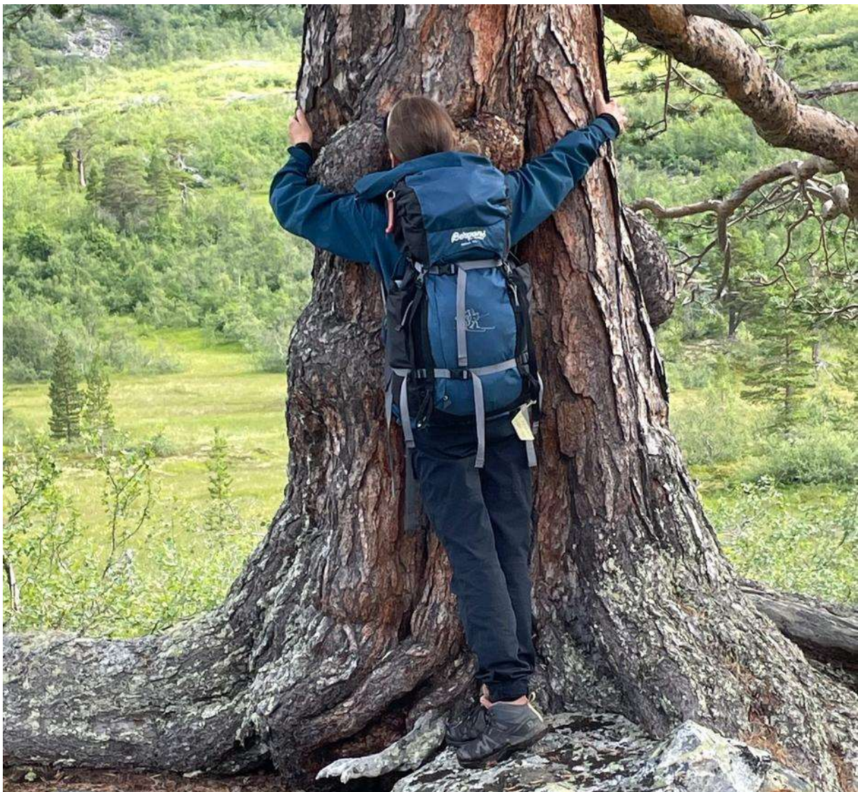
Solid furu.