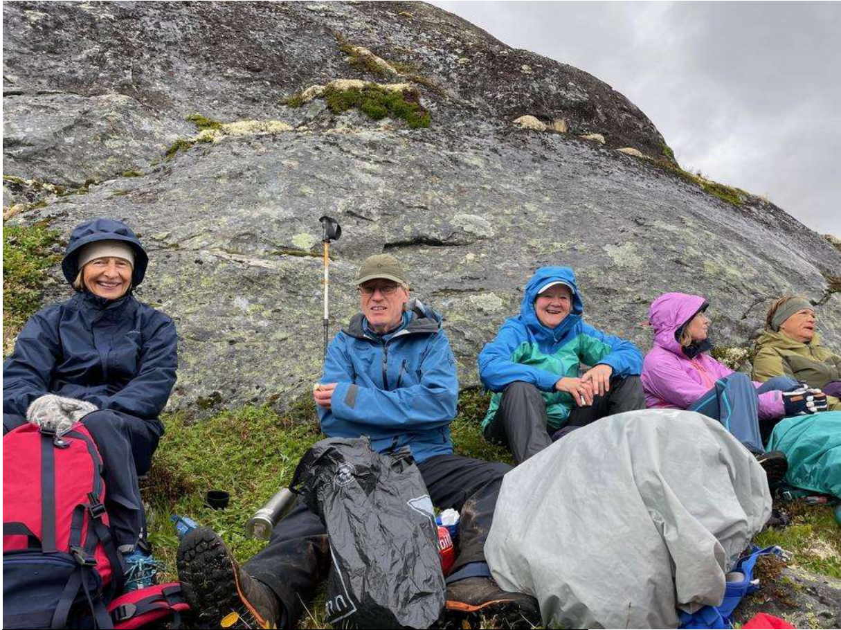
Humøret er bra selv om været ikke er det beste.