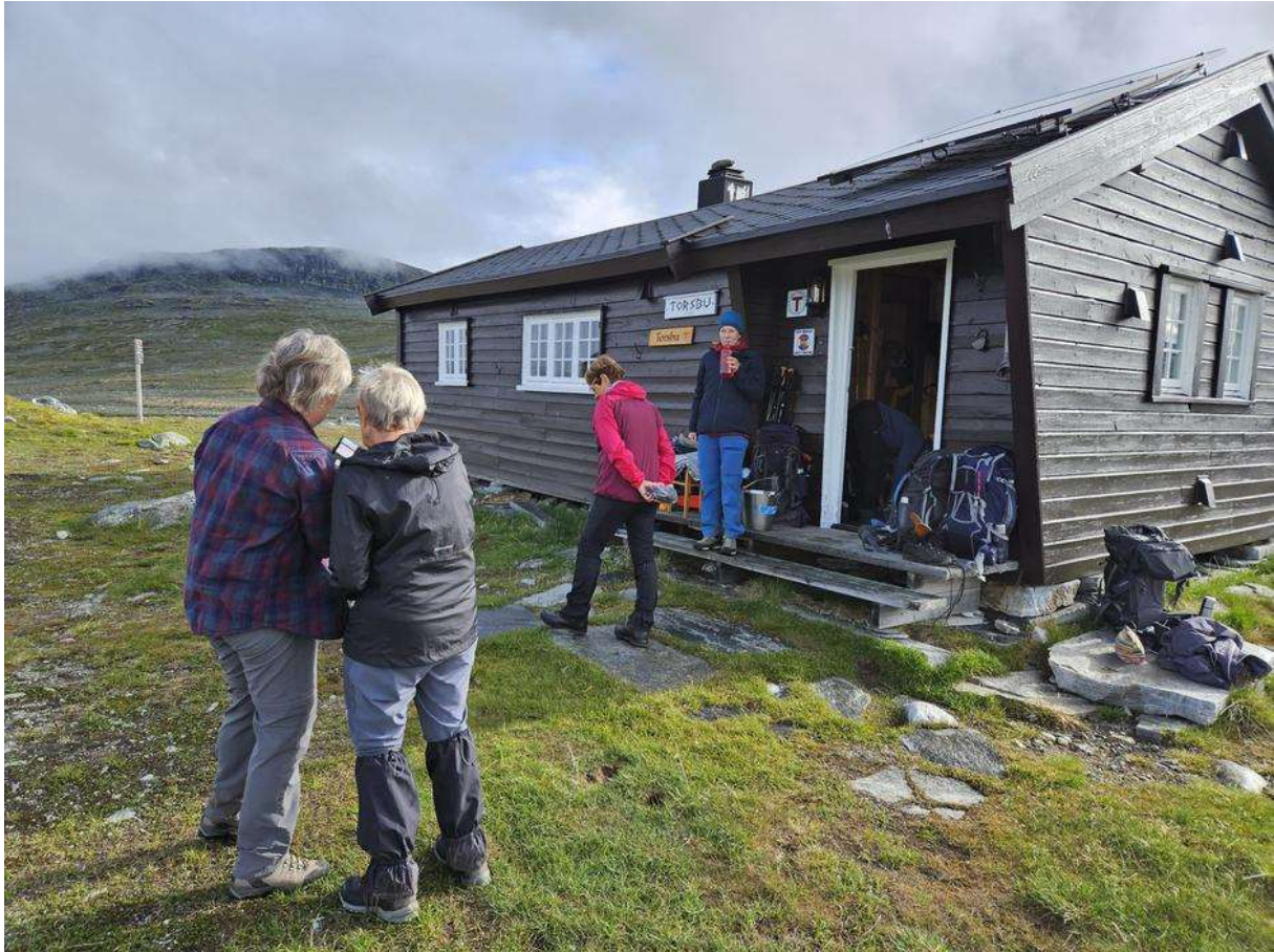
Kartet studeres ved Torsbu.