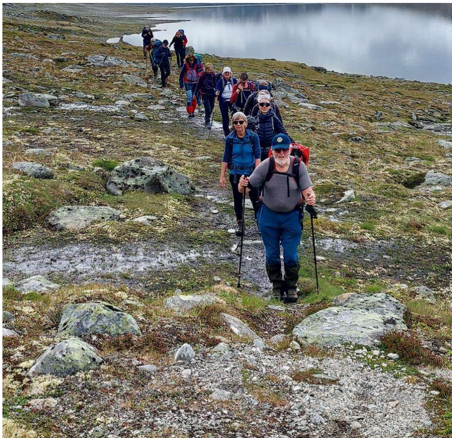
Fra Torsbu mot Pyttbua.