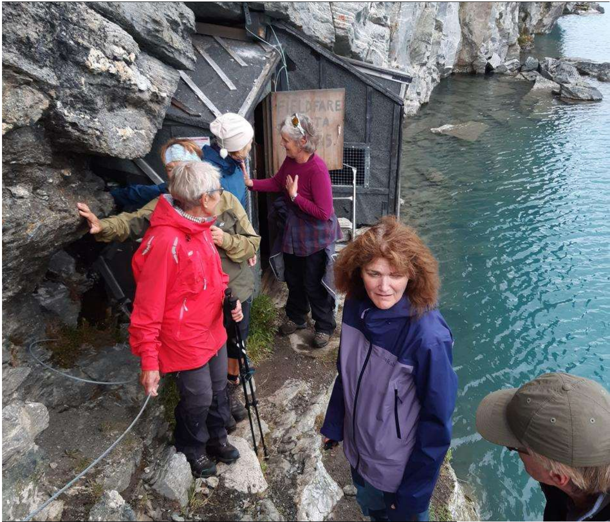
SpennSpennende å besøke Fieldfarehytta. Foto: Per H. Stubbraatenende