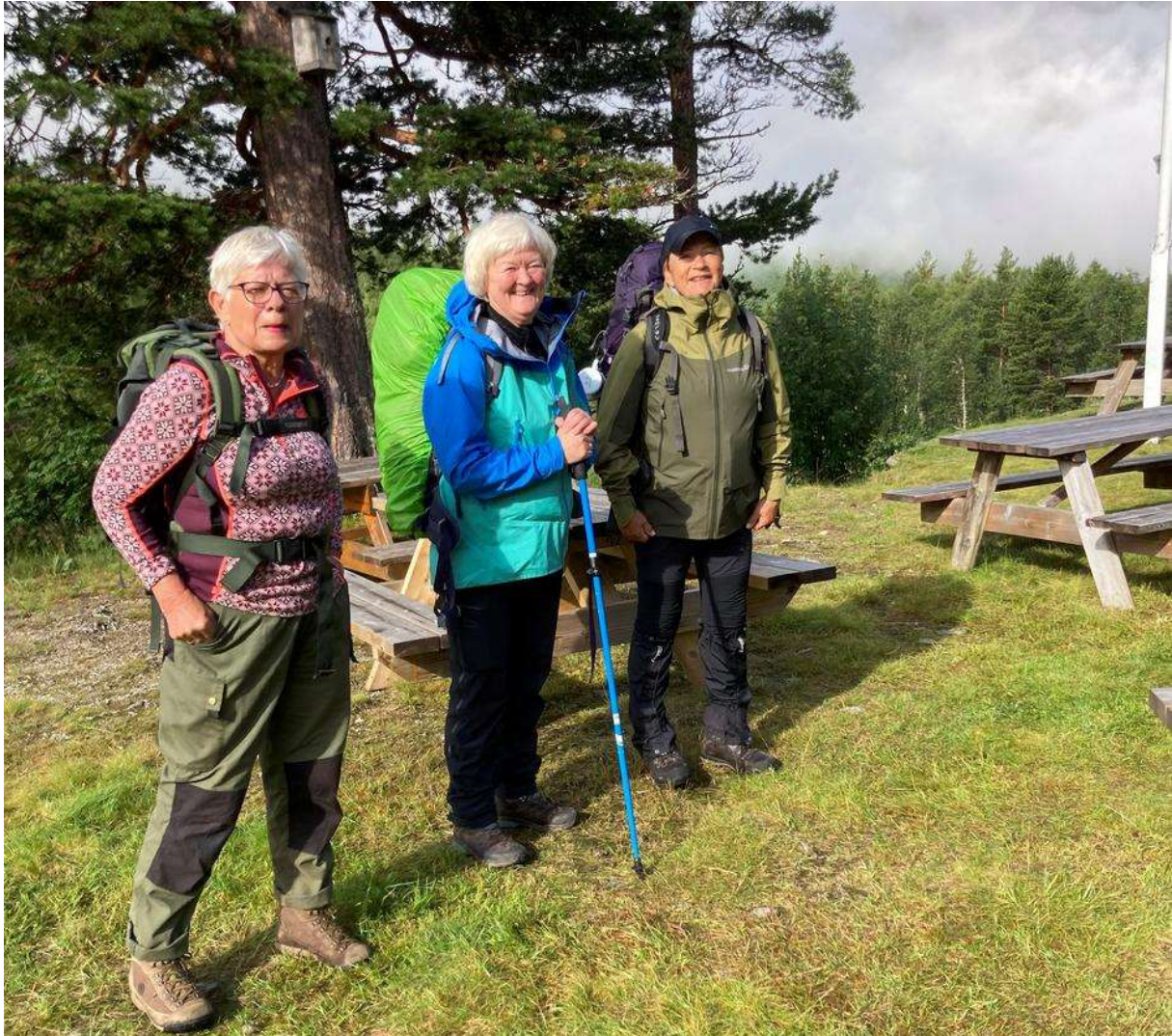
Klar for siste etappe, ut til bilene.