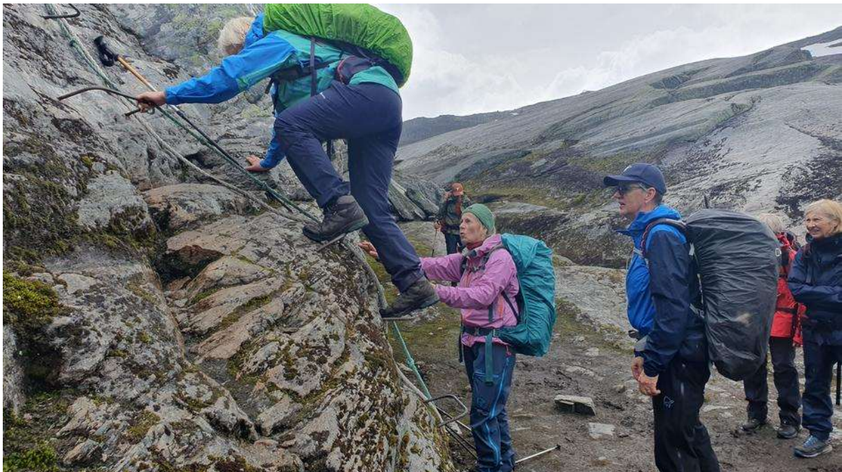
God bistand på et vanskelig parti.