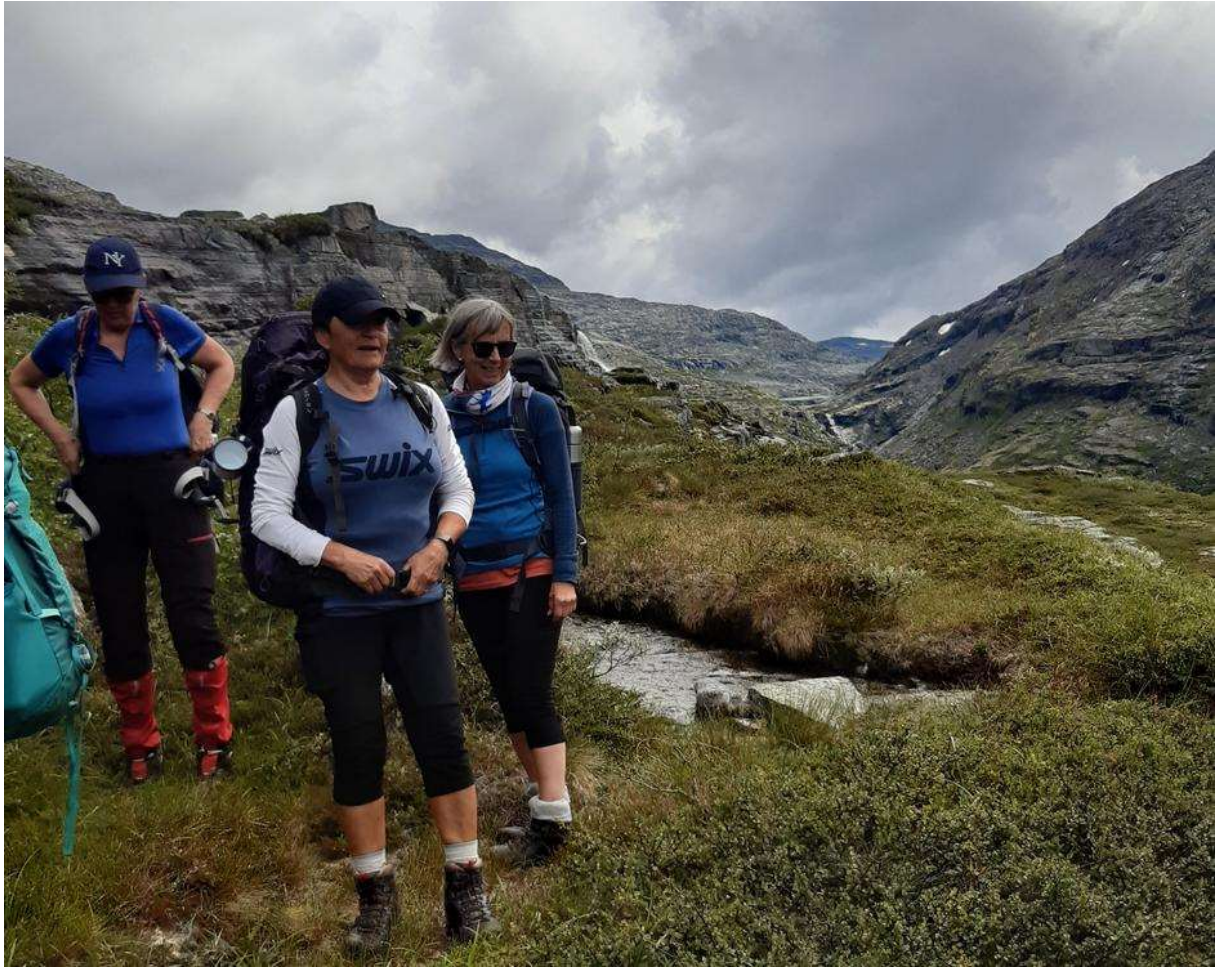
Mellom Reindalseter og Veltdalshytta.