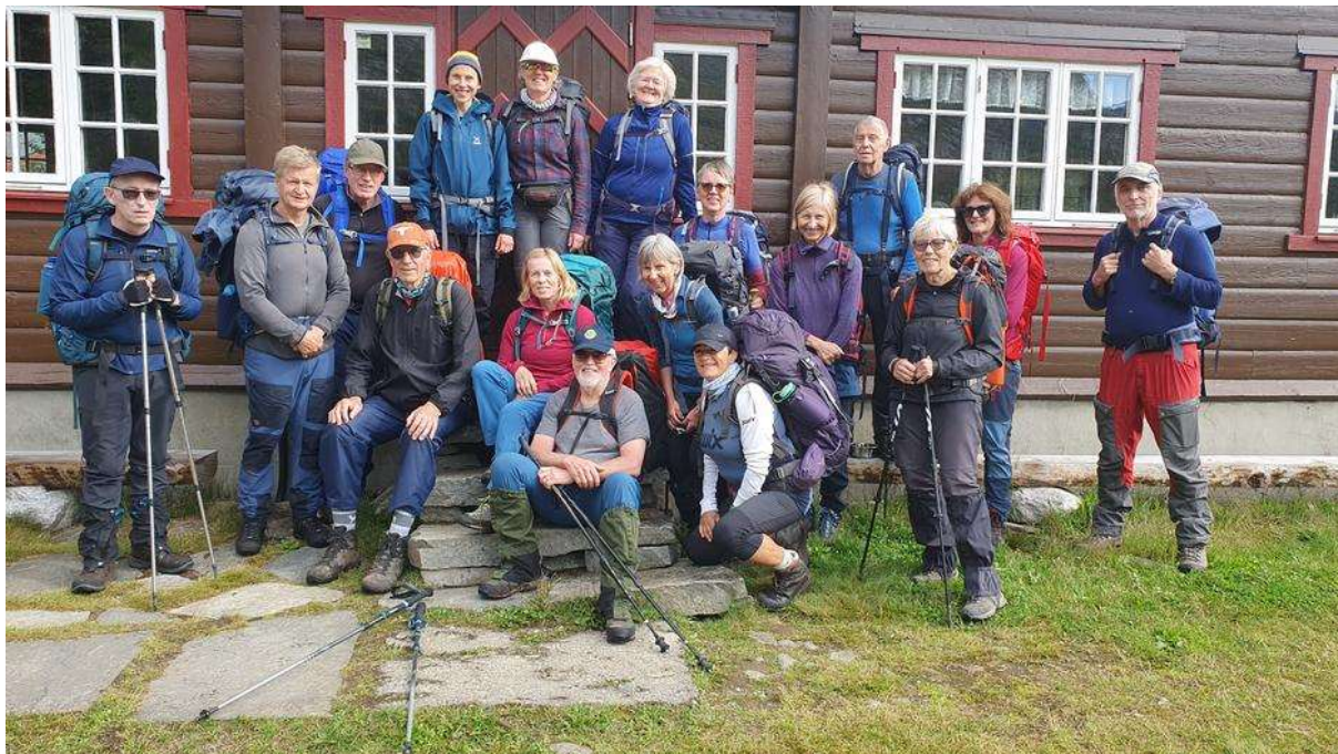
Hele gruppa ved starten på Reindalseter.