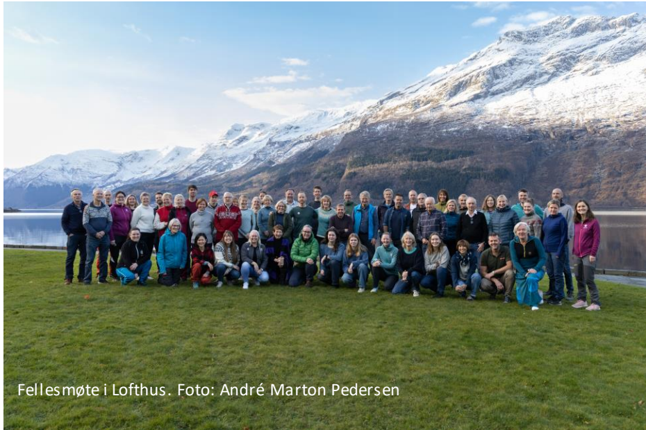
Fellesmøte i Lofthus.