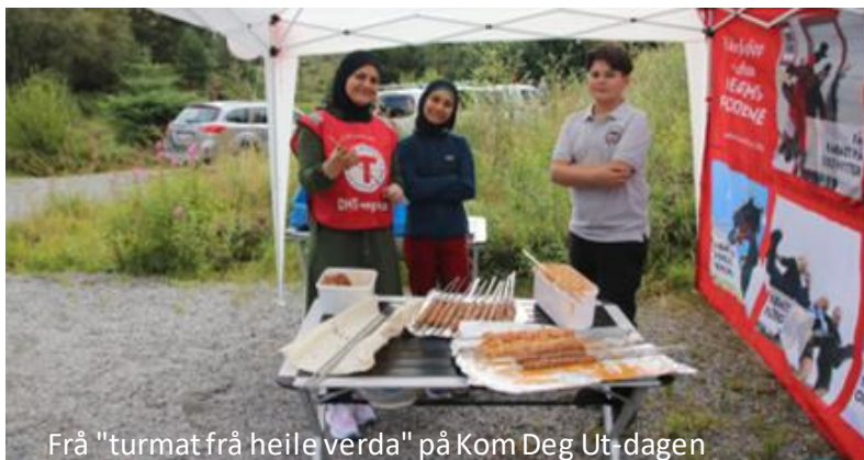
Frå "turmat frå heile verda" på Kom Deg Ut-dagen