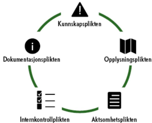
Figur: DNTs fem plikter for aktivitet