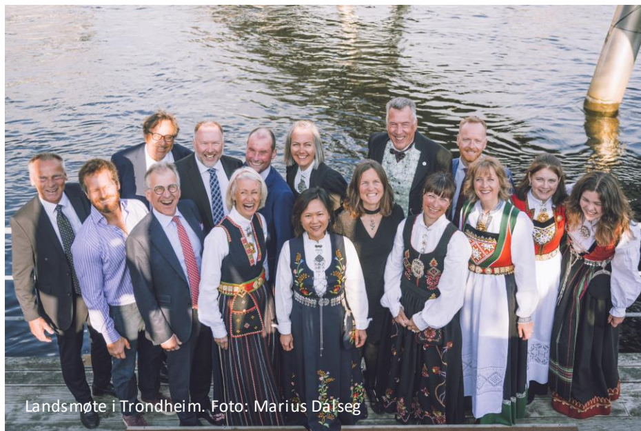
Landsmøte i Trondheim.