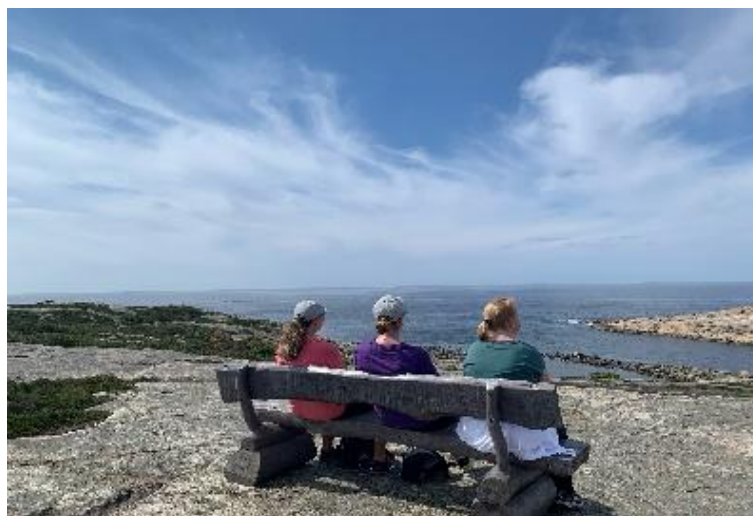
Guttormsvauen