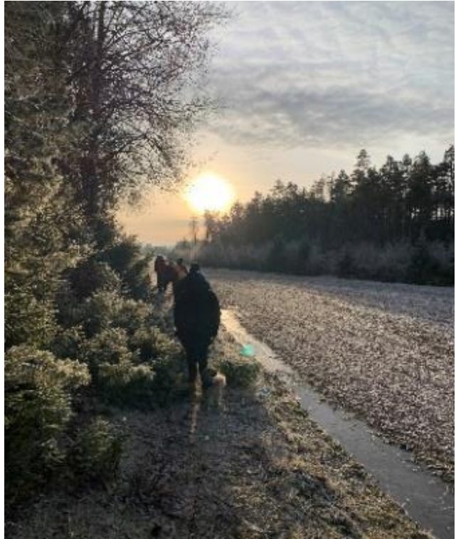
Skjeberg, juleavslutning i lav desembersol