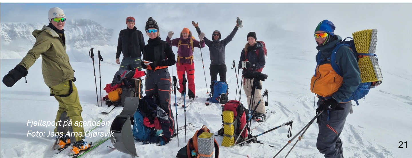
Fjellspport på agendaen

Det ble arrangert tre skredkvelder med god deltakelse i Volda, Ålesund, Sykkylven og Ulsteinvik. Totalt var 750 personer til stede på disse skredkveldene.