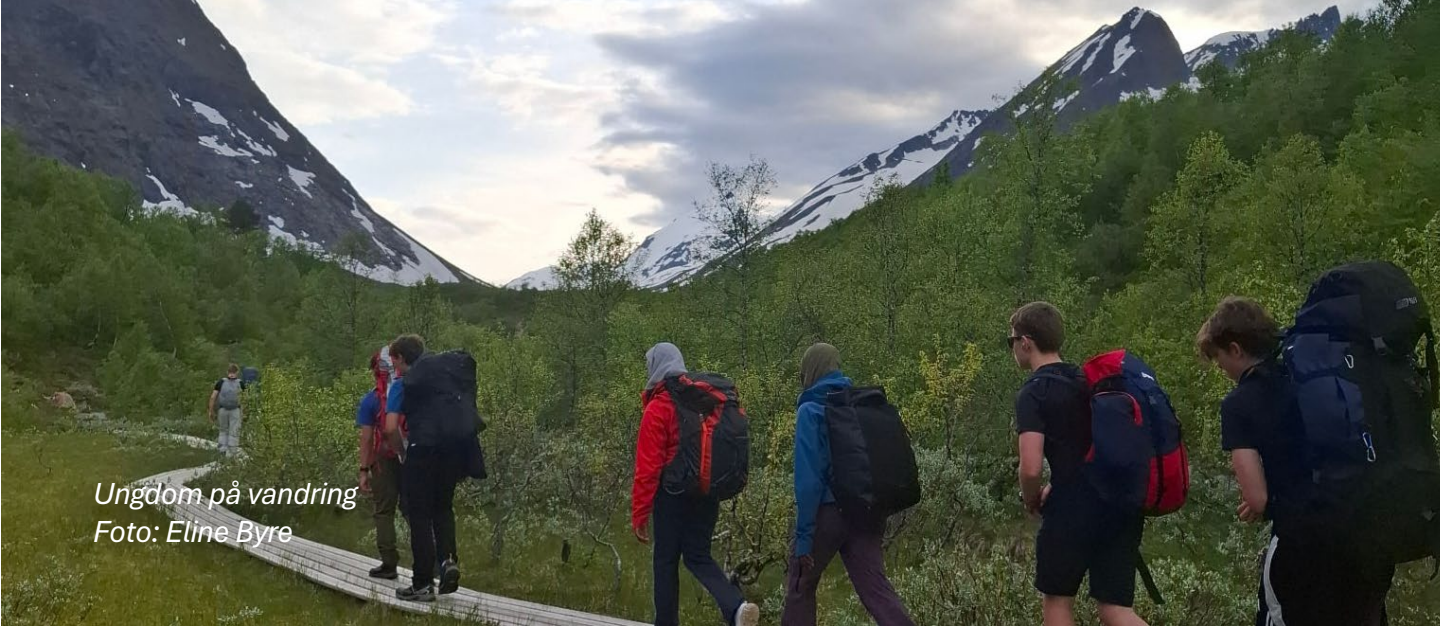
Ungdom på vandring