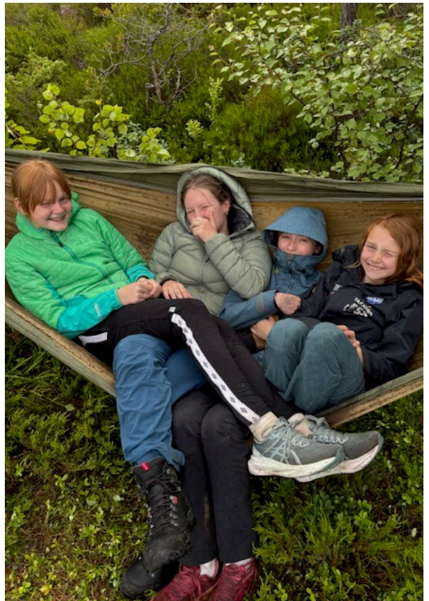
Samhold i hengekøya