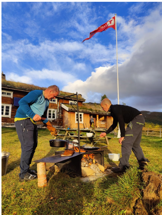
Kulinarisk på Vakkerstøylen