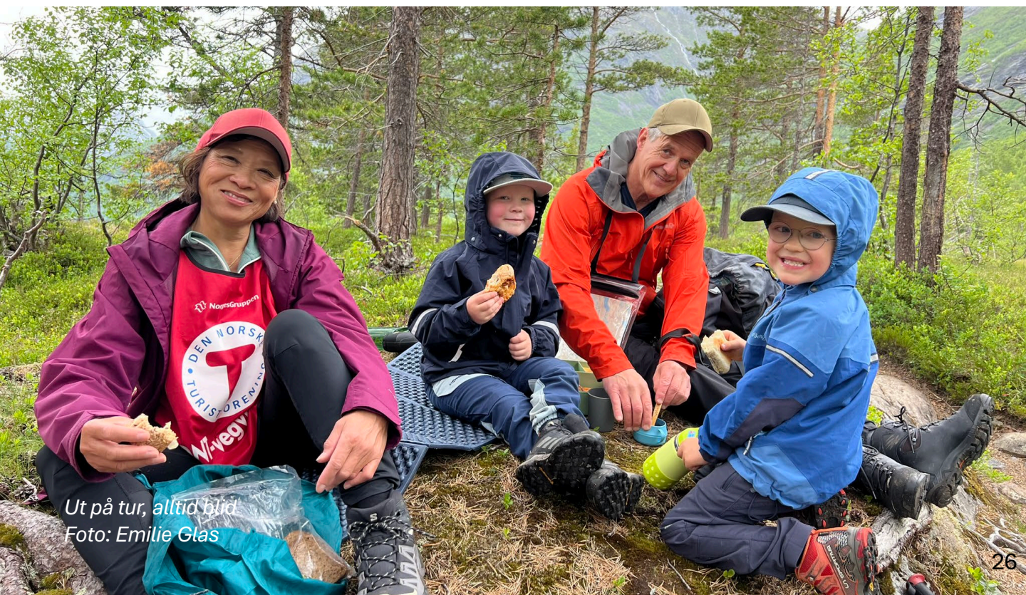
Ut på tur, alltid blid

I 2025 som i –24 inviterte vi DNTs samarbeidspartner Atea, avdeling Ålesund, til dugnad for å fjerne resten av en gammel telefonkabel i stien til Reindalseter, med overnatting på Reindalseter og tilhørende middag. Det ble en fin dag med arbeidslystne deltagere og det meste er nå fjernet.