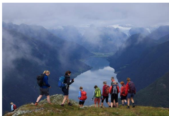
Tur til Romhesten.