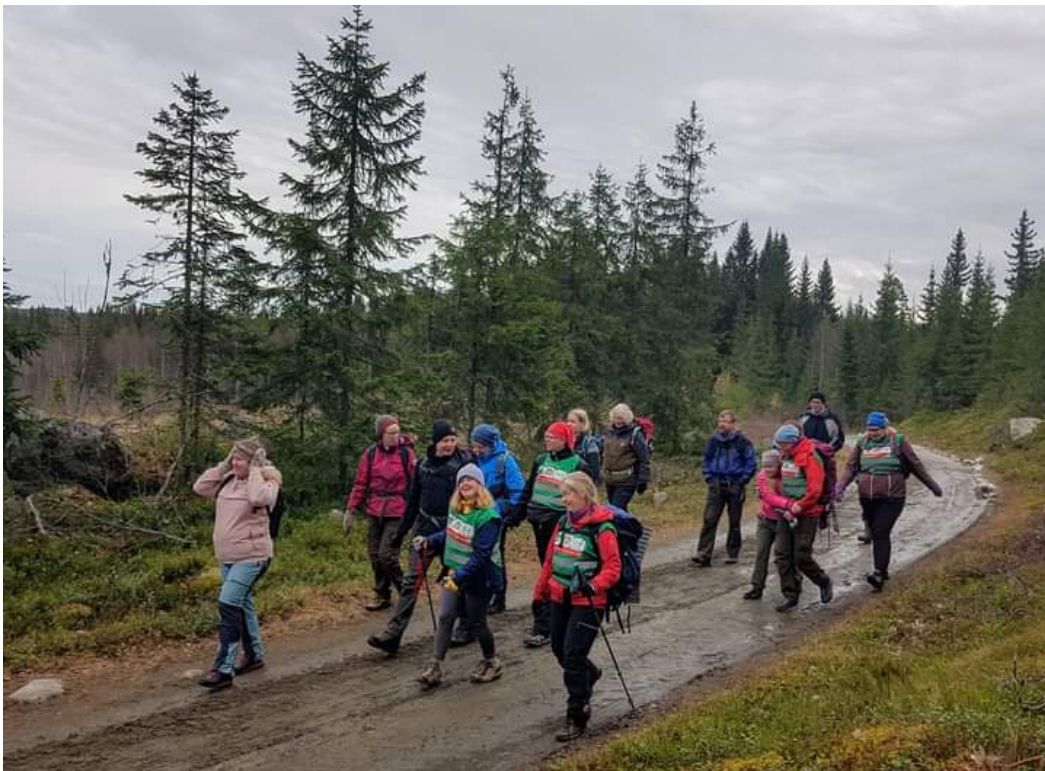
Tur med DNT tilrettelagt

Vi samarbeider bl.a. med ansatte i kommunene vi har medlemmer i, for å spre informasjon og få til attraktive tilbud, og Norsk forening for utviklingshemmede (NFU).