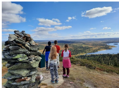
På toppen med utsikt over Våsjøen

I september skulle vi arrangere Kom deg ut-dagen igjen, og etter et labert turår så langt, var vi usikre på hvor mange vi kunne forvente. Vi fikk denne gang til et samarbeid med Barnas Røde Kors og Øyer fjellstyre, slik at flere kunne dra lasset sammen. Det ble nok en gang et flott høstarrangement, hvor vi registrerte hele 67 personer på «smittelista». Det ble servert pølser, kaffe og saft, arrangert topptur med uttrekkspremier og natursti med deltakerpremie til barna. Fjellstyret hadde ei minkfelle som noen ble med og sjekket (med fangst), noen prøvde fiskelykken fra land og fra fjellstyrets åpne båt, mens andre fanget småfrosker og noen spikket. Kom deg ut-dagen er tydeligvis et arrangement som trekker barnefamilier ut, i hvert fall så lenge været er noenlunde 😊