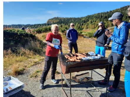
Pølsegrelling med blide folk

Kom deg ut-dag, mistet vi i styret litt gnisten til å arrangere aktiviteter og turer på høsten, da oppmøtet hadde vært dårlig hele året. På