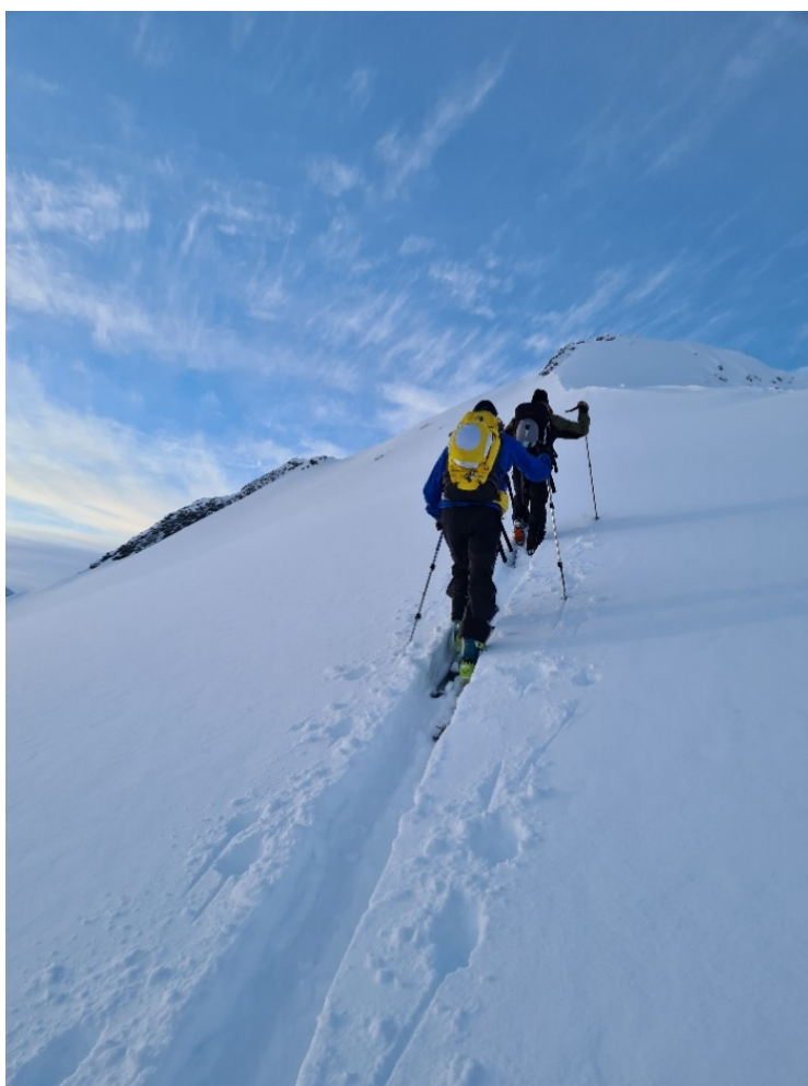
På veg opp til Blåtindane i Måndalen.

Vi hadde ingen turer i 2021, men har bidratt med utstyr til Barnas Turlag sine aktiviteter på Krokbua og med turplanlegging med DNT ung.