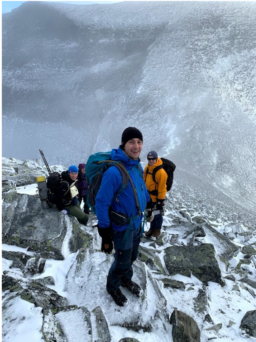
En fornøyd turdeltaker på vei opp snødekte Rondeslottet.