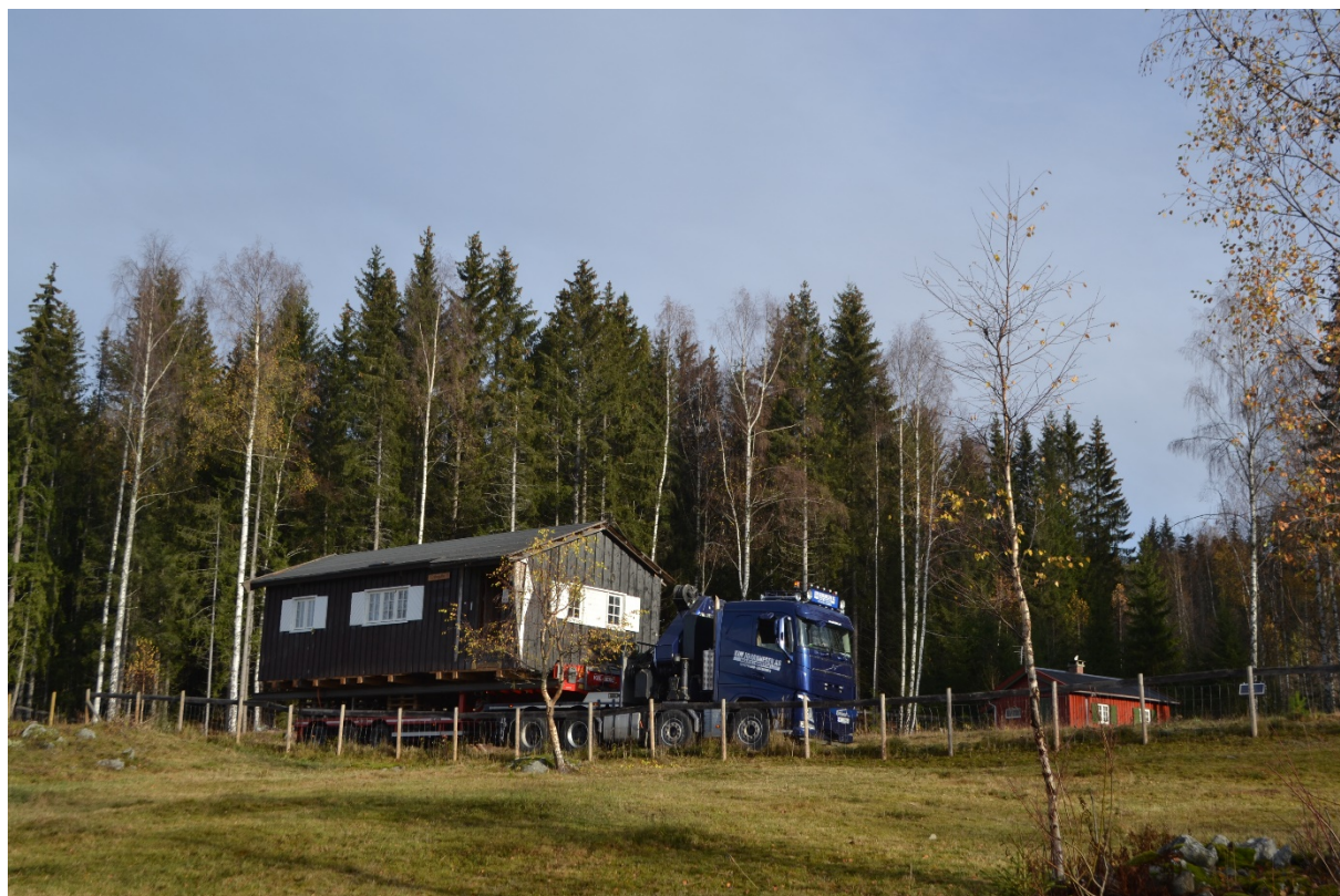
Gråhøgdbua under transport på Maihaugens seteranlegg.

Gråhøgdbua: Gråhøgdbua ble transportert fra Venabygdsfjellet i mars og lagret midlertidig. I oktober fikk hytta sin endelige plassering i hyttegrenda på Maihaugen. Diverse arbeider gjenstår før Gråhøgdbua kan tas i bruk/vises fram sommeren 2022.