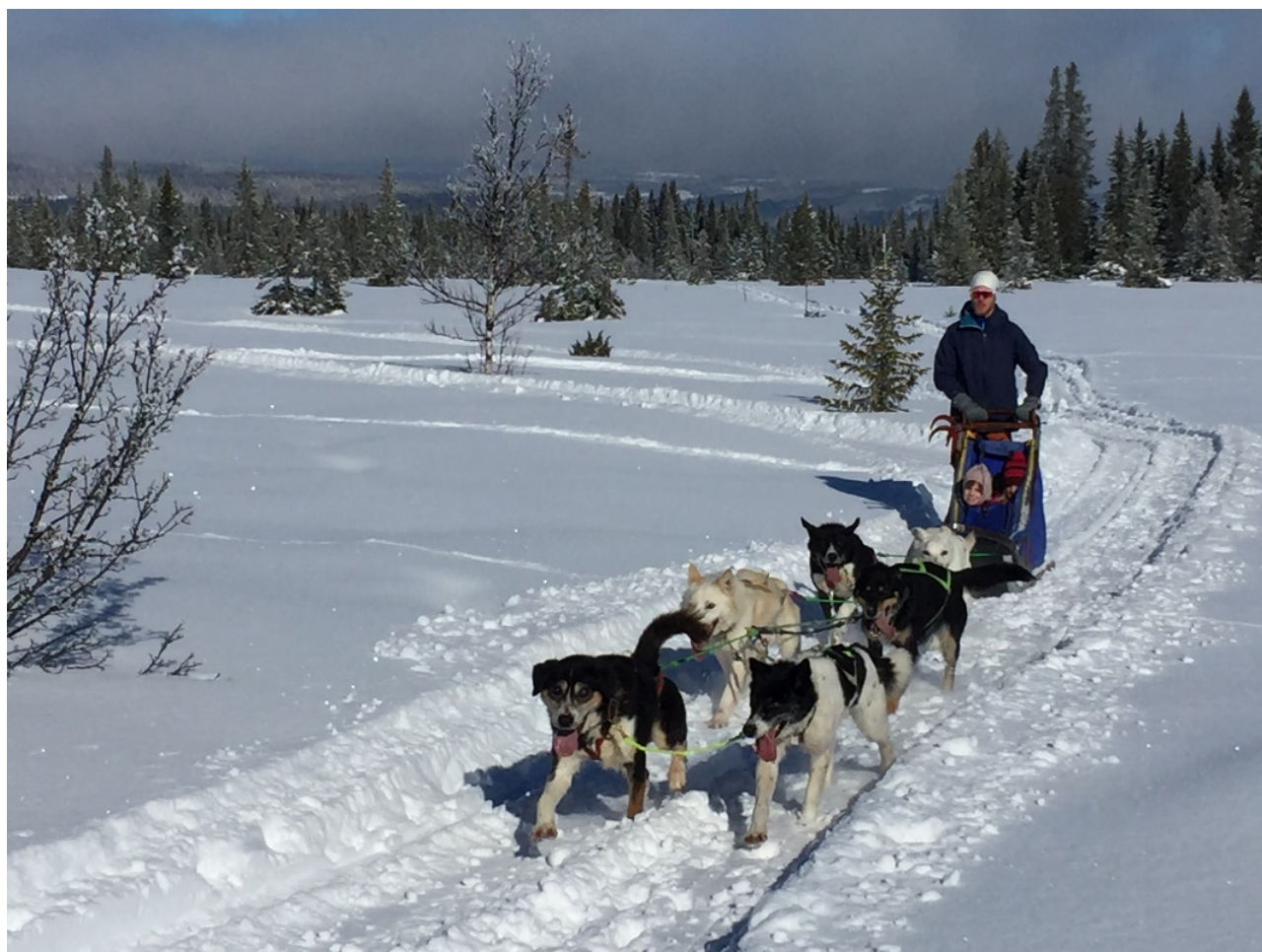
Hundekjøring ved Astridbekken i mars.

Det har vært vanskelig å engasjere nye aktivitetsledere i Gausdal og ingen av styremedlemmene fortsetter. Gausdal-gruppa legges derfor midlertidig ned, fram til det kommer nye krefter som vil overta.