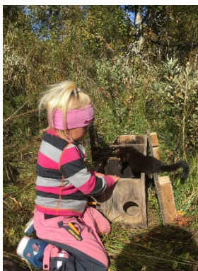
Mink i fella til fjellstyret