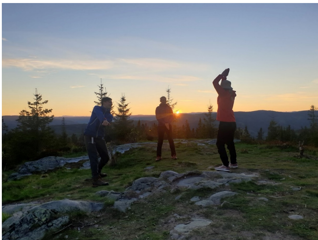
Lek og moro i solnedgang på Balbergkampen, fra en Lillymandag.

Vi er også stolte av å ha gjennomført 21 Lillymandager sammen med friluftsgruppa på Høgskolen i Innlandet. Disse mandagene har bestått av blant annet turer på beina med ulik aktivitet: langrenn, aking, kano, hengekøye, både i dagslys og i mørket med hodelykt. Gjennomsnittlig deltakere har vært 10 stykker. Lillymandagene har fungert som et friskt avbrekk på en ellers blå mandag. Vi er heldige som har engasjerende frivillige som stiller opp og har brukt hele 54 timer totalt på disse mandagene. Etter sommerferien gjennomførte vi "sosial happening" som først og fremst besto av årsmøte, men det ble også brukt som et viktig ledd for å fremme DNT Ung Lillehammer og hva vi har å tilby for fremtidige medlemmer som er nye i byen. Dette var et opplysende møte for mange, og det var hele 60 engasjerende unge som møtte opp.