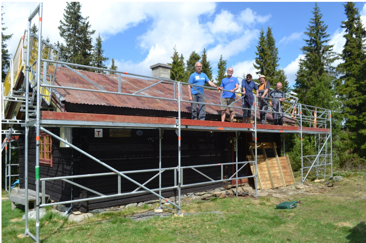
Blid dugnadsgjeng før bølgeblikket ble fjerna og det gamle torvtaket kom til syne.

Etter at årsmøtet vedtok kjøp og utvikling av Kittilbu, utløste dette 985 timer dugnadsarbeid, og nødvendige anleggsarbeider av Jøra Bygg AS med underentreprenører. Riving av svalgang, nødvendig graving og isolering av inngangsparti, og i forlengelsen av denne, ny skåle, isolering av tak, ny tekking og nye vinduer. Ny kjøkkenkrok, elektrisk ovn, nye senger, ny (for oss) Krogenæs sofagruppe og ny ovn. Utvendig er hytta beisa med 2 strøk. Det gamle uthuset er omgjort til sikringsbu med sengeplass til 2 personer og 2 hunder.