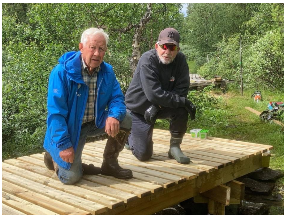
Bygging av flott, ny bru over elva Hynna, ved utløpet av Hornsjøen i juli.