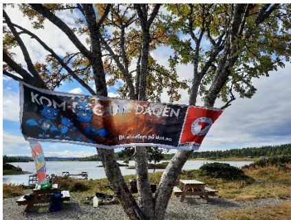
Våsjøen i fint høstvær

Vi satser på ny frisk i nytt år, og tilbyr et variert utvalg av aktiviteter. Heldigvis har vi fått med en ny turleder, men opplever at det er vanskelig å få med nye frivillige. Håper å kunne få med flere engasjerte personer utover året, slik at vi etter hvert kan tilby enda flere aktiviteter og turer.