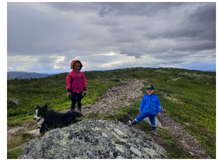
På Snauskallen for å henge opp natursti