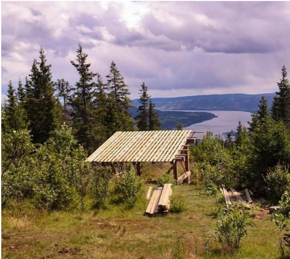
Her er gaphuken på Balbergkampen under oppføring.