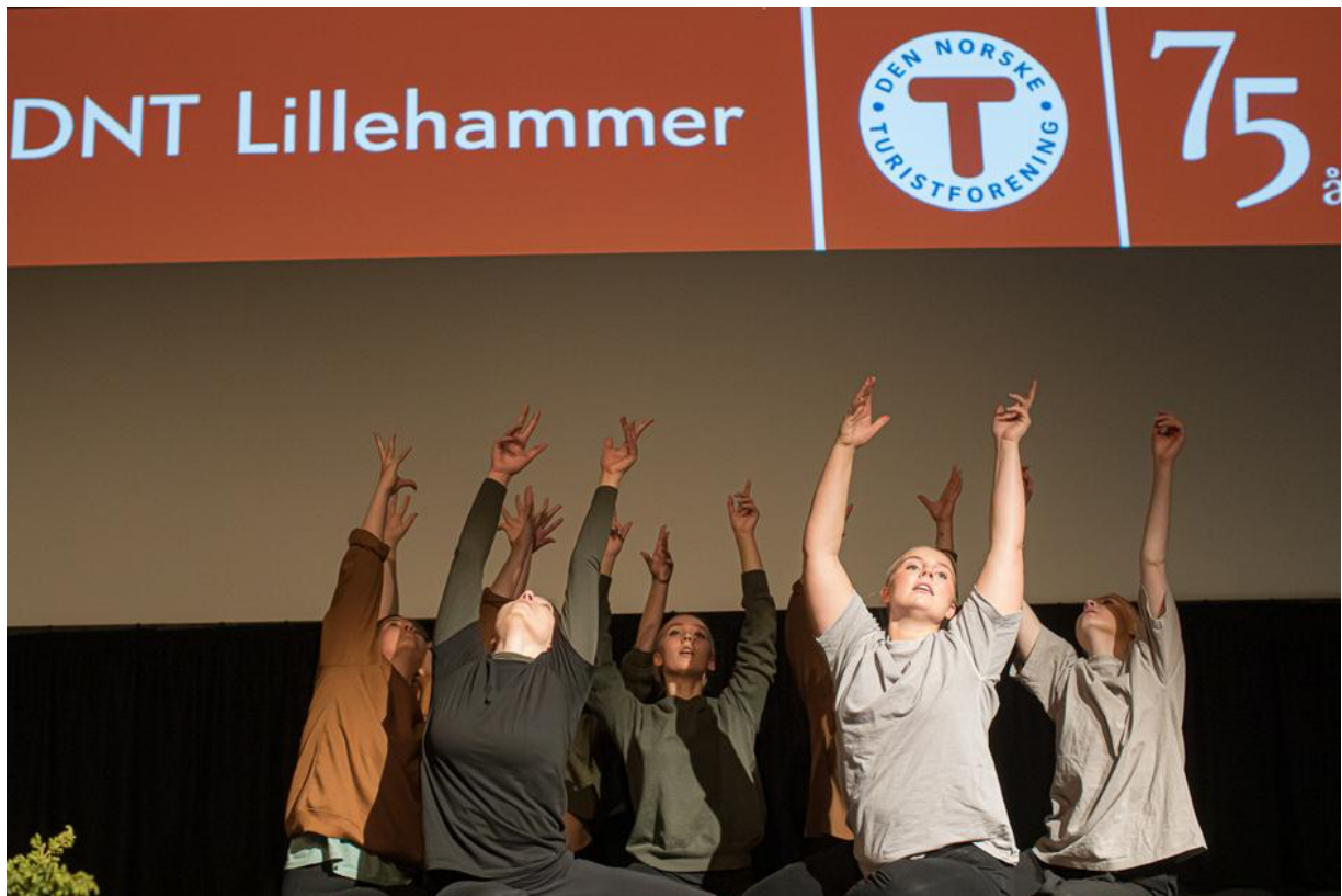
På bildet ser vi danse-elever fra Create – Lillehammer kreative videregående skole.

Den 22. oktober fylte DNT Lillehammer 75 år. 120 medlemmer og frivillige deltok i feiringen på Scandic Lillehammer hotell. Det ble en minnerik kveld med film, musikk, vakre naturbilder, foredrag, dans, kake, gaver og mange fine ord.