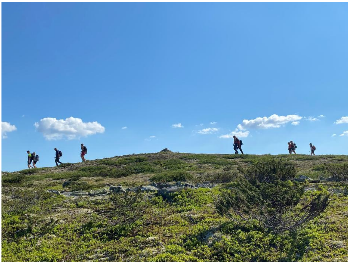
Bildet er fra årets fjellmarsj fra Prøva til Djupslia.