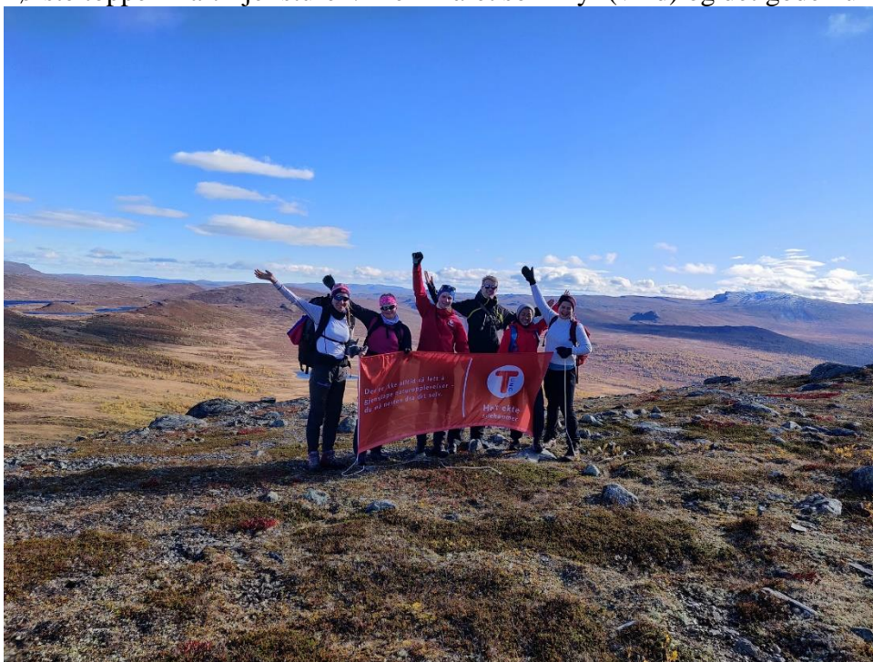
Fra Storhøliseter ved Storhøpiggen.