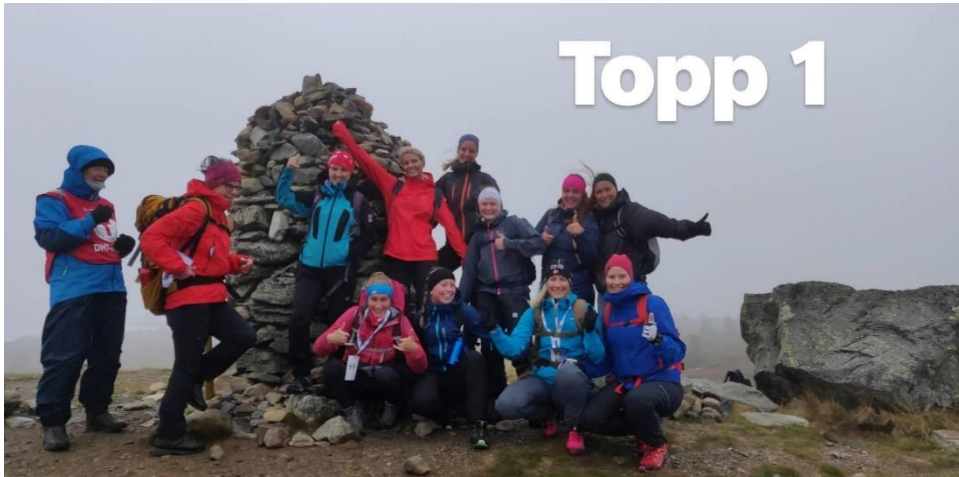
Første toppen fra 7-fjellsturen. Merk håret som flyr (vind) og det gode humøret (tomlene).