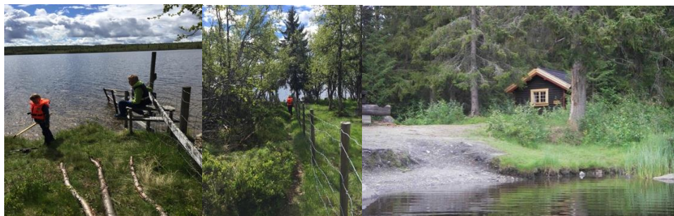
Glimt fra Djupslia