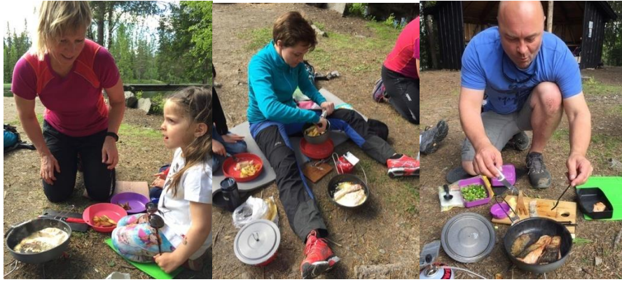
Fra primuskurs på Krokbu

Trilletterer har vært gjennomført regelmessig hver onsdag/torsdag (unntatt midt på sommeren). Trilletterene er et godt tilbud til unge foreldre som er hjemme med barn, og som ønsker å trille og trimme sammen i sosialt fellesskap. Et kjennetegn ved trilletterene er at de har ulike utgangspunkt, og at de følgelig byr på stor variasjon i type turmål og terreng.