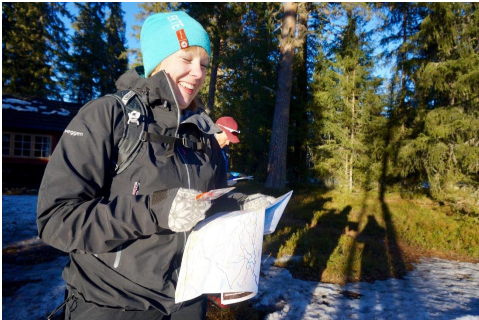
Fra ferskingkurset på Krokbuå i april