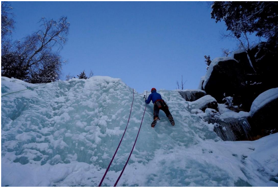
Isklatring i Mesnaelva. Dette er også på programmet for 2018.