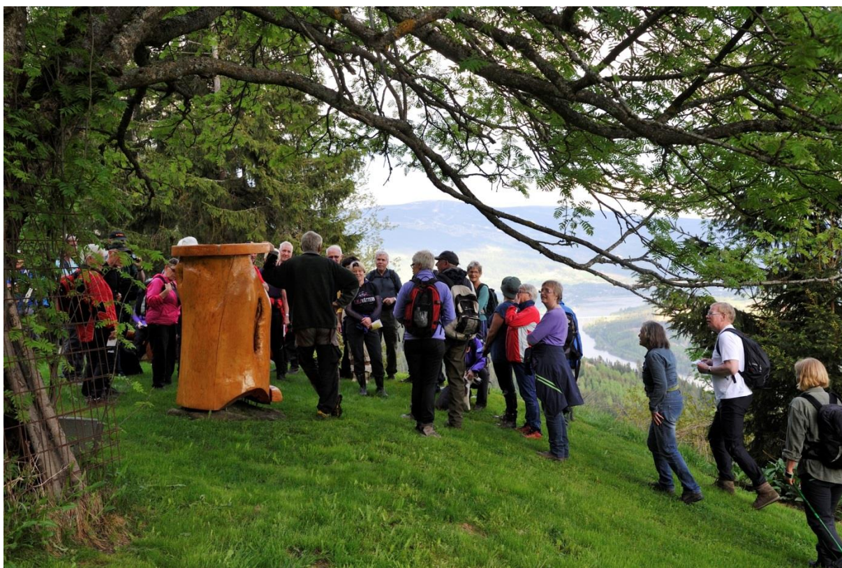
Kveld under Skjønnsbergaksla.

Til sammen har ca 1800 personer vært med på dagsturer, helgeturer og kveldsturer.