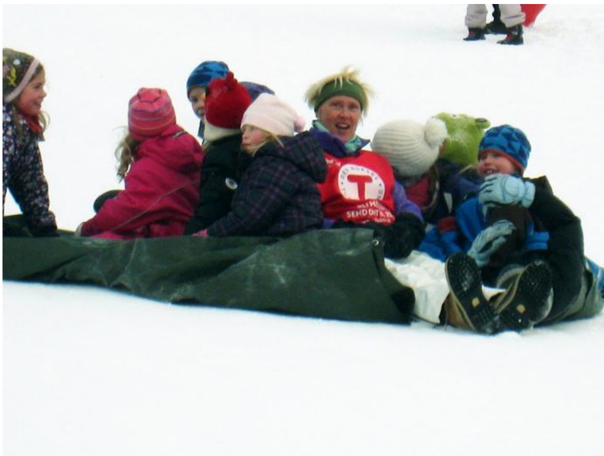
fra Kom deg ut-dagen februar 2013.

I løpet av høsten 2012 er det planlagt en rekke ungdomsaktiviteter for 2013, slik at foreningens ungdomsarbeid er på rett veg.