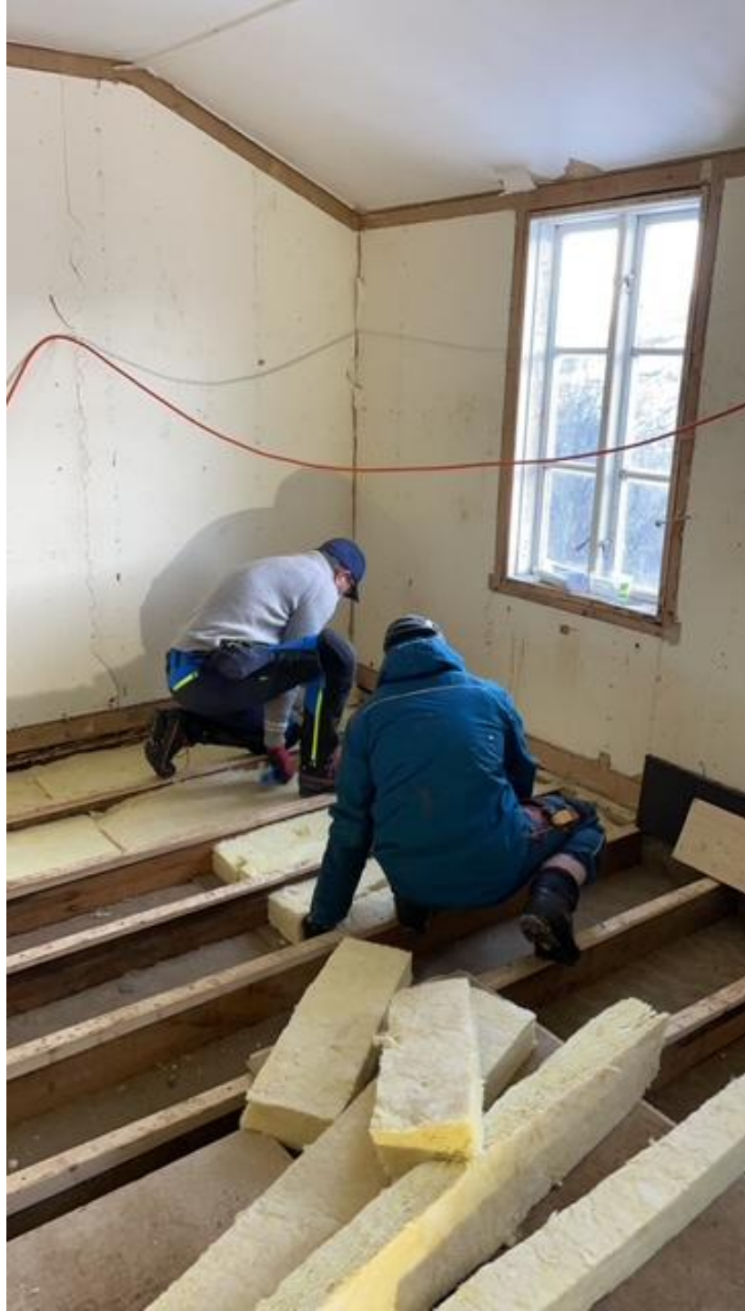
Isolering av gulv.