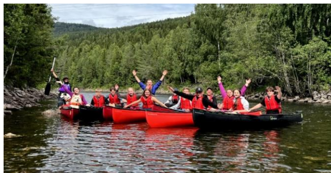
PADLING I ETNA: Basecamp for ungdom 13-16 år i sommerferien.

Ved NTNU i Gjøvik har samarbeidet med studentgruppen NTNUi friluftsliv funnet sin form. I 2024 har vi bidratt til å gi studentene et tilbud om blant annet brevandring, skredkurs og grunnkurs i havkajakk. Hyttetur til Gamle Torsætra ble det også.