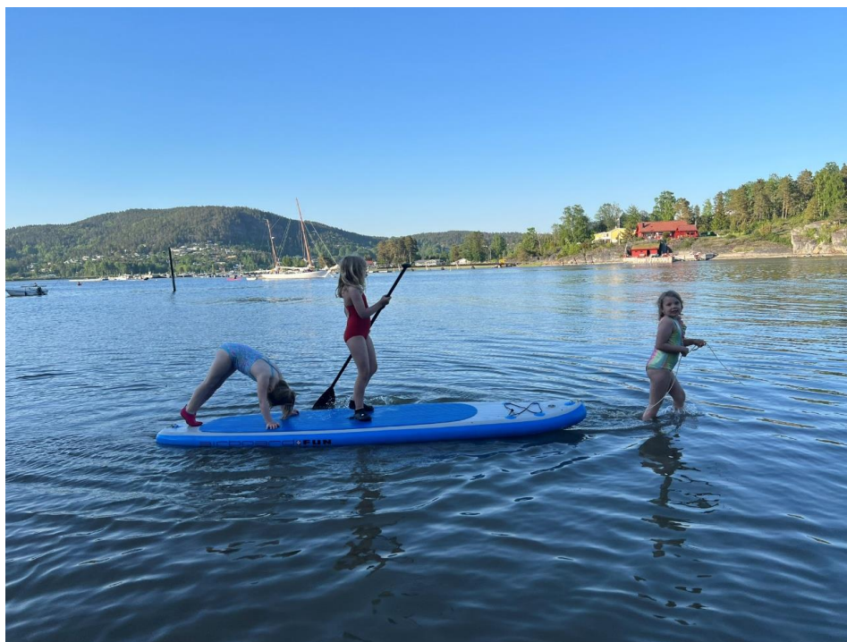
VÅREVENTYR: Barnas turlag samlet seg ved Veslekillingen ved Sandebukta en herlig maihelg.

Med et spennende år i vente, håper Barnas Turlag Gjøvik og Omegn å inspirere enda flere familier til å bli med på tur. Friluftsliv handler ikke bare om de store opplevelsene, men også om gleden ved å være sammen ute.