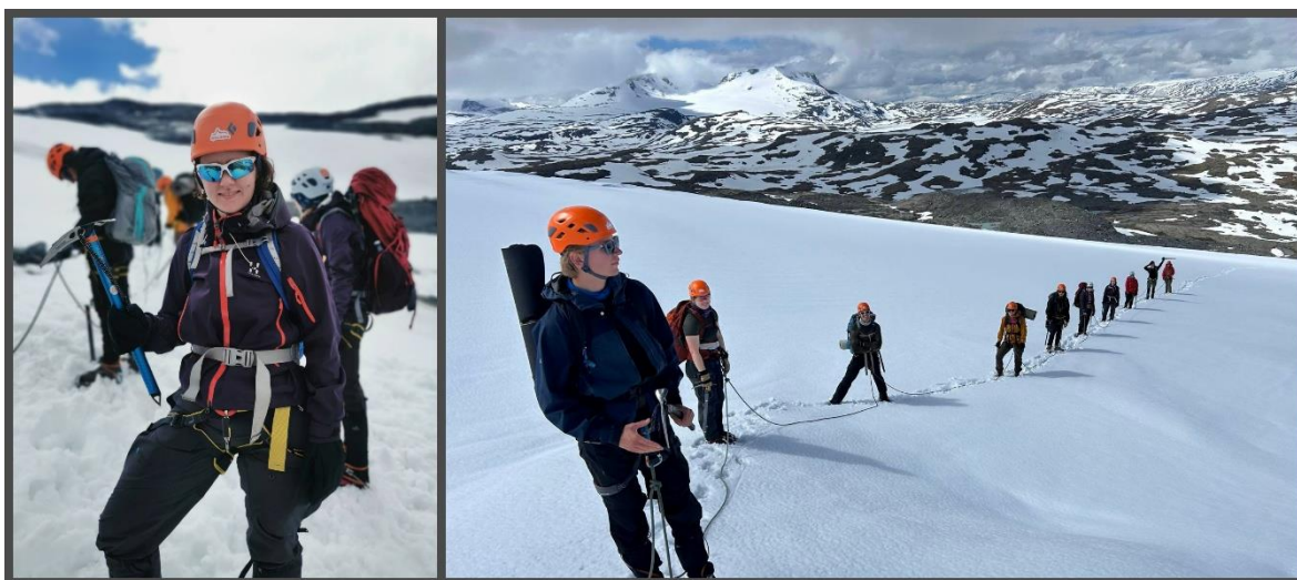
OPP PÅ BREEN: Brevandring og tinderangling for DNT Ung/studenter i sommer