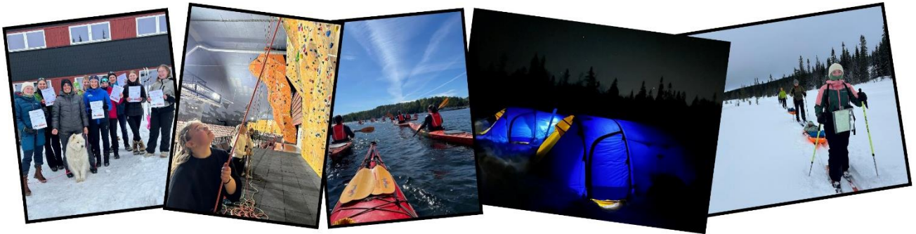
UNGE NATURTALENTER: 2023/2024

2024 ble et spennende år på ungdomsfronten! Høsten 2023 startet vi prosjekt Unge Naturtalenter, der 12 ungdommer i alderen 15-19 år i løpet et skoleår fikk en serie med kurs- og naturopplevelser, blant annet klatring, padling (kano og kajakk), vinterovernatting, ferskingkurs i friluftsliv på programmet. Åtte av dem gjennomførte DNTs grunnleggende turlederkurs. Målet er at naturtalentene blir med videre og skaper friluftsopplevelser for seg selv og andre ungdommer. Mange av dem har allerede bidratt på arrangementer for barn, eksempelvis friluftsskolen og kom deg ut-dagen.