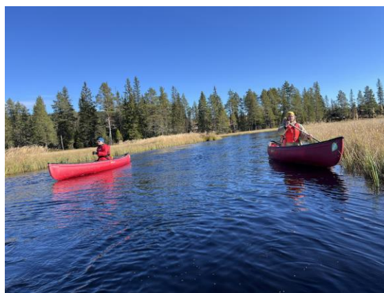
grunnleggende kanokurs i 2024