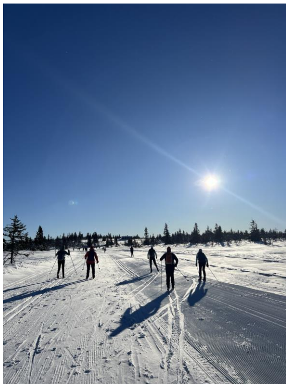
LANGTUR: Glimt fra Langtur på ski fra Værskoi til Snertingdal i februar, et samarbeid med Skiforeningen Gjøvik og Omegn.