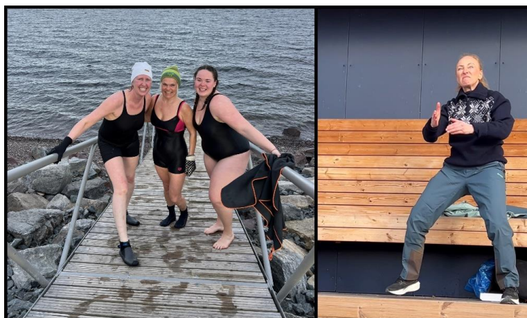
MARKERING: I mai ble det reåpning av Friluftshuset/Bybadstua med Peer Gynt-forestilling og frisk dukkert.