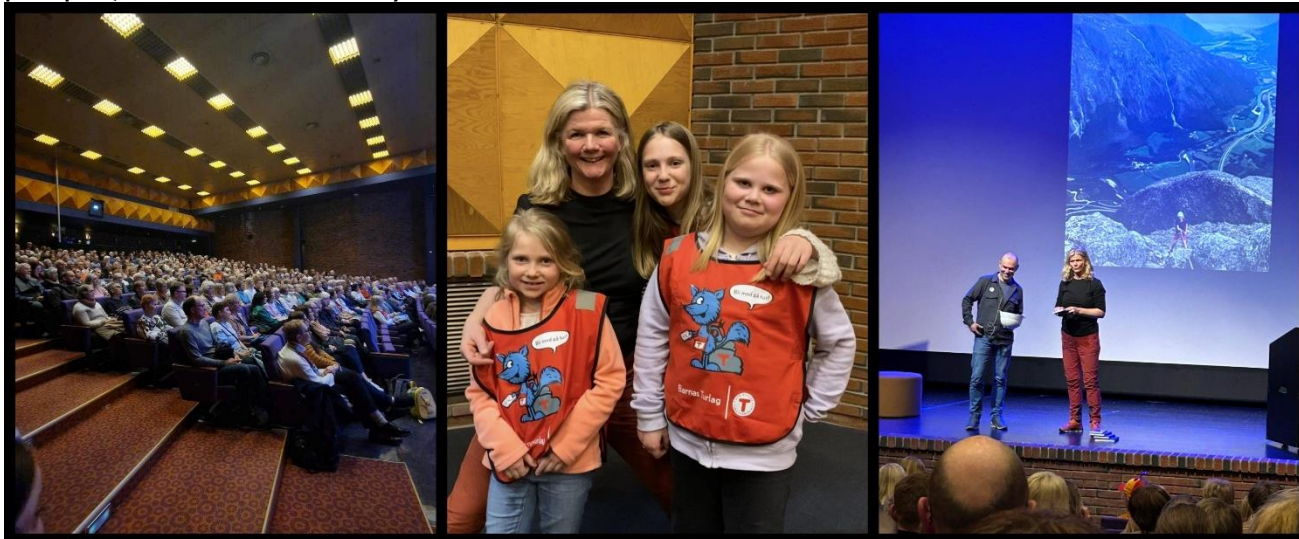
Anne Lindmo fylte Fyrverkeriet kulturhus på Raufoss med et herlig turforedrag.