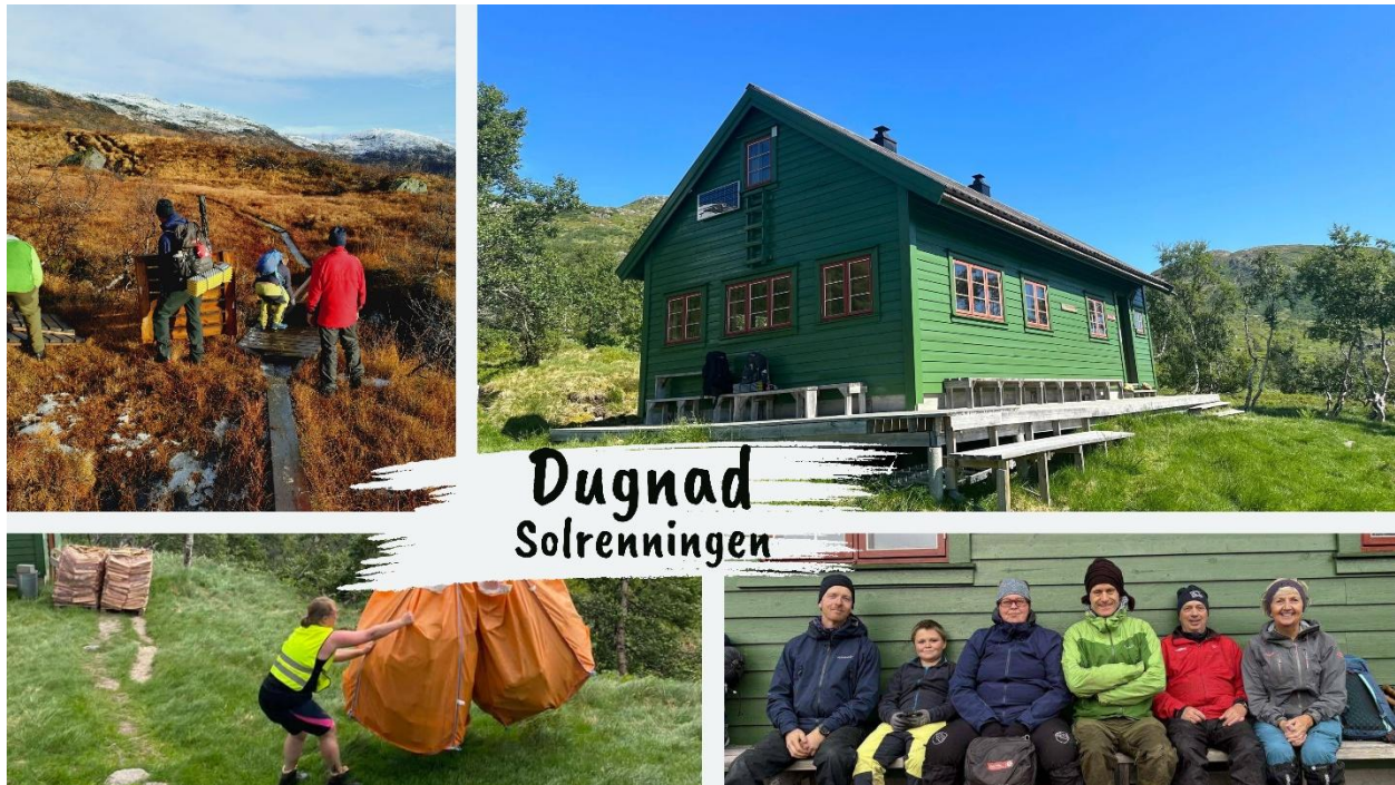
Bilder fra hoved dugnad sommer og høst 2025.

I august var det mulig å booke en gratis overnatting på noen av turlaget sine hytter, for å gi enda flere muligheten til å dra på hyttetur. I Stølsheimen var det i 2025 en 11% økning i besøkstallet i, og solrenningen hadde over 1100 overnattinger, mot ca. 780 i 2024.