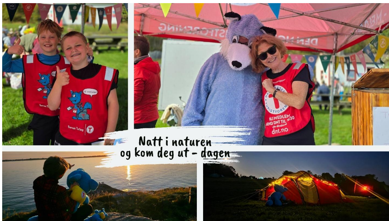
Foto: Tina E. Dale. Bilder fra natt i naturen og kom deg ut dagen (høst) 2025.

En nydelig strandkrabbesuppe ble også kokt over bålet nede i strandkanten. Her ble det spredt informasjon om mat som finnes rett nede i fjærekanten og mulighetene for å bruke tang og tare som smakstilsetning i mat.