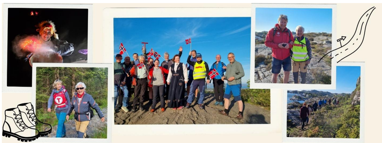
Bilder fra onsdagsturen og 17-mai tur 2025.

Onsdagsturen er uten tvil et viktig, lavterskel og helsefremmende tilbud. Det er alltid god stemning på tur, og en inkluderende tur-gruppe hvor det alltid er plass til nye turvenner. Takk til både deltakere og turledere for et flott tur-år med masse latter, engasjement og turglede.