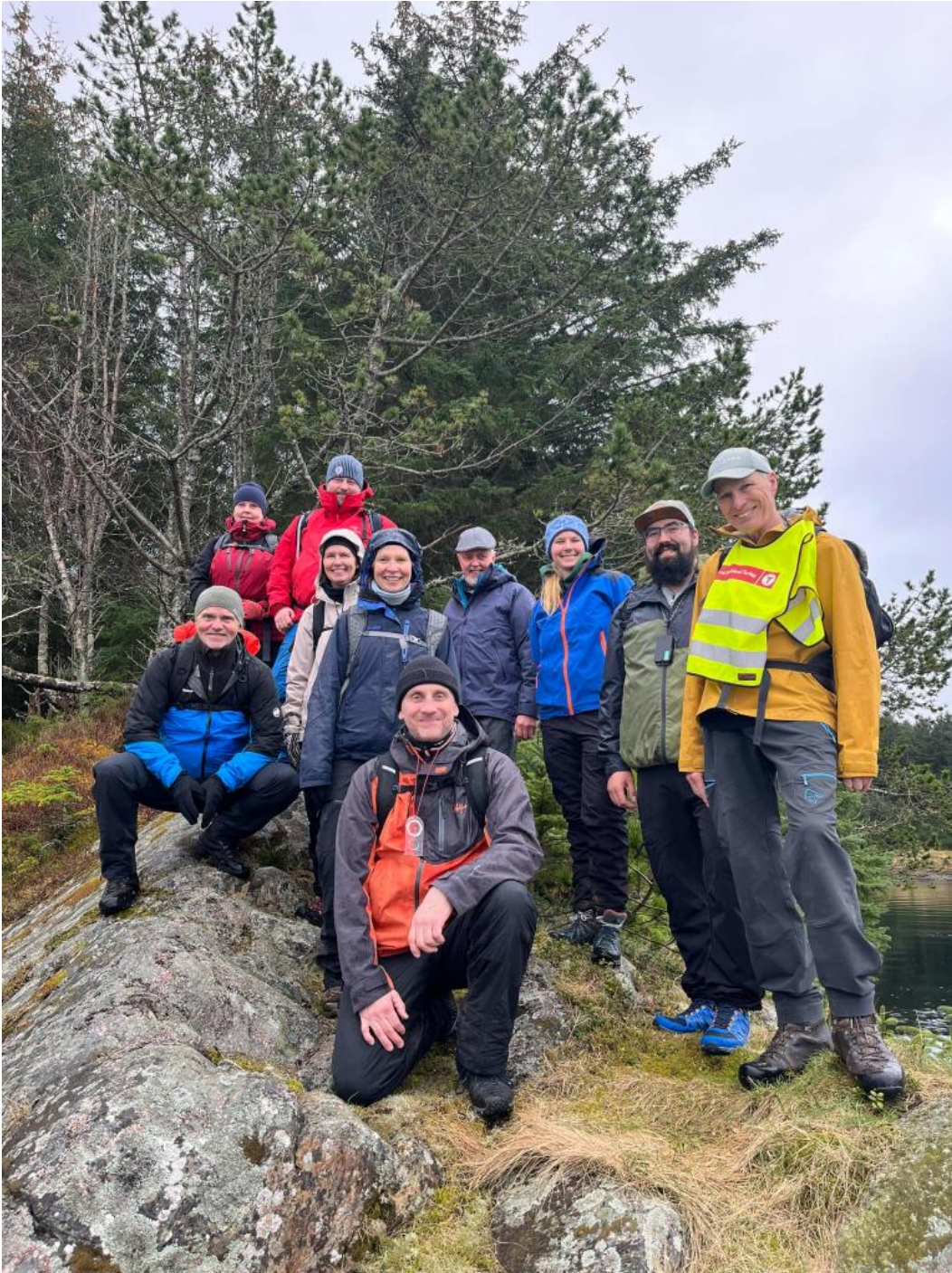
Bilde er tatt fra nærturlederkurs holdt ute på Fauskanger.