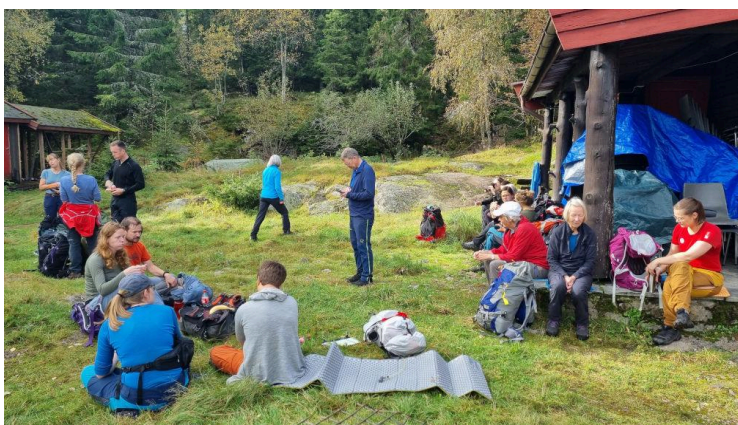
En liten pause ved Lynhytta

Og turen hjem igjen gikk jeg rett og slett bare med meg selv og mitt eget hode. Den gikk over Kobberhaugene, til Bjørnholt og – ja, du har kanskje tippet det – Bjørnsjøhelvete, før jeg gikk ned til Hammeren og ble hentet av mitt vanlige liv med mann og to barn. Jeg kan anbefale de greiene her.