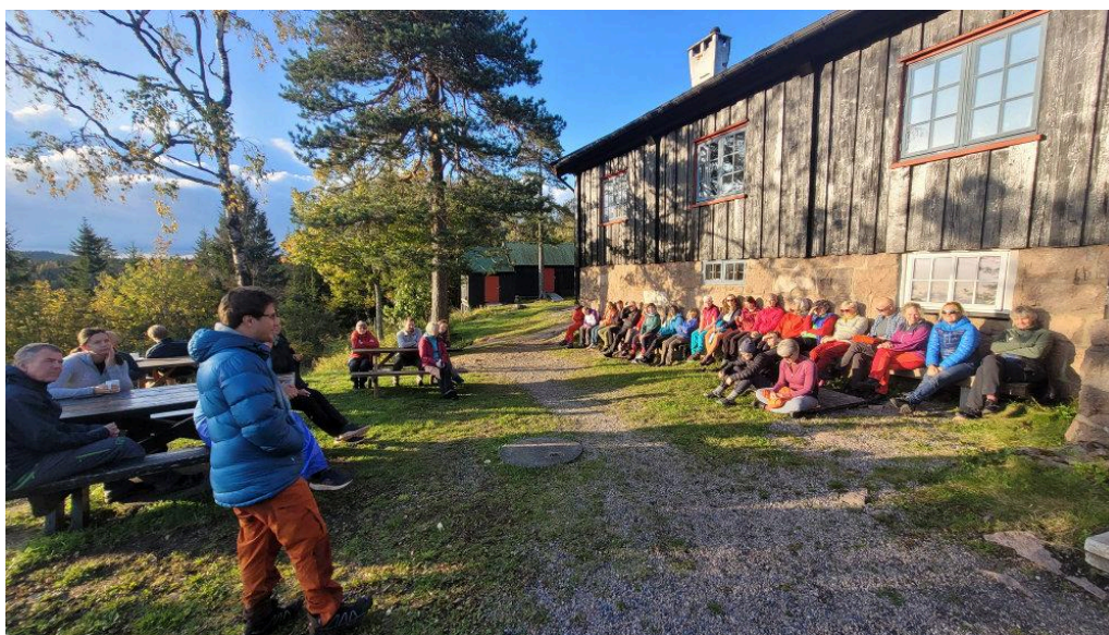
Erfaringsutveksling foran Kobberhaughytta.

Det er planer om å komme med et mer fyldig innhold om dette temaet i de kommende utgavene av Turleder'n.