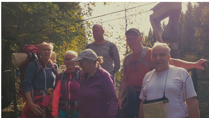
Gruppebilde ved Bjørnsjøhelvetet i motlys.

Altså kun en liten brødiskive, og ferden gikk videre, først bratt oppover, og så vestover i retning Bjørnholt. Underveis måtte vi gi plass til en stisyklist som nok hadde undervurdert stien (som han selv nevnte). Så kom vi endelig til Bjørnholt og en velfortjent niste – og nystekte boller for de som ønsket dette.