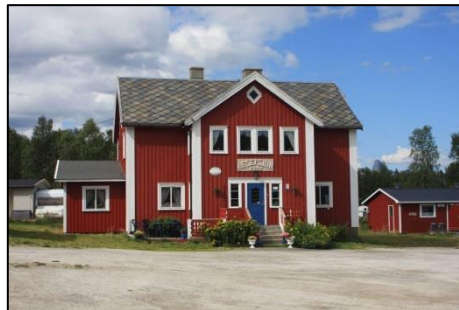
Graddis fjellstue.