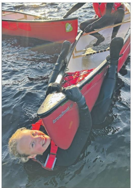
En tur på vannet er en flott måte å komme seg på. Dette er en viktig del av vår virksomhet. Vi tilbyr tjenester som hjelper oss med å nå våre mål.