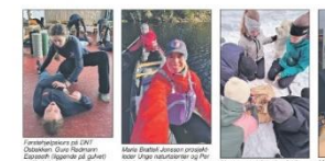
En gruppe mennesker som deltar i en aktivitet. Dette er en viktig del av vår virksomhet. Vi tilbyr tjenester som hjelper oss med å nå våre mål.