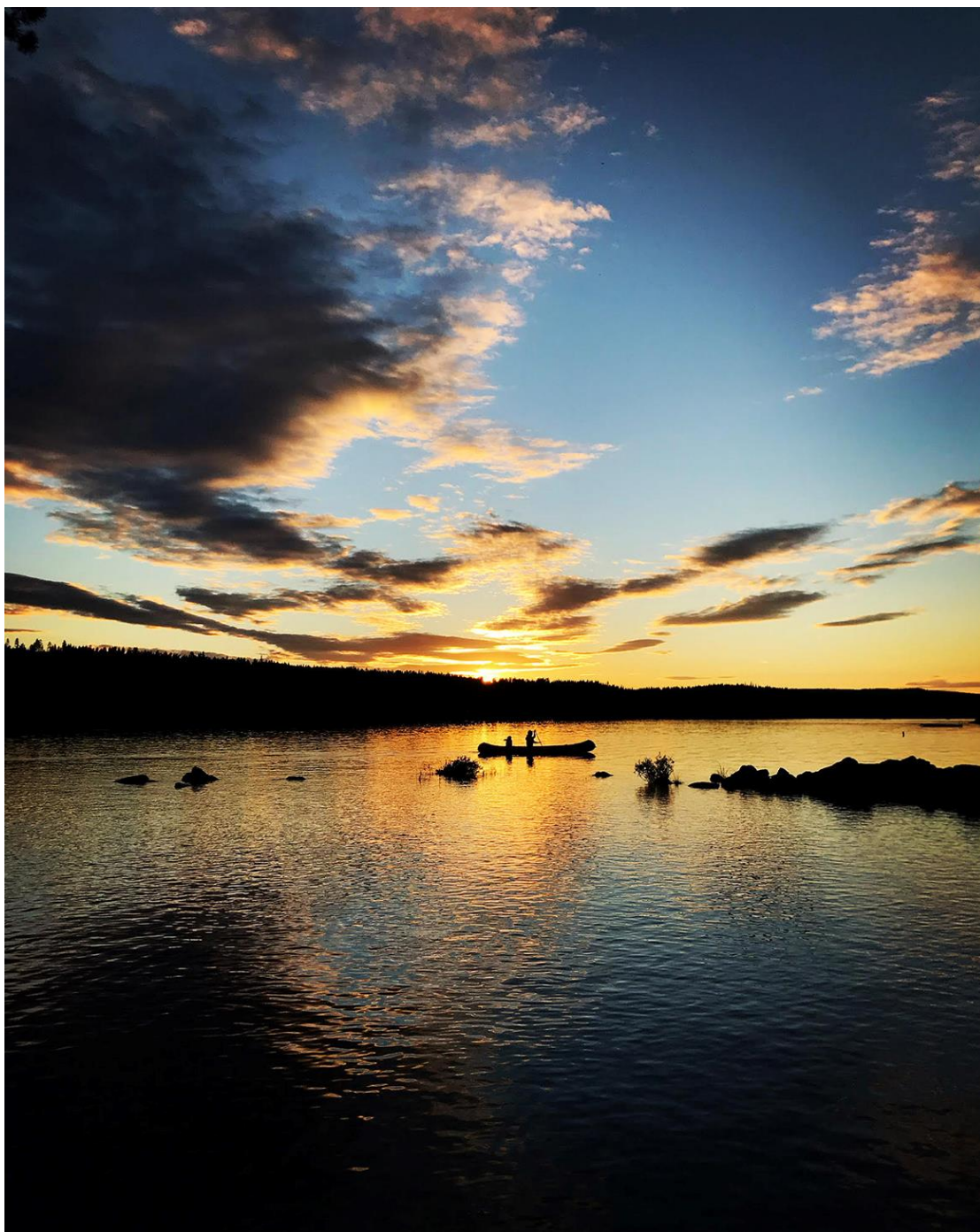
PADLEKVELD PÅ SKUMSJØEN: Folkets favorittbilde fra boka 70 turer i Gjøvik, Toten, Land.