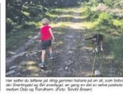
En tur i naturen er en flott måte å komme seg på. Dette er en viktig del av vår virksomhet. Vi tilbyr tjenester som hjelper oss med å nå våre mål.