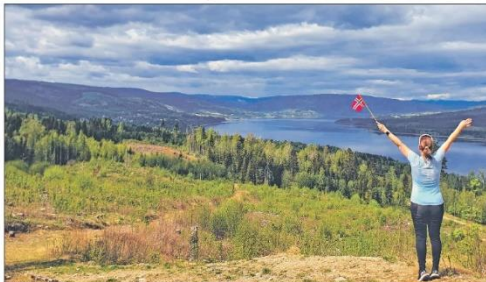
En tur i naturen er en flott måte å komme seg på. Denne boka gir mange gode anbefalinger til turstier og aktiviteter i naturen. Dette er en flott måte å komme seg på, spesielt for de som liker å være ute i naturen.