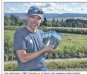
En frivillig i DNT hjelper en eldre dame med å bruke datamaskinen. Dette er en viktig oppgave for dem, spesielt for eldre mennesker som ofte har problemer med å bruke teknologien.

For de som ikke er vant til å bruke datamaskiner og smarttelefoner, er det viktig å ha noen som kan hjelpe dem. Dette er spesielt viktig for eldre mennesker som ofte har problemer med å bruke teknologien. Mange frivillige i DNT hjelper til med dette, og det er en viktig oppgave for dem. Dette er spesielt viktig for eldre mennesker som ofte har problemer med å bruke teknologien. Mange frivillige i DNT hjelper til med dette, og det er en viktig oppgave for dem.