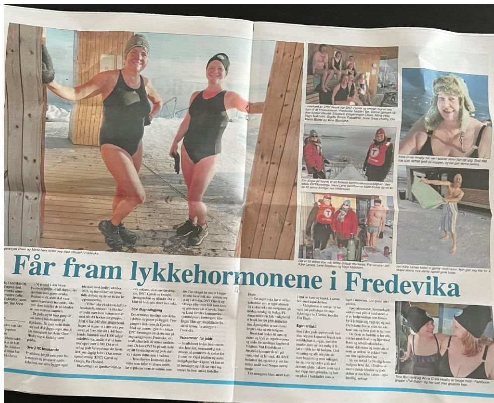
Oppslag i Toten Blad om Friluftshuset/badstua i Fredevisa.