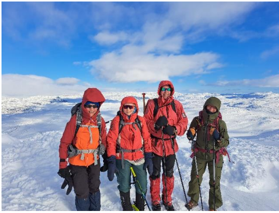
Vintertur til Sulebu

Ekspedisjonsstolpejakt - en runde på ca. 20 km på Vardalsåsen med 15 stolper. De 15 stolpene samlet 6941 registreringer. 316 tok samtlige stolper på den 20 km lange runden. Den mest besøkte stolpen, sør for DNT Osbakken, fikk besøk av 655 personer. Dette var et samarbeid mellom DNT Gjøvik og Omegn, Stolpejakten og lokalavdelingen av BirdLife, som la inn kunnskap om fugler på de ulike stolpene.