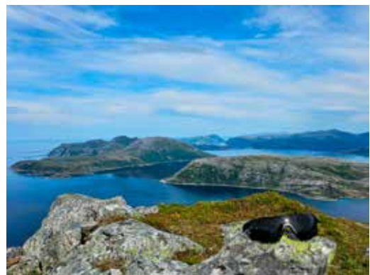
Solbrillene på toppen.