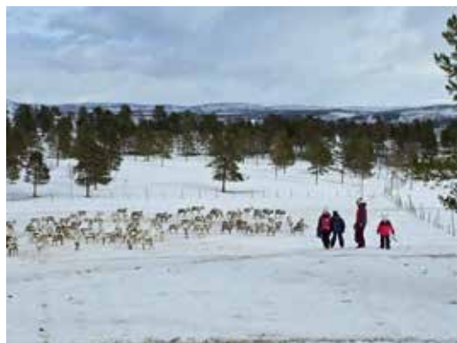
Å få ta del i reindriftnæringa så tett på er med på å øke forståelsen mellom mennesker og dyr og en tradisjonell næring i nord, som er under stort press.