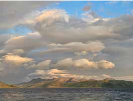
Rebbernesøytraversen i midnattssola sett fra hytta.

hele veien. Det ble fotografert og studert og beundret hele veien. Vi bare måtte ta alle sanseintrykkene inn over oss bit for bit.