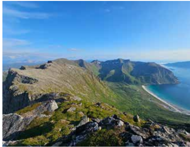
Breivika, Stortinden og Helvetestinden østover

Nederst var ura overgrodd av høystauder, vier og kjerr og våt mark full av sibirgressløk. Sommerlufta var mett av salt sjø, tang, sibirgressløk og duftende mjødurt og geitrams og fargene var magiske. Videre oppover ble det bratt og mer stein og berg og lavere vekster hvor tirilltunger overtok blomsterprakten. Lufta sto stille og det var varmt, varmt. Oppe i skyggen i fjellsida sto en diger reinflokk og søkte avkjøling. Havørna seilte over toppene og en jaktfalk kom i stup mens perspektivene endret seg