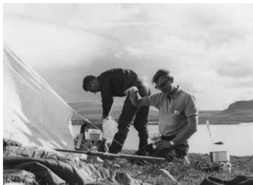
Egg må ikke oppbevares i kartong.

Da jeg var kommet over, fikk jeg en kraftig dask i hodet. Jeg trodde det var kompisene som kastet torv for å erte meg. Jeg sa fra at de måtte slutte med det tøvet, men de sverget på at de ikke hadde bedrevet med noe slikt. Det viste seg at det var ei jordugle som