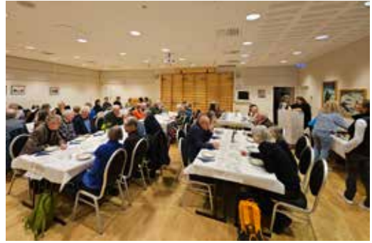
Praten sitter løst rundt bordet.

Kontoret har nå 4 stillinger og i år som i fjor ønsker de seg større og mer hensiktsmessige lokaler. Finnes det ikke noen ledige lokaler i Tromsø sentrum? Hold øyne og ører åpne.