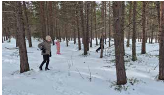
Leting i furuskogen.

Takk for en super innsats til liten og stor, vi satser på at påskeharen er like raus neste år og at alle vil være med på neste jakt også.