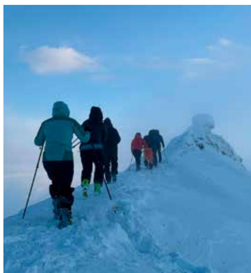
På tur opp mot Trollsteinen med og uten ski.