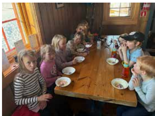
Lykke er å ha turledere som ikke er «gramjegere» på tur! Da blir det plass til pakker med deilig gelé og vaniljesaus!