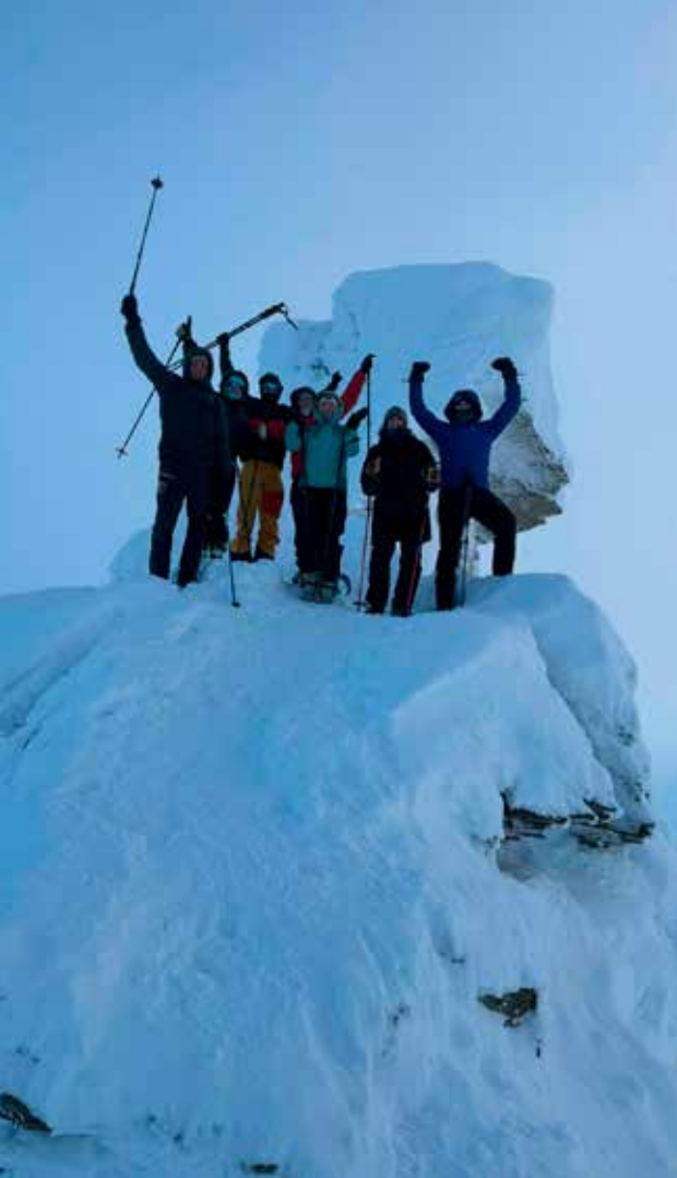
Stolt ungdom nådde toppen alle som en!