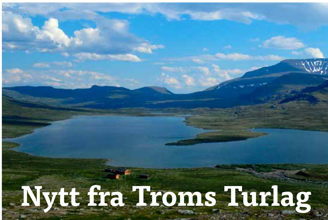
Vuomahyttene og vannet.