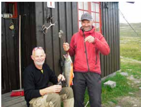
Soknerådet med fin fisk.

Vel hjemme ble håven gjort rein og den funker, men henger mest til pynt og som et minne. Den har ikke vært med på flere turer inn til røyeparadiset Vuomajavri.