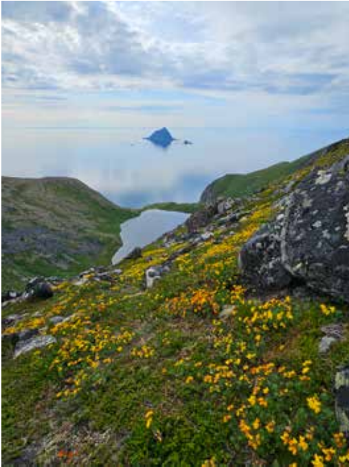
Vassdalsvatnet og Sør-Fugløya og mere tirilltunger.