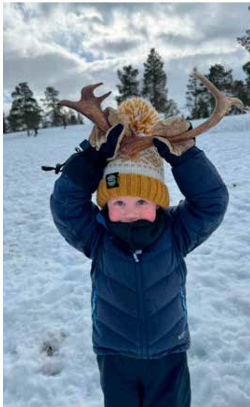
Reinsdyr er fascinerende dyr!

Samtidig er dette avhengig av folk som er villige til å dele. Lokale aktører som tar imot barn og unge, og gir av sin tid, erfaring og kunnskap, spiller en uvurderlig rolle. De er