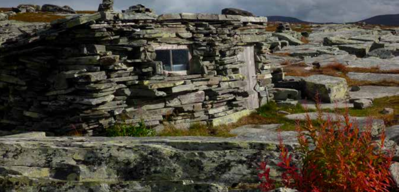
Bildetekst: Steinhytta ved Rostaelva.