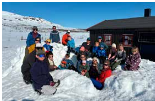
Værgudene viste seg fra sin beste side og gjorde lek og matlaging utendørs til en drøm!

Da de 25 deltakerne satte kursen hjemover, var det med røde kinn, mette mager og minner om en helg fylt med mye lekning og ekte turglede.