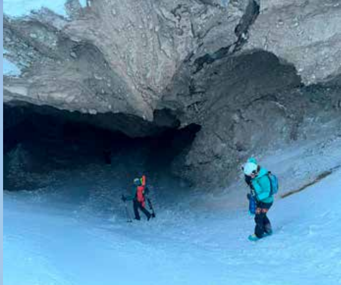
Underveis til Trollsteinen må man gå igjennom en flott grotteformasjon som gjør akkurat denne turen ekstra flott!