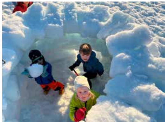
Bygging av snøborg ved Trollvasbu er obligatorisk.