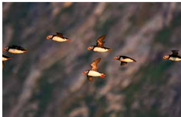
Lundefugltrekk på matsøk i midnattssola.