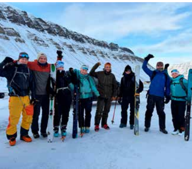
Blid gjeng samlet til brief i Nybyen før start.