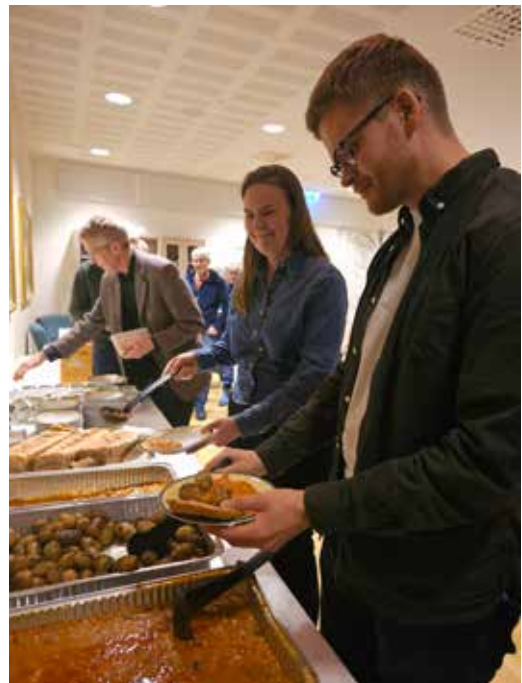
Og så var det bare å forsyne seg.