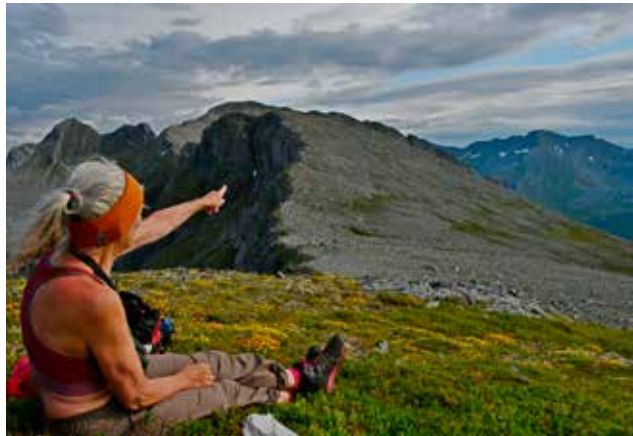
Veien videre langs ryggen.