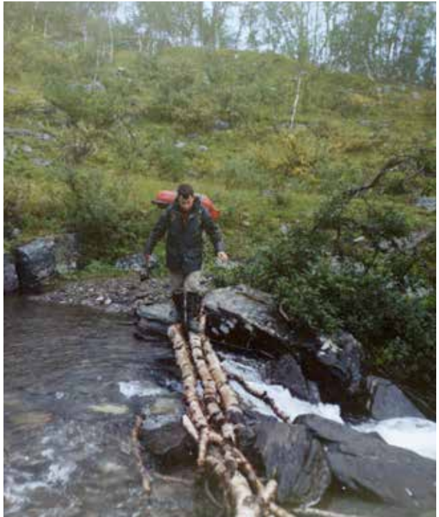
Elveforsering på tre bjørkestranger.

Dagen var på hell, og vi begynte å ta oss nedover dalen for å møte skysskaren. Han kom som avtalt, og vi avsluttet turen som hadde gitt oss mange nye gode inntrykk av naturen i indre Troms. Opplevelsen har satt arrvev i mitt sinn, for etter denne turen har det blitt årvisst med vandring i fjellene her inne og ellers rundt i Nord-Norge.