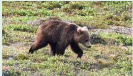
Best å komme seg vekk.

Turen på dag tre, 20. juni, startet fra Dividalshytta tidlig på morgenen i strålende solskinn. Linja mi i Julosvaggi startet øverst i tregrensa. Dette var et godt habitat for fjellfugler, typisk godt egnet for fjellrype. Etter fem-seks punkter og å ha lagt inn observasjonene fra sist takserte punkt, hentet jeg fram visningen av ruta til neste punkt på GPS'n og løftet jeg blikket for å gå videre. Da får jeg øye på en brun skapning som jeg først trodde var en jerv, men oppfatter raskt at dette var en ungbjørn. Min første observasjon av brunbjørn, en Ursus arctos ! Bjørnen så ikke meg, den var alt for opptatt av å spise på lyngen og hadde heller ikke en vindtrekk med lukt av meg. Den var cirka 100 m unna, fortsatt litt langt unna for det optimale bilde med 300 mm linse. Uansett akseptable bilder, men først og fremst en