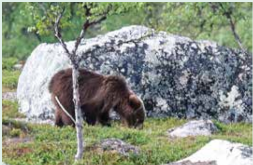
Godt med litt å spise.

fantastisk opplevelse. Etter å ha tatt bilder og sett på bjørnen i kikkerten i en 10-minutters tid, ble det litt småkjølig for meg. Jeg lirket jakken forsiktig ut av sekken, men det var nok til at bjørnen hørte det. Dermed satte han nedover mot fjellbjørkeskogen i stor fart og det var det. Dette var et minne for livet for meg. Jeg har reist mye og til og med bodd på Svalbard og i Nepal og har derfor hatt mange fine naturopplevelser. Jeg må innrømme at brunbjørnopplevelsen var en av de aller største opplevelsene i mitt liv.