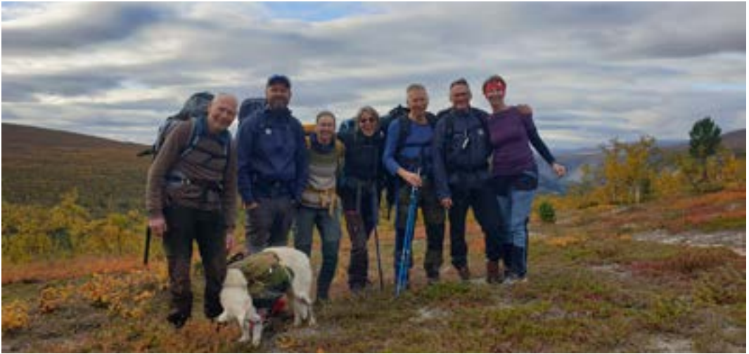
Hele turfølget på randen av Reisadalen.