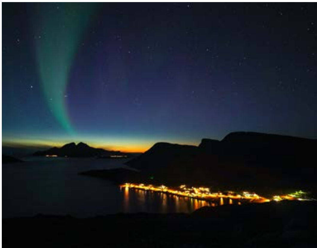
Lure nordlys etter solnedgang.

Jeg skal beskrive en fin nordlysstur til Trehørningen, 283 m.o.h. i Skulsfjord ved Tromsø, men en slik tur kan gjøres til mange steder. Turen går på en bred umerket sti fra startstedet ca. 800 m før man kommer til Lyfjord fra Tromsø. I vått vær er stien gjerne gjørmete og sleip, men på høsten fryser den til og det er fint underlag. Hovedstien går litt øst for parkeringen, men det er også mindre stier som fører til topps. Det er ca. 40 minutter og rundt 2 km å gå til toppen, ca. 200 høydemeter opp og en nokså lett tur. Unngå å bli svett for det blir fort kjølig når en stopper opp. Over skoggrensa har en flott utsikt mot Lyfjorden, Vengsøya, Nordtinden, Kaldfjorden m.m. På toppen blåser det gjerne noe, men går en litt unna toppvarden er det gjerne mer le.