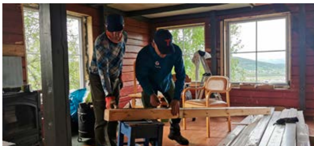
Snekring av Grønnkollenhytta.