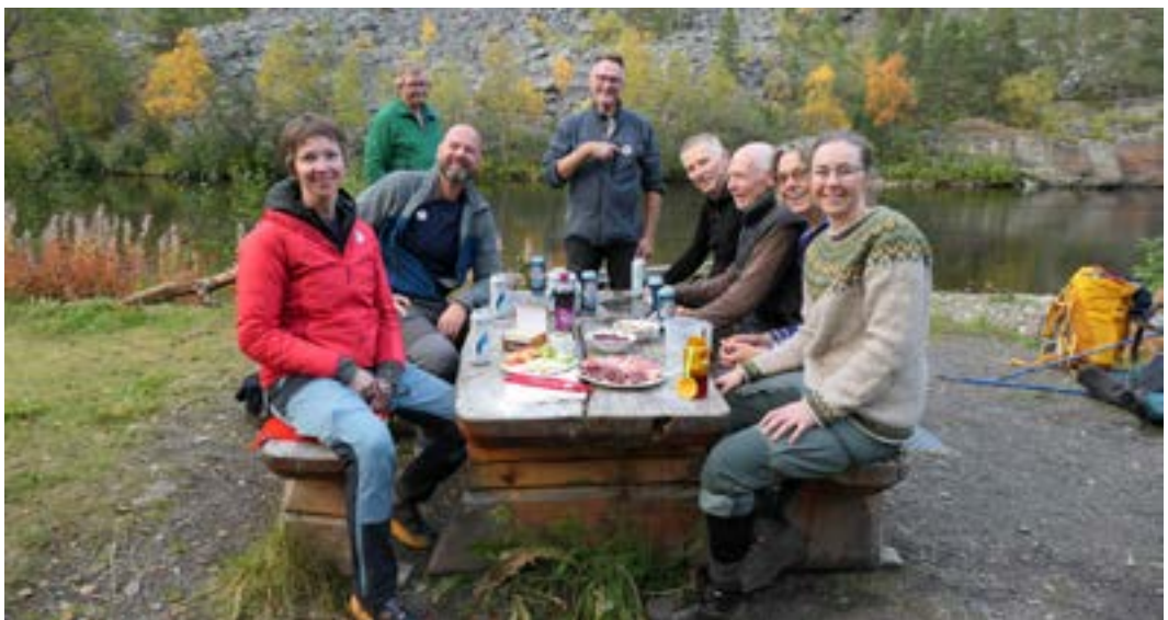
Mottakelse ved Nedrefoss.