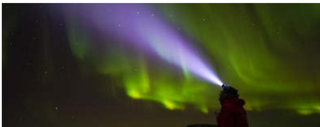
Forsida: Trollvassbu.

Har du spørsmål om turer, hytter, ruter, veivalg og føreforhold, still gjerne ditt spørsmål i Troms Turlags Facebookgruppe, der får du raskt svar fra andre medlemmer og turgåere som har vært ute på tur og har oppdatert informasjon. https://www.facebook.com/groups/43261776282