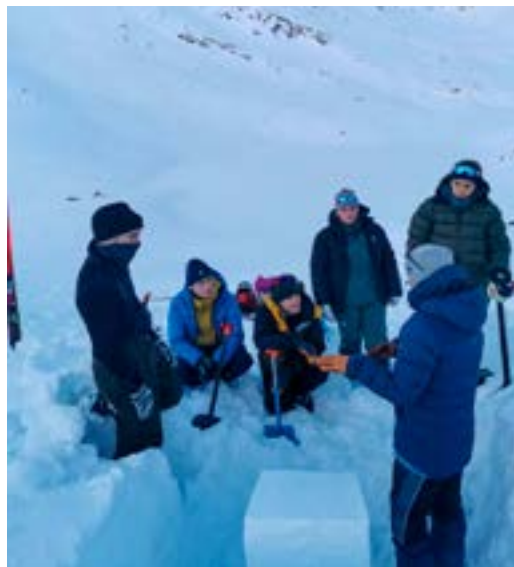
Mange spørsmål og gode diskusjoner. Her undersøker deltakerne på skredkurs snødekkets oppbygging og stabilitet.

Vi må innse at vi nok en gang har feilvurdert hvor mye vi klarer å lære bort på et tredagers skredkurs. Læring tar tid, krever refleksjon og motivasjon, noen å reflektere sammen med, og noen som kan veilede