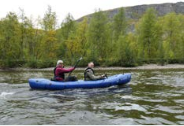
Her går det unna.