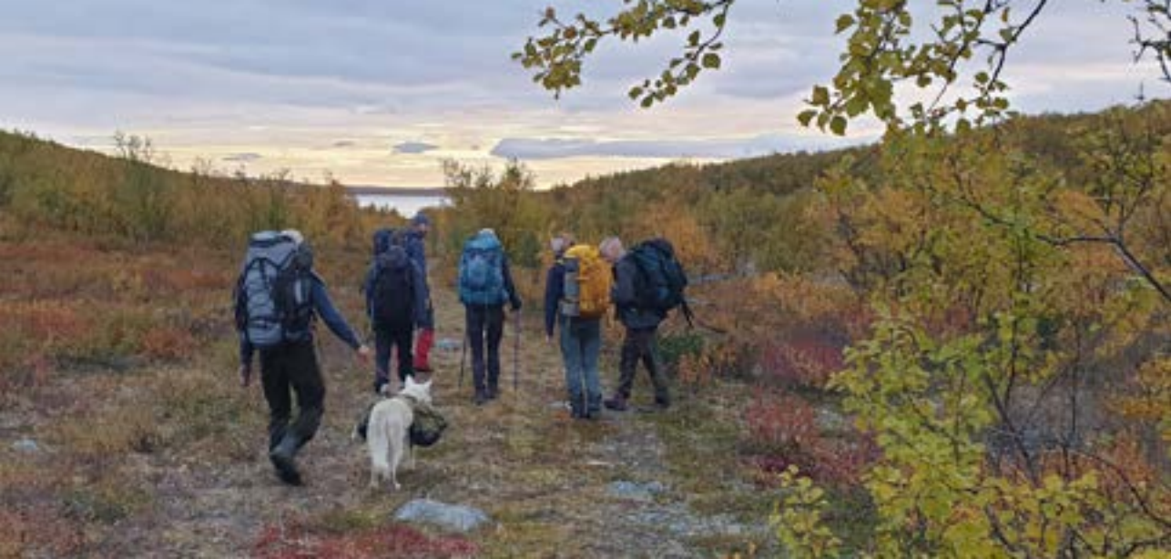
Reisavann i sikte.