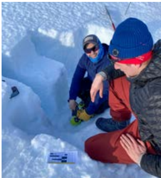
Mange spørsmål og gode diskusjoner. Her undersøker deltakerne på skredkurs snødekkets oppbygging og stabilitet.

Jeg ser på de halvforfrosne kroppene som står foran meg og som rister i takt med vindkastene. Jeg blir møtt av tomme blikk. Jeg gjentar: «Vi har funnet ulike lag i snødekket og identifisert det svake laget. I tillegg har vi funnet bunden snø som kan danne flak og glideflaten kan karakteriseres som Q 1 ». Like tomme blikk. Jeg ser bort til medinstruktøren. Han trekker på skuldrene. Vi forventer begge to at deltakerne sier at de skjønner eller i det minste stiller et spørsmål. Ingenting.