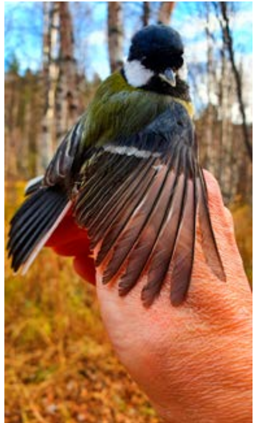
Kjøttmeis i handa.