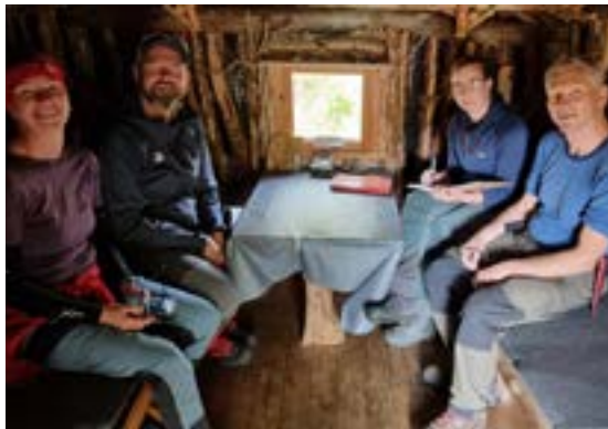
Besøk i Arthurgammen.