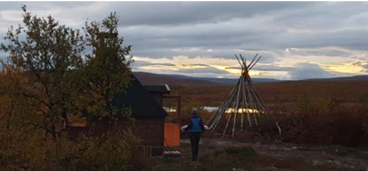
Kveldsstemning på vidda.