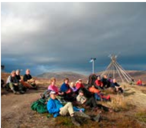
Mens vi venter på båten