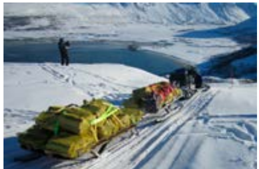
Vedtransport til Gammelhuset i Skipsfjorden

Vi har gjort avtale med Storfjord scooterforening som hjelper oss med transport til noen av hyttene. Det opplever vi som en nyttig avtale.