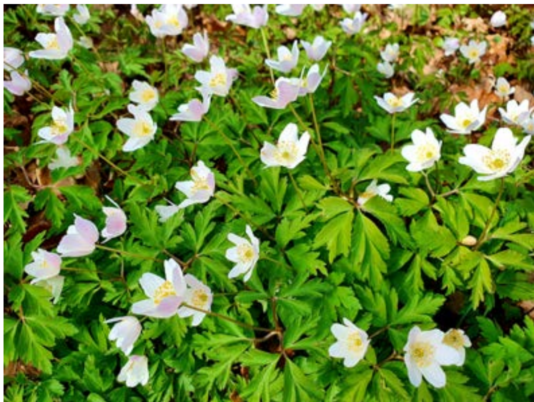
Forsida: Kajakker i Meløyvær.

nyetablerte bruutvalget og planlegger grundig inspeksjon og statuskartlegging på flere bruer i løpet av ettersommeren/høsten. Dette gjelder først og fremst bruene i Rostadalen. Dato er i skrivende stund ikke fastsatt. Informasjon om resultatene av disse inspeksjonene vil bli formidlet til publikum etter hvert.