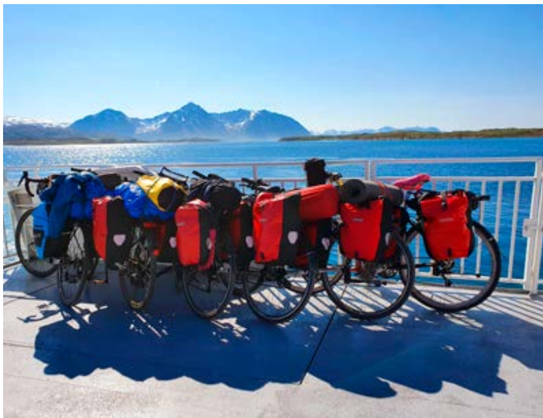
Syklene ombord på Fjordprinsen