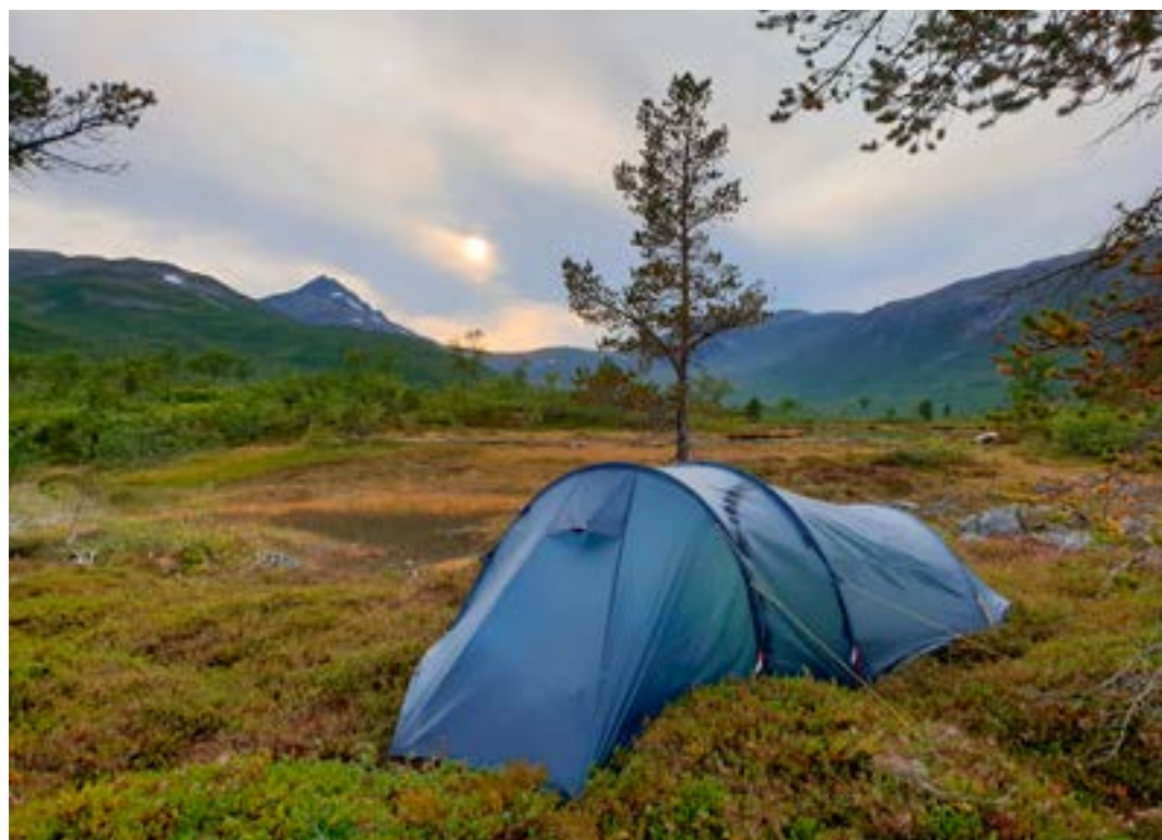
Litt kupert teltplass