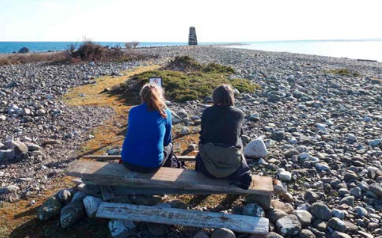
Utsikt mot Skadden.