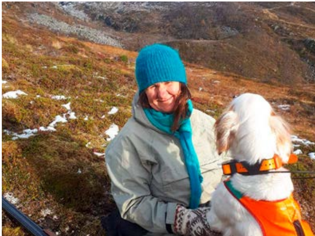
«Sigrid på jakt»

En presentasjon basert på telefonintervju, «saksing» fra media og tidligere møter