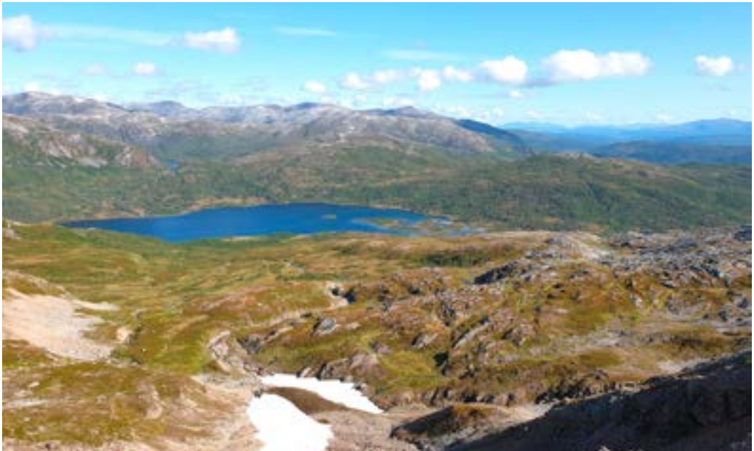
Åndervatnet og midtpunktet i Nasjonalparken

Vel oppe med Åndervatnet 105 m.o.h., etter 6,5 km er det fine muligheter å slå opp telt og campe. Alt etter hvor tung sekken er, bruker jeg ca. to timer hit. Der er det ei hytte med tre sengeplasser. Den er så populær at hvis du skal overnatte der oppe er det greit å ta med et bittelite telt som backup. Parkforvalteren har hengt oppslag om å benytte seg av godsengene bare ei natt. Det er fordi at denne hytta ligger hvor stiene «Senja på langs» og «Senja på tvers» går. Åndervatnet er et knutepunkt og en sentral plass å campe for flere turmål. Treffer alltid folk her, vatnet ligger midt i parken. De som går disse turene, velger derfor å slå leir for natten her.