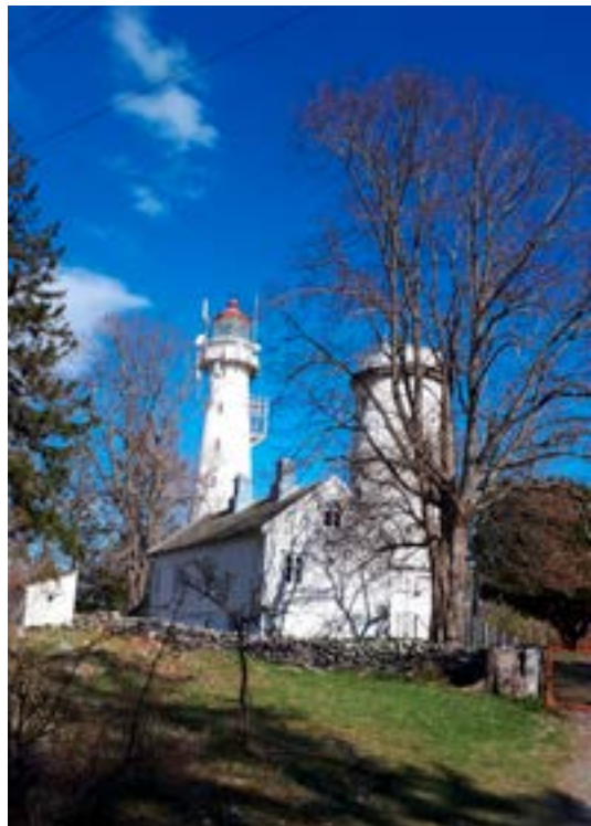
To tårn.