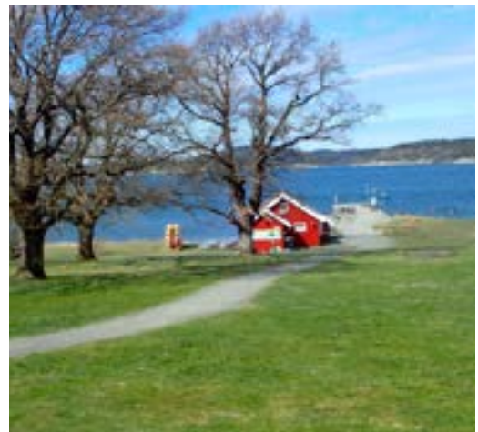
Øytangen sjøbua.