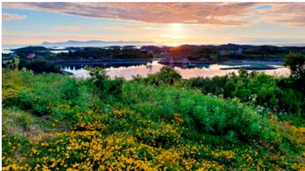
Fra Russøya mot puben og Gårdsøya

sentrum. Vi ville se mer av Bjarkøy og teltet ved Bjarkøy Brygger med tilgang til service-rommet. Vi syklet alle veistykkene og noen gikk en tur opp til et utkikkspunkt på toppen av øya.