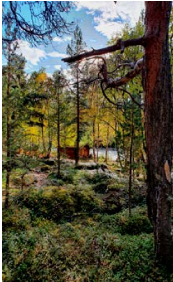
Ole Nergårdstua.