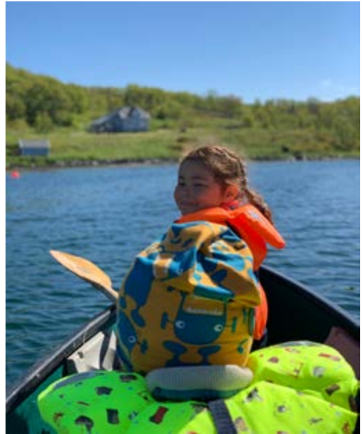
Kanopadling ved Haugland gård

En av våre første store turer gikk til Sandvika på Karlsøy. En nydelig sandstrand rett ut mot storhavet. Her er det godt tilrettelagt med utedo i campen. Det ble en noe dramatisk tur. Noe dramatikk var av den gode sorten, for eksempel en grottevandring med hodelykt. For i Sandvika er det nemlig en grotte som for ikke lenge siden var bebodd. Det var en tur med mye skrekkblandet fryd for de minste. Etter en god natts søvn våkna vi til øs pøs regnvær. Det la ingen demper på humøret for de yngste deltakerne, men de voksne fikk en våt opplevelse i nedpakking av telt, lavvo og utstyr. Da var det flott med traktorskyss tilbake til fergekaia, og alle fikk plass i traktorhengeren. Senere opplevde vi