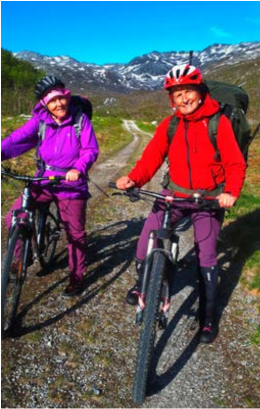
Retur med sykkel