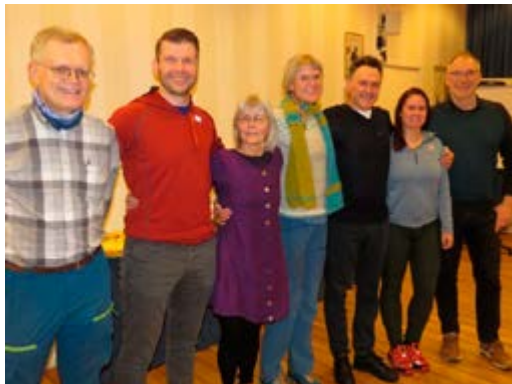
Det nye styret i TT 2020.

Styreleder la fram hyggelige tall vedrørende drift av TT: Total dugnadsinnsats har