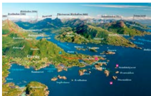
Guvåghytta ligger godt skjermet ute på Oksnesan