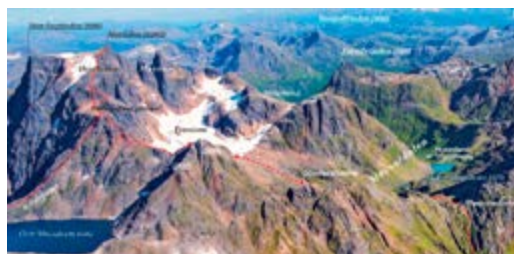
Normalruta opp på Møysalen, sett fra vest