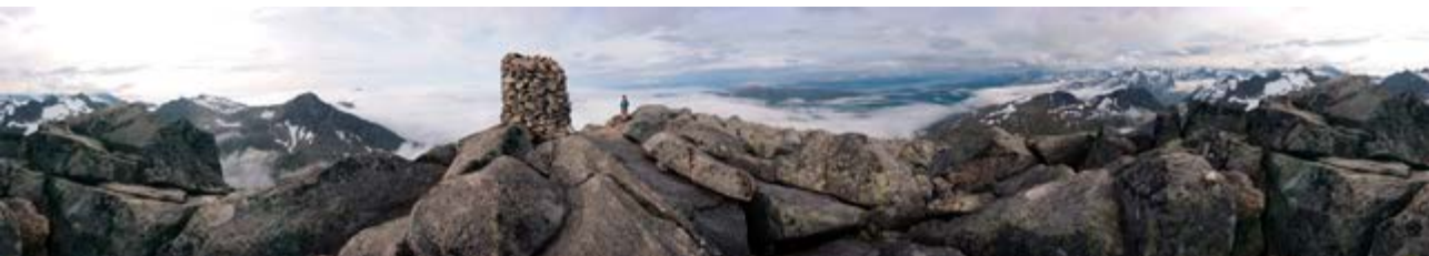
Panorama fra toppen

Store Blåmann er ett av Tromsøs mest populære turmål sommerstid. Med sine 1044 meter over havet er fjellet det høyeste på Kvaløya. Dagens offisielle rute går fra Slettneset, men det går også en sti fra Gårdelvnaset, som ifølge flere kilder er den gamle stien. Rutas startpunkt ble flytta fra Gårdelvnaset til Slettneset antakelig en gang på 90-tallet, og ble da merket opp med enkel rødmerking organisert av Jarle Nilsen. Da den nederste delen av ruta måtte gå gjennom noen myrområder, ble det kloppet over de våteste områdene.