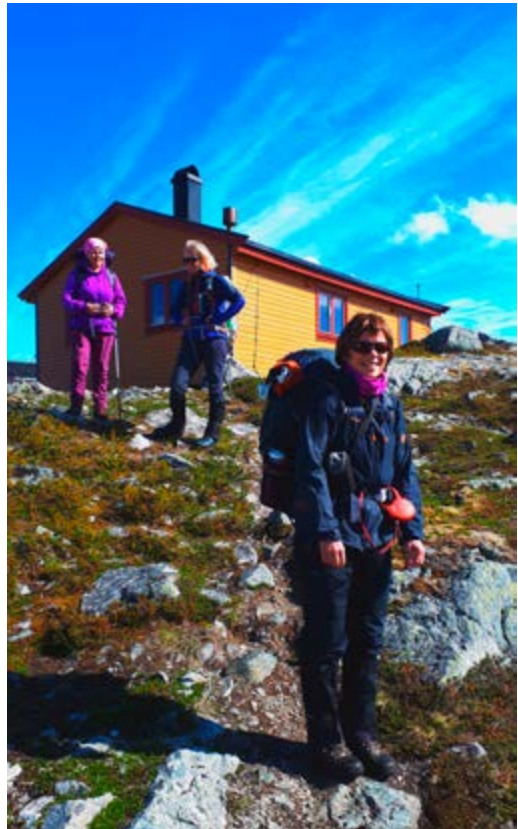
Hjemtur etter endt dugnad-dugnadsjengen

Turen opp og ned kan også varieres ved å gå opp til Tennvatnet og fortsette over