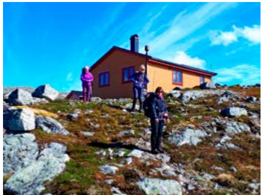
Dugnadsgjengen på vei hjem.