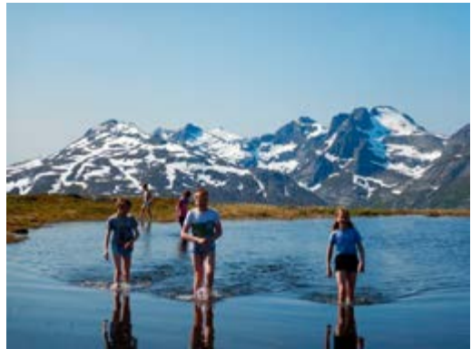
3 topper på en dag