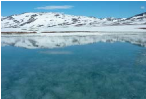
Vannet flommer utover isen

Dagene som fulgte var milde. Med sol, overskyet og plussgrader om nettene. Det blågrønne feltet oppe i bakken, der bekken som renner forbi hyttene kom til syne, ble større og større og kom stadig nedover. Snart var bekkefaret med blågrønn sørpe mange steder sikkert 100 meter bredt. Det var spesielt å se hvor vatnet tok snarreste vegen nedover. Dette året gikk den omtrent i sin helhet øst for den nakne tomte etter gamle Dærta (Var den revet samme året, tidligere på vinteren?). Det var lett å se at gam-