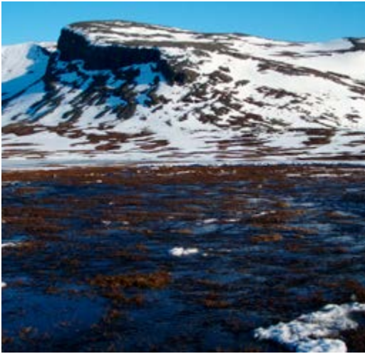
Her forsvant snøen med vannet som kom sigende

melhytta år om annet var blitt stående i veien for flommen. Mengden med snø i og rundt bekkefarene samt hardheten av denne, er det som styrer hvor flombekken havner. Men det var ennå ikke bevegelser i snøen, bare vatn som farget og mettete den.