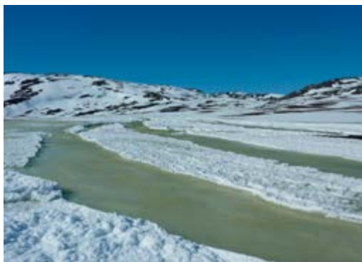
Det ble ikke slutt på vanntilførselen