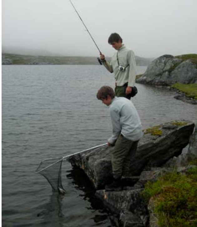
Landing av fisk på Kvænangsvidda

På Vuomajavri, som nok er mitt favorittfiskevann mht fjellfiske, har jeg på vei inn dit opplevd å møte isfiskere med stjerner i øynene og tunge bærer på vei ut av Anjavassdalen rundt St. Hans. Mange forteller om tynn is, ideelle forhold for kikkefiske, mye stor og aktiv fisk - men det er ikke alltid at den uregelmelige røya er like bitevillig. Vel framme og full av forventning rigges fiskestanga. Jeg rusler full av forventning ned til vannkanten, ser etter vak og tar et langt kast med en sildesluk. Fisket er i gang. Å fiske på denne, mens de siste dristige isfiskere ligger et steinkast unna på liggeunderlag på skjør is er helt spesielt. Lyden av smeltende nåleis blandes med lyden av ender og andre fugler. Det er heftig når Vuoma spiller opp til dans!