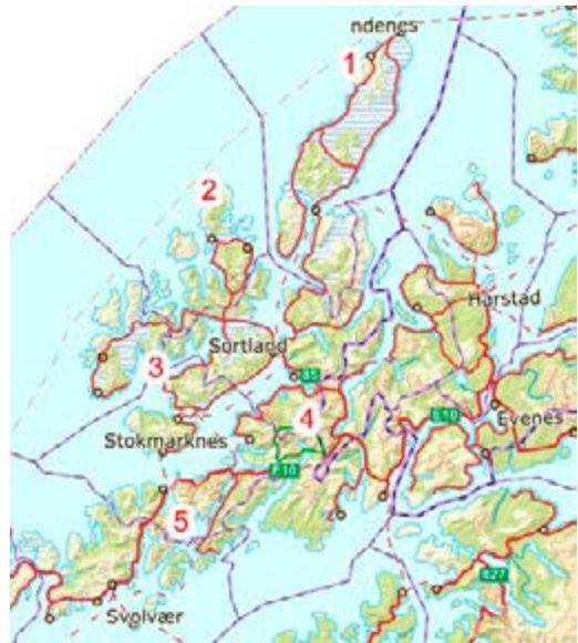
Vesterålen med turmålene inntegnet

illustrerte boka kan kjøpes på Bokhuset Libris i Tromsø eller via https://vesteralen.dnt.no/utgivelser/ .