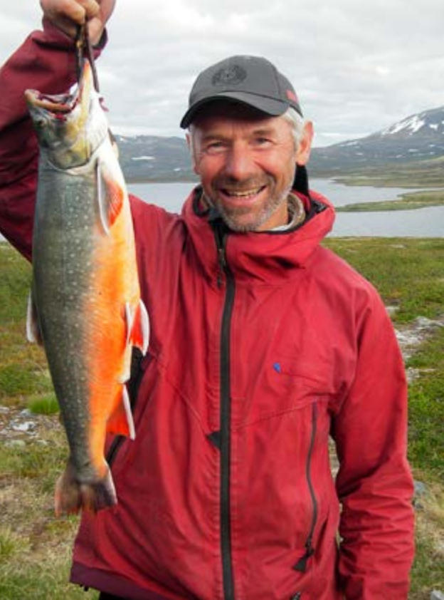
Artikkelforfatteren med Vuomarøye 3,18 kg

elvfiske fant sted i Rostaelva i St. Hanstida for over 20 år siden, flere kilometer innenfor Rostahyttene. Rostaelva gikk flomstor. Jeg hadde fisket hele natta i Måskanjavri uten hell og fisket meg ned langs Rostaelva. I et djupt elvejuv gikk elva frådende mellom klip-pene. Eneste sted det var mulig å fiske var fra et berg 6-7 m over elvenivå. En rød-kvit Andersdubb med makk kastes ut i elva. Jeg har ikke stor tro på fisk. Etter flere kast der dubb og makk danser hjelpeløst rundt i strømskavler, virvler og inn i bakevjer innunder berget, skjer dette: Plutselig forsvinner dubben under vann og blir borte! Full skjerpings! Snøret strammes til og jeg gir tilslag. Kjenner straks at det er noe tungt i andre enden av snøret. Kraftige, tunge napp og risting. Definitivt ikke bunn-napp. Det blir en langvarig og spennende kamp der fisken trekker snøret under utstikkende bergnabber i strømmen, men heldigvis – snøret ryker ikke. Fisken går dypt og viser seg