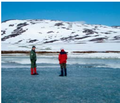
Et fantastisk skue mens sørpa kom sigende