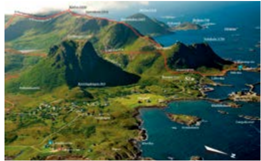
Stø er et av endepunktene for Dronningruta i Øksnes

Boka «På tur i Vesterålen og Lødingen» anbefales varmt for videre lesning. Den rikt