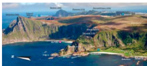
Måtinden på Andøya