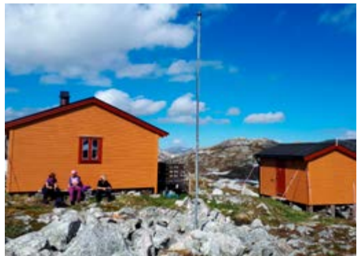
Pause i solveggen etter endt dugnad.