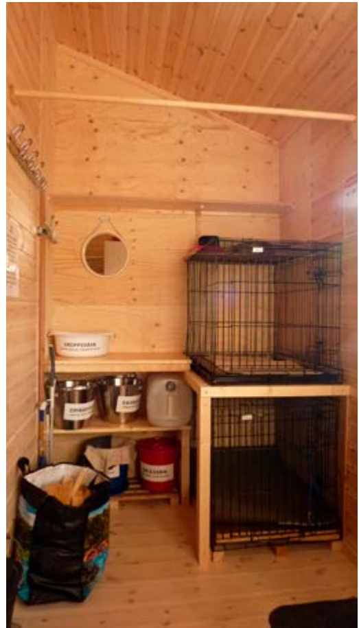
Fra hundeannekset på Vuoma: Her er plass til to hunda i hvert sitt store bur.