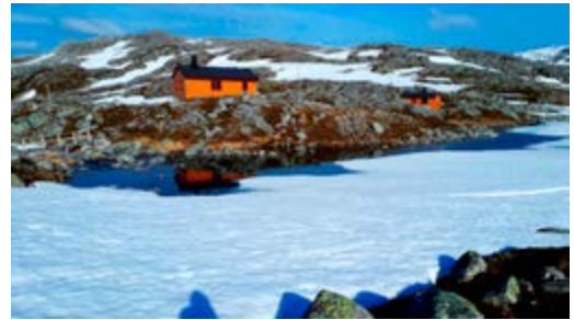
Ringvassbu speiler seg i vannet

Fra Simavika går vi opp Ytredalen, krysser elva like nedenfor demningen og langs øvre Langvann, over Simavikeidet og mellom øvre og nedre Langryggvatna. Er du heldig kan du få hilse på Norges nasjonalfugl fossekallen underveis. Veien opp fra Simavika følger anleggsvei i 4 km og det gir anledning til å bruke sykkel. Returen kan