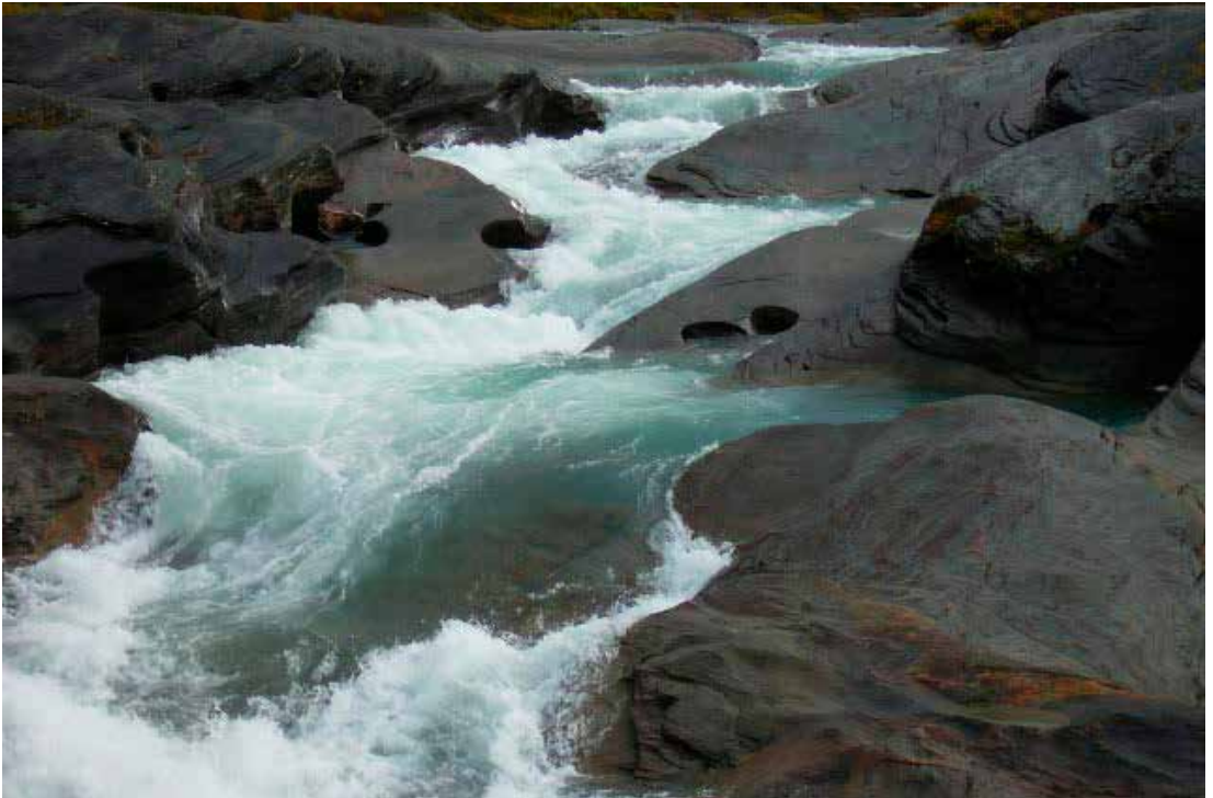
Vannets uendelige sliping på berg skaper de flotteste jettegryter.

Den varslede stormen kom om natta, og vi fikk den midt i mot dagen etter på turen til Staddajåkkka.