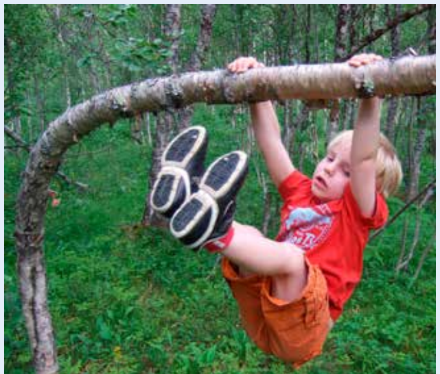
Naturen som gymsal.