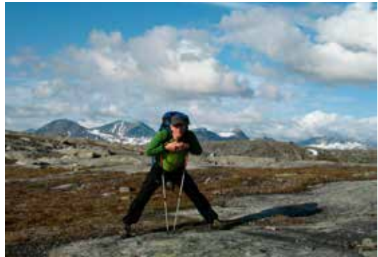
Oppe på høyfjellsplatået mellom vegen og Skoatdejavrehyttene.

Dagsturen vår starter ved vegenden i Norddalen. Vi har planlagt en rundtur og starter opp gjennom Steindalen. Det er sommer og varmt, lett å gå og utsikten er topp. Vi ser tilbake på Storsteinsfjellet som har flere spisse topper og en krittkvit isbre. Den høyeste toppen er den tredje høyeste i Nord-Norge (1891). Vi passerer en annen bre og flere høye topper, som ligger på vestsida av dalen. Den høyeste toppen er over 1700 moh, to andre er over