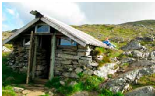
Som alle de andre hyttene til Troms Turlag er Steinbøhytta et resultat av god dugnadsinnsats.