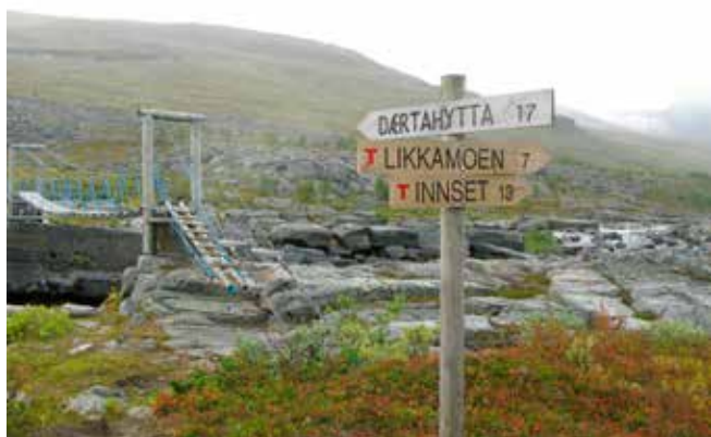
Takket være Jarle Nilsen er turløypene til Troms Turlag godt skiltet.

Jarles entusiasme og engasjement under turplanleg-