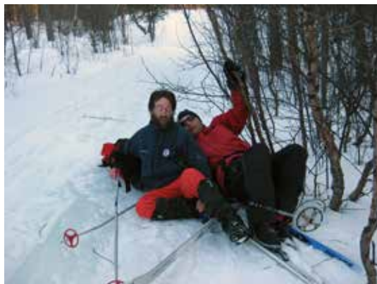
Utilsiktet nærkontakt.