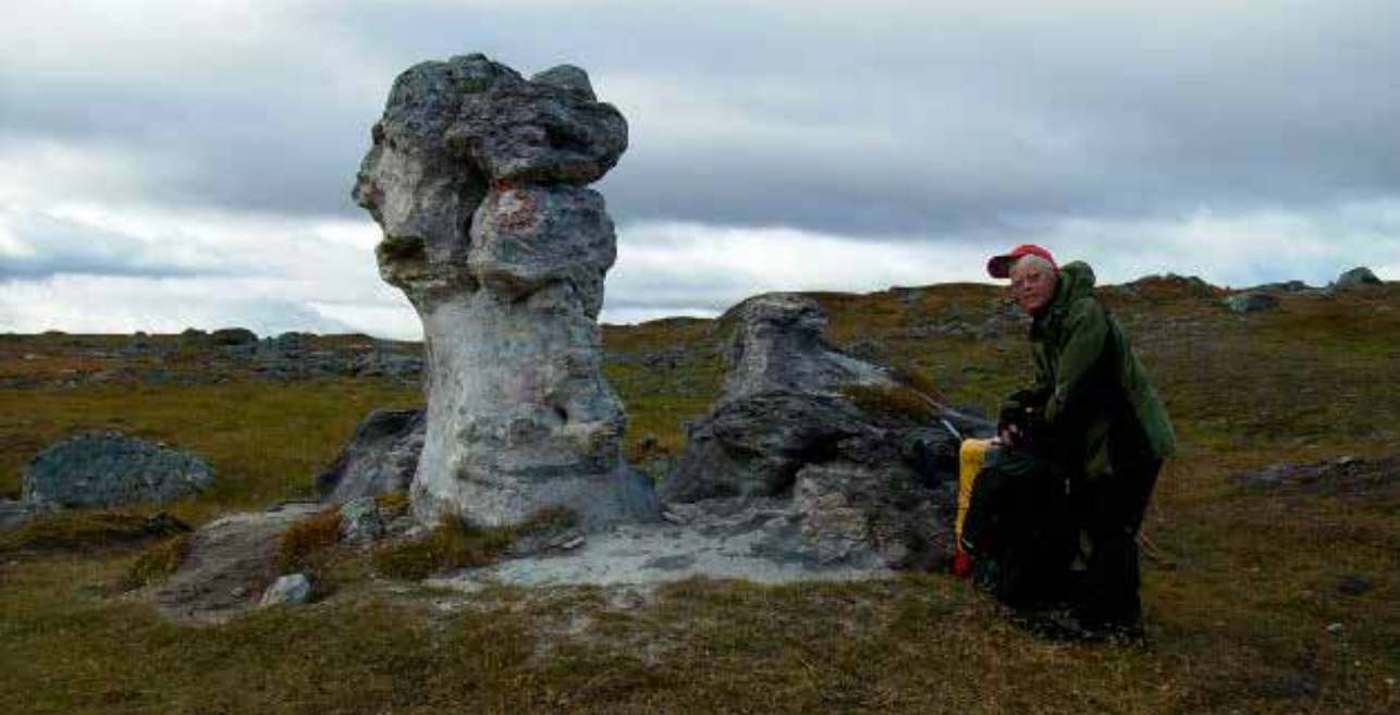
Merkelig steinfigur mellom Kutjavre og Arasloukta.

Planen var å gå fram til Sårjåshytta på svensk side av Sårjåsvatnet, men vi måtte søke tilflukt i Staddajåkkastugan, ikke mulig å gå utafør døra da vi først var kommet innafør.