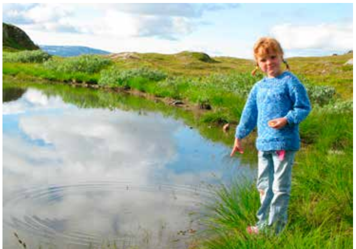
Ved Fløya: Vann er spennende!

Når du ser på symbolene for turene til Troms Turlag og de samme symbolene for turene til FSG, vil en tur definert med likt antall stjerner og kupering være mer krevende på en FSG-tur enn en turlagstur. FSG vil på en del av sine turer ha symboler for evt. sikringsutstyr som er nødvendig.