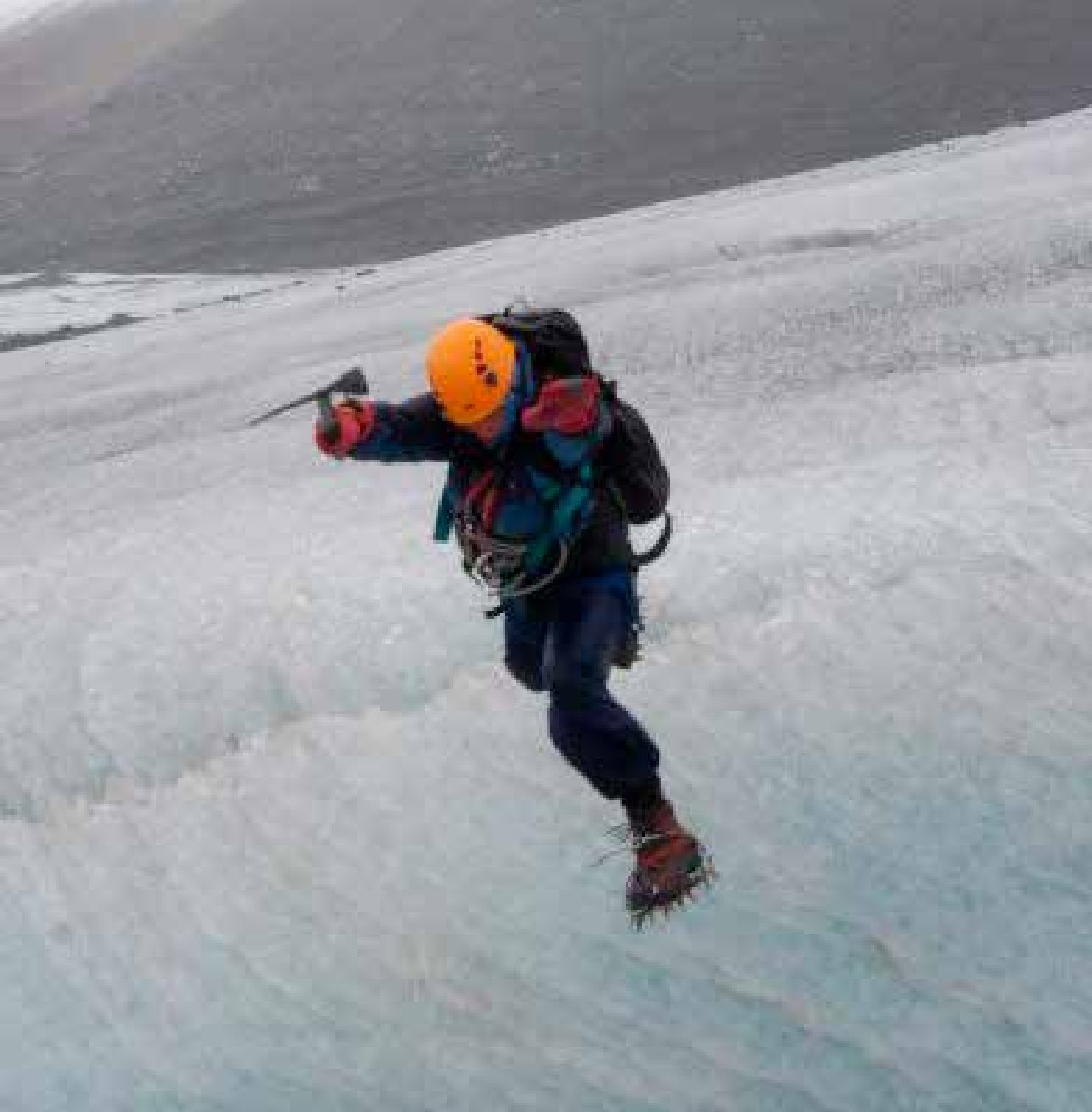
Full konsentrasjon på Steindalsbreen.

Med å melde seg inn i Troms Turlag får man en ypperlig mulighet til å bli kjent med nærmiljøet i og rundt Tromsø. Man blir lettere introdusert for nye turer og utfordringer i naturen gjennom DNTung. Det er gøy og motiverende å være sammen med ungdom på sin egen alder med de samme interessene. DNT ung arrangerer turer av forskjellig utfordringsgrad, og man trenger ikke være toppidretts-