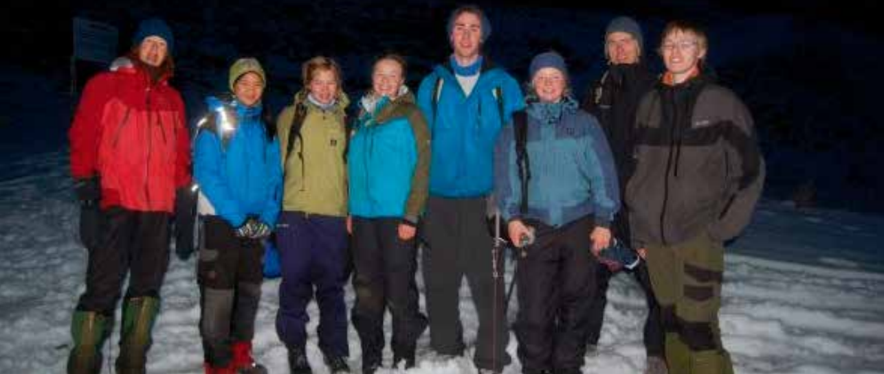
DNT ung på mørketidstur i Simavika.