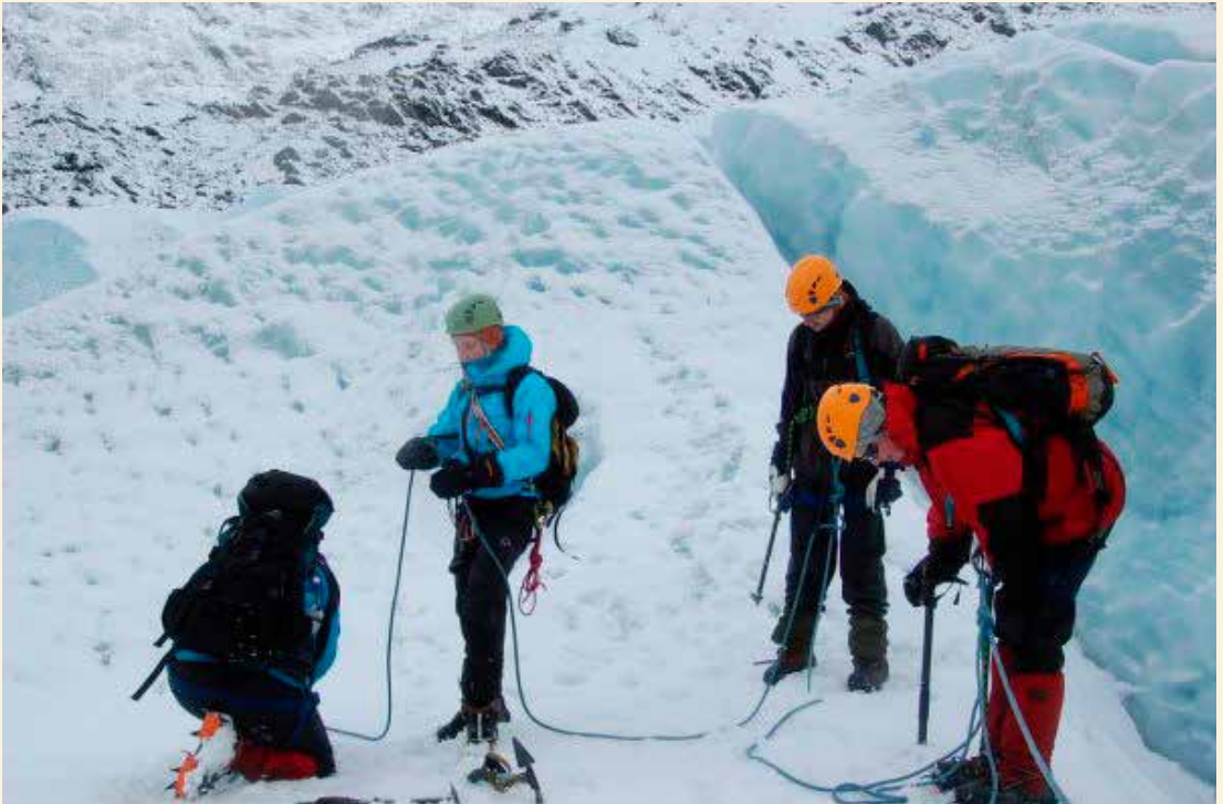
Bretur på Steindalsbreen.

Av Thea Konstanse B. Isaksen, leder i DNT ung, Tromsø