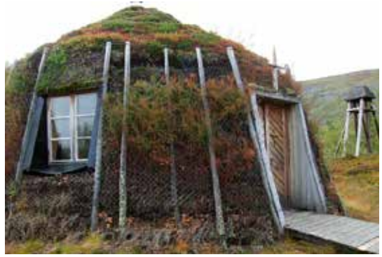
Kyrkkåtan ved Vaisaluokta.

Vår vert hadde det travelt med å komme tidlig av gårde neste dag. Da skulle siste båt for sesongen innom Vaisaluokta, den måtte han rekke. (Akkajavre er ikke en pytt å rusle rundt). Derfor var vi tidlig på vandring neste dag med Låddejåkka som mål. Før vi forlot fikk vi med oss værmeldinga fra stugverten. Det var varslet storm i fjellet onsdag og torsdag. Greit å vite.