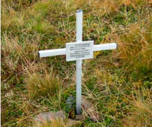
Polack eller ryss.

I Arasluokta skulle vi kun ha et kort matstopp, dagens mål var Stallolukta. Vi håpet å komme dit før den varslede stormen. Ved Arasluoktastugan