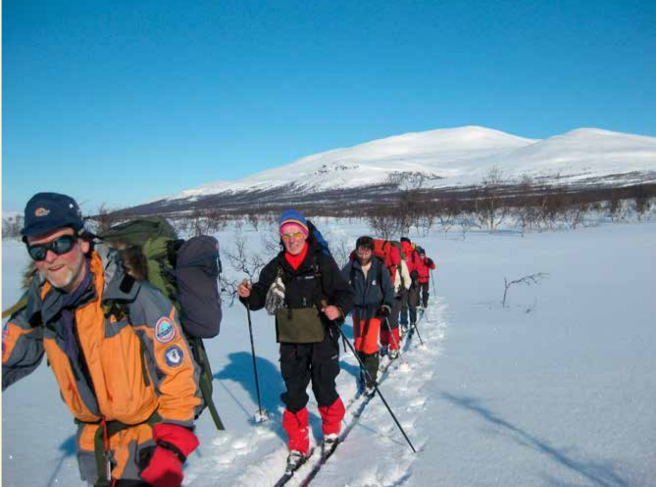
På tur fra Havga mot Storskogmoen.