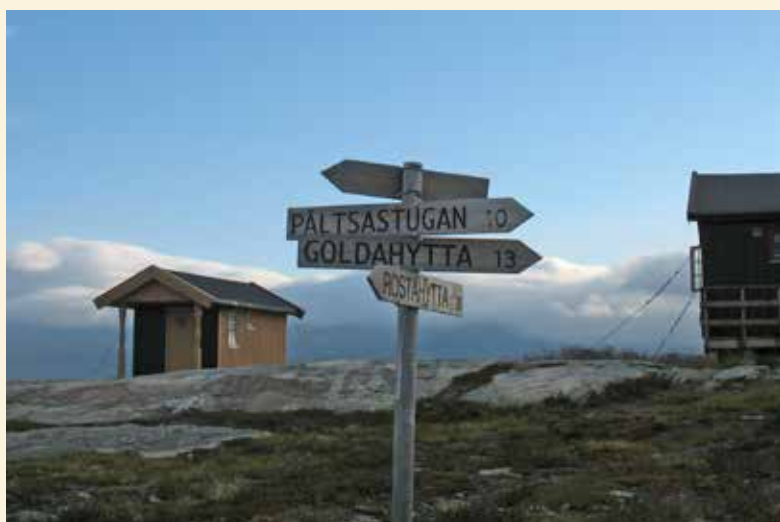
Hundehytta på Gappo.