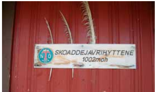
Skoatdejavrehytta er en av de høyest beliggende av NOT sine hytter.

1600 moh. Fjellene er delvis svabergaktige, flotte å se på og lette å gå. Vegetasjonen er karrig, men isolleier er det mye av.