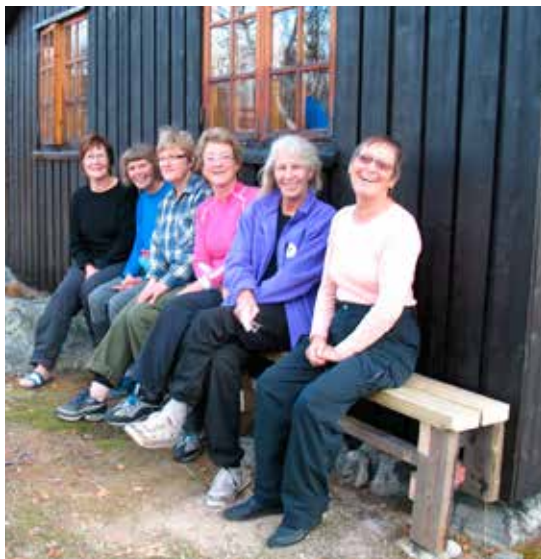
Innvieelse av nysnekret benk på Golda.