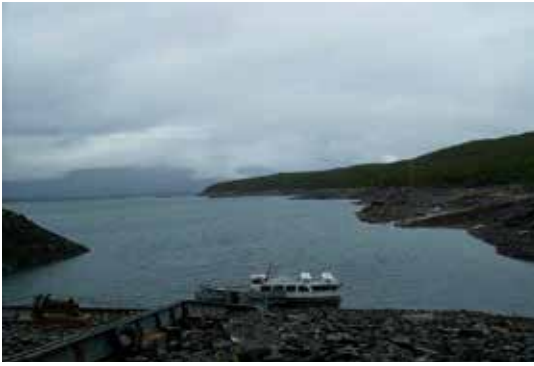
Båt over Akkajavre.

Stugan var ikke forlatt, ei trivelig dame ønsket velkommen. Hun hadde gjort klart til å forlate dagen etter, og sa at hyttene stenger fordi elgjakta starter 6. september. Dama fortalte at mange nordmenn var innom, men de hadde det SÅ travelt, «dom går någet på langs». Vi så dem seinere i hyttbøkene der de kalte seg «NPL'ere», Norge på langs.