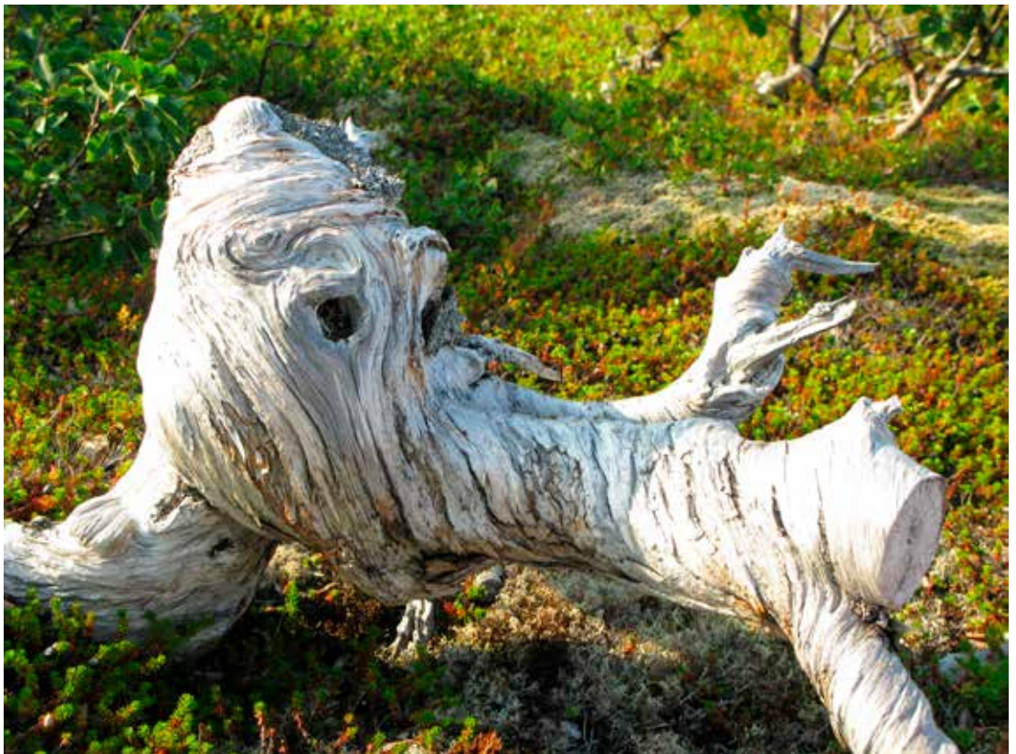
Ikke vær nesevis!