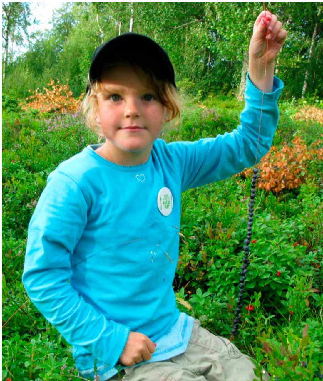
På tur med Turbo kan man også plukke deilige blåbær og tre på strå.

HOS OSS FINNER DU ALT AV TURUTSTYR OG BEKLEDNING SOM DU TRENGER TIL TUREN – OGSÅ UMLEIE AV HYTTENØKKELE TIL MEDLEMMENE.