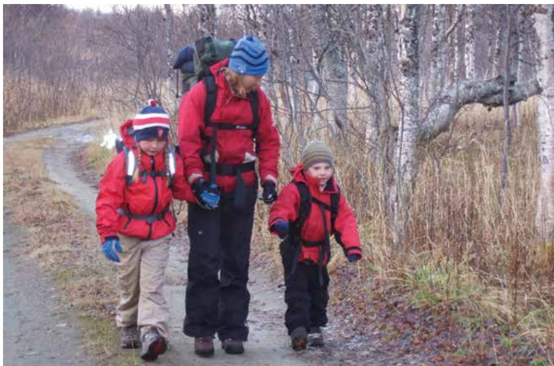
Vi gleder oss til turen.

Ungdommene selv bestemmer turene sine. De vil ha et møte i mai og planlegge aktivitetene for sommeren/høsten. Du som er interessert, følg med på Troms Turlags hjemmeside www.turistforeningen.no/tromsturlag og se hvilke turer som byr seg.