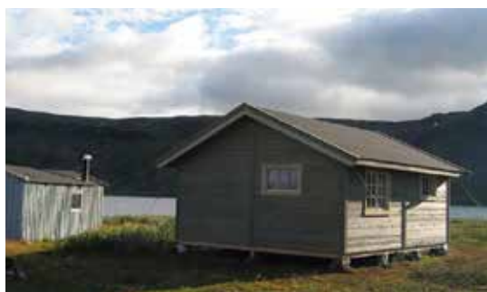
Nye og gamle hytta ved Storrosta.