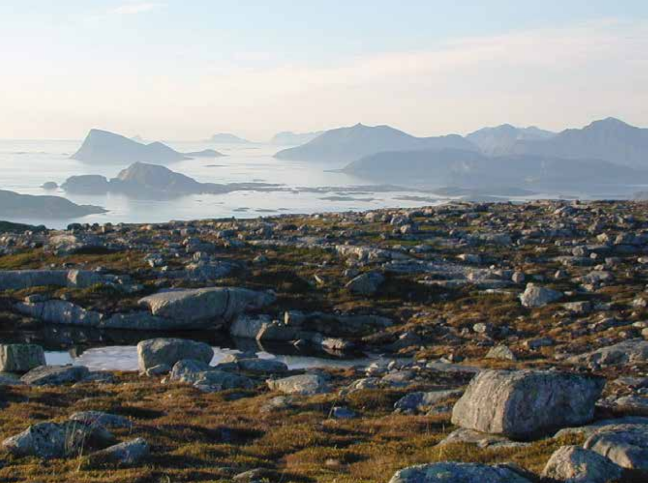
Utsikten nordover fra Kvannaksla på tur opp til Astritind.