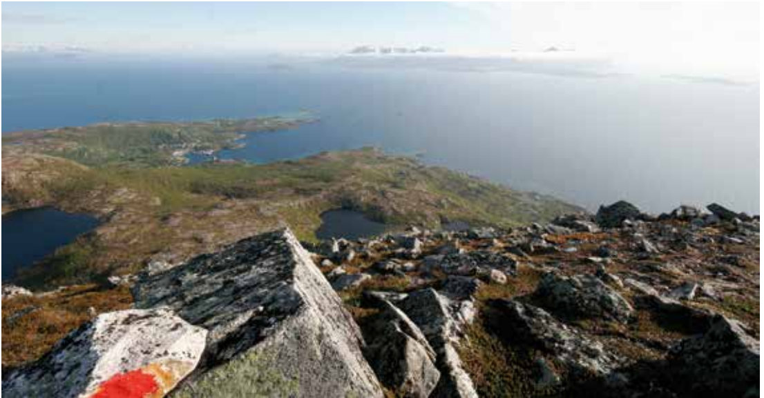
Utsikt fra Sjursviktindan og ned mot Storvatnet og Skrolsvik.