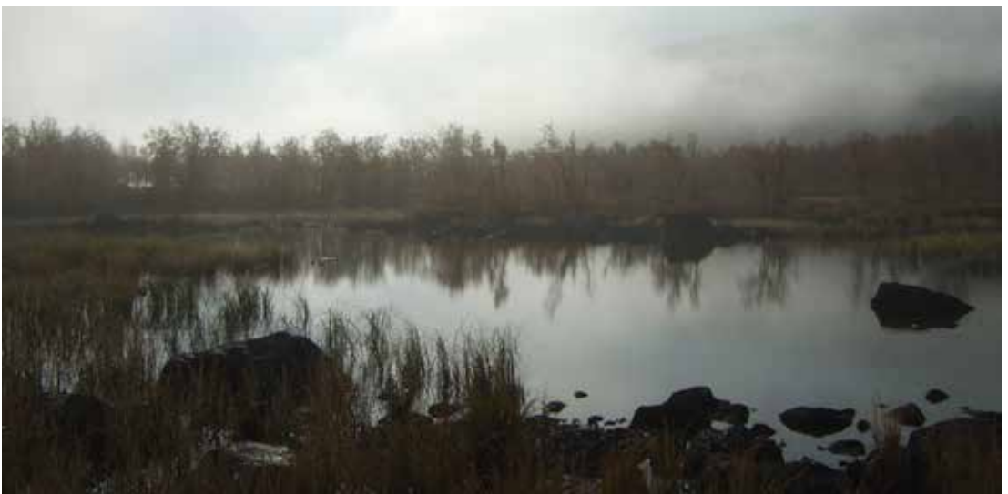
Stemningsfullt i tåka.

Takk for praten og vi ønsker deg lykke til med ditt nye verv!