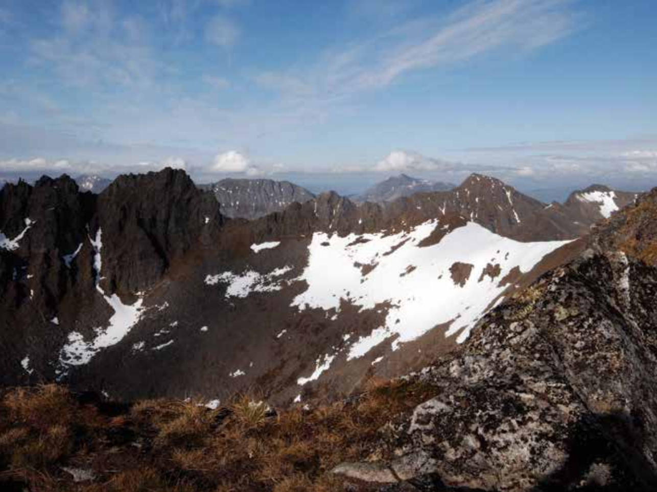
Utsikt mot fjella i nordøst, Senjehesten og Manen.

Fra vatnet går stien opp til en slak rygg før den deretter fortsetter til toppen. Stien er bratt, men god å gå. Slitet med å nå toppen blir rikelig belønnet. Utsikten er spektakulær.