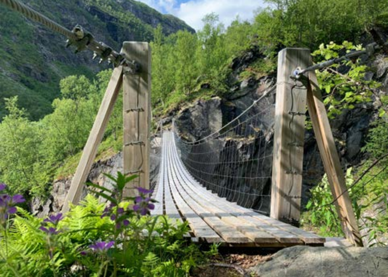
Hengebrua over Kjelelva

fjellrype i nasjonalparken, i tillegg til elg. Stordalen bak selve fjellet Rohkunborri er et populært område for isfiske på vårvinteren og nås enkelt på ski fra skuterparkeringa i Storbukta.