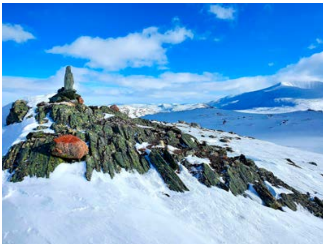
Blåfjellet, Øvre Dividalen nasjonalpark.

Forsida: Skitur på Fagerfjellet.