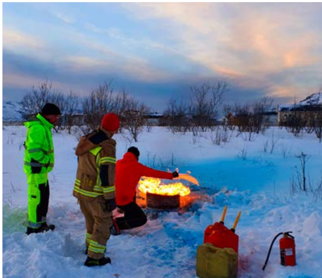
Testing av brannteppe

Praktiske brannøvelser med slokking av brann foregikk utendørs. Det ble demonstrert slokking med brannslukkeapparat, samt bruk av spraybokser og brann-teppe. Alle fikk sjanse til å prøve seg på alle de tre forskjellige slökkemidlene. Det ble et nyttig og fint avbrekk fra kursrommet, hvor vi også fikk gleden av et kort møte med sola. Som hyttetilsyn er det viktig å etablere gode sjekkrutiner med tanke på forebyggende brannvern. Jevnlig sjekk av vedovn og gassapparat, snu og rist brannslukkingsapparatet, sjekke røykvarslerne og ha brannteppe tilgjengelig.