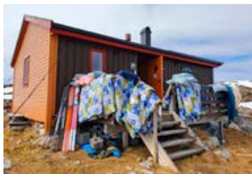
Rundvask på Ringvassbu.