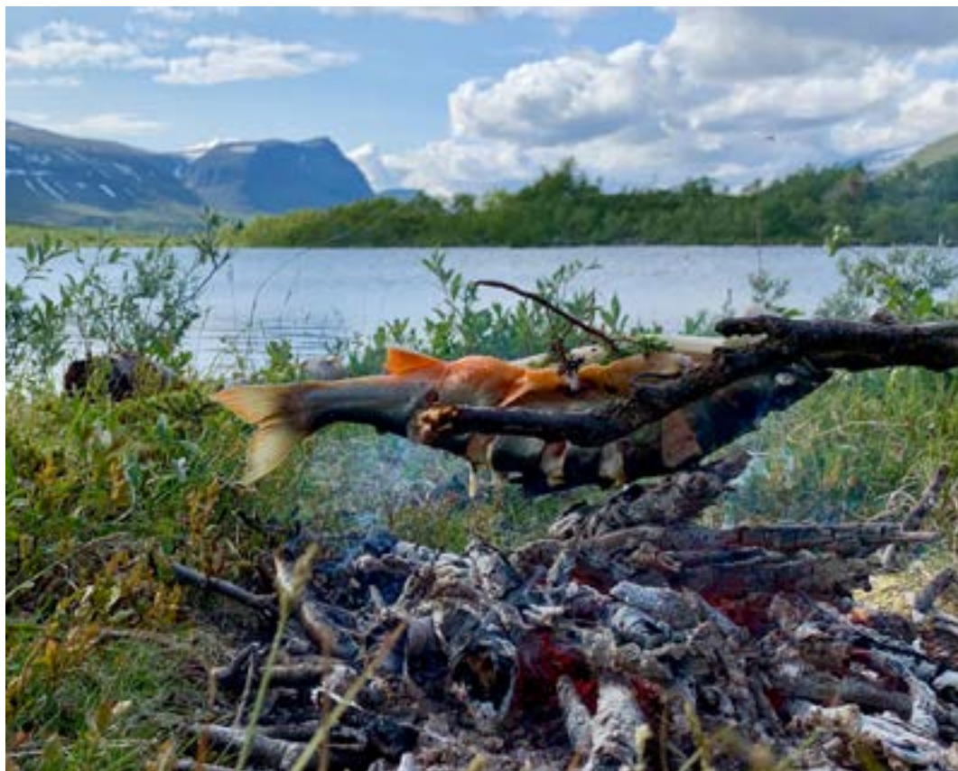
Eartebeal røye: Sommeridyll ved Eartebealjávri

nasjonalparken ligger det mektige fjellmassivet Rohkunborri, omkranset av skogkledde daler, alpine våtmarker og innsjøen Geavdnjajávri. I tillegg til den storslåtte naturen, er Rohkunborri leveområde for de store rovdyrene jerv, gaupe og bjørn. Kongeørn, fjellvåk, jaktfalk og tårnfalk hekker her. Nasjonalparken har store verneverdier knyttet til våtmarker både i bjørkeskogen og alpine våtmarker på rik berggrunn. I Sør-dalskløfta og Jordbruvassdraget er det naturlige fisketomme vann. Dette gir blant annet gode forekomster av krepsdyr som er viktig for fjellender som svartand, havelle, sjøorre og bergand.