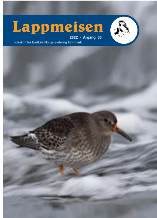
Medlemsbladet til BirdLife Finnmark

Tolv års forskning viser interessante resultater. Fjellvåkene som velger å hekke i Norge på sommeren, trekker om høsten på bred front til Øst-Europa, spesielt til Russland, Ukraina og Belarus, men også til andre land i regionen. Og noen få individer velger også Danmark og Sverige. Her kan de være sta-