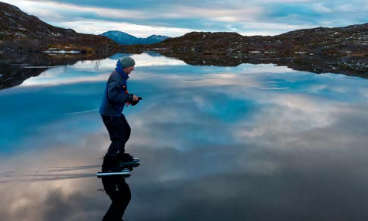
På Tennvatnet. Det var overvatn og moro med himmel over og himmel under

tynn is skal men heller ikke holde høy fart. Isen kan begynne å gynte eller bølge - og dermed svikte. Begynner isen å sprekke rundt skøytene er den tynnere enn 5 cm. De færreste finner det fristene når isen knaker og synger «bakom . . . skogene» i takt med skøyteskjærene. Når isen er tynn skal man ikke bli stående for lenge på et sted, og heller ikke samles i flokk.