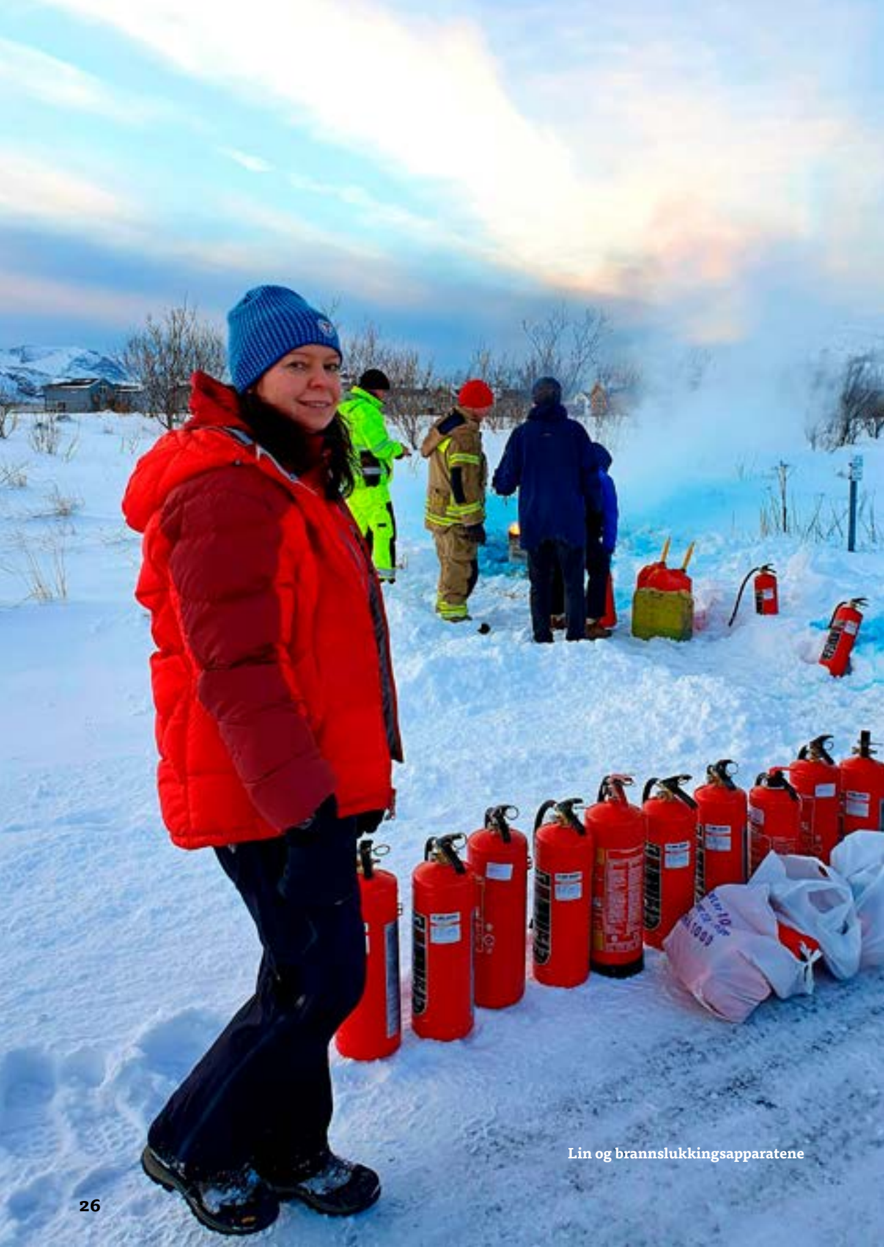
Lin og brannslukningsapparatene