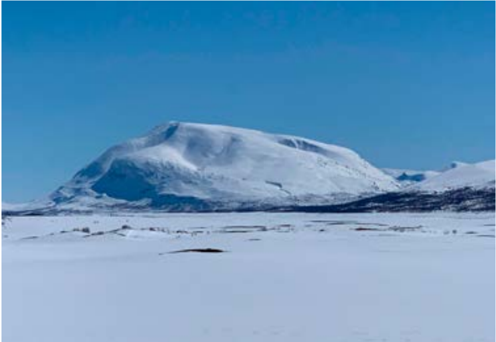
Rohkunborri sett fra nordsida av Altevattnet. Stordalen like til høyre for selve fjellet, lettgått skitur til gode fiskevann.