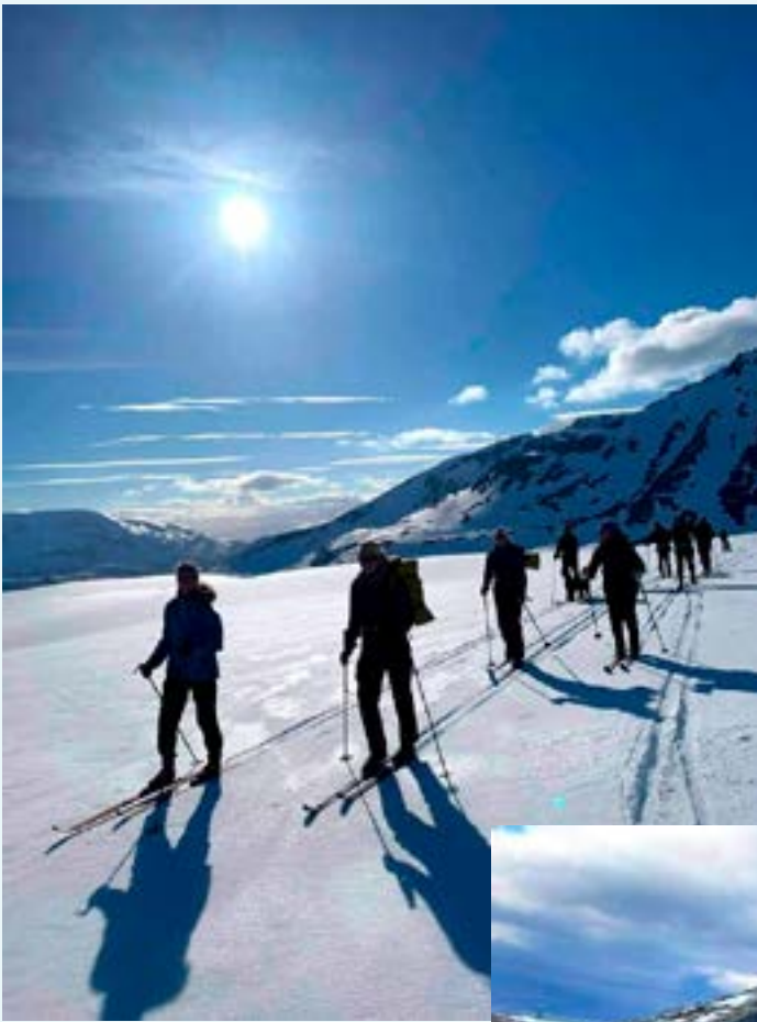
Gruppen i fint driv