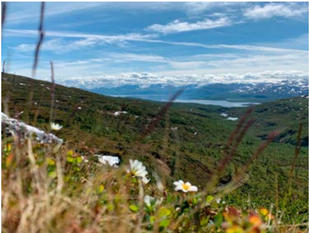
Lapporten i det fjerne