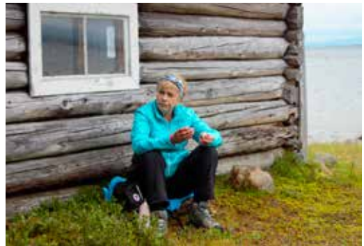
Godt med en hvil.