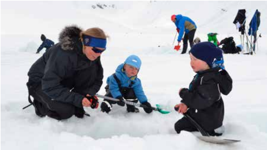
Mor og barn i fiske. Trollvatnet.