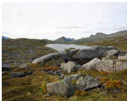
Ranaksla. Utsikt mot yttersida og Husfjellet.

Tur 5: Turen til Svanfjellene vil være en svært lang dagstur fra hytta. Har du egen