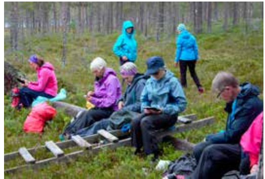
Vi roer ned og koser oss.