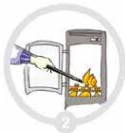
2 Tenn fra toppen