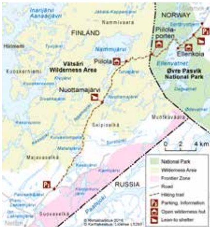
Kart over Pillolaleden.