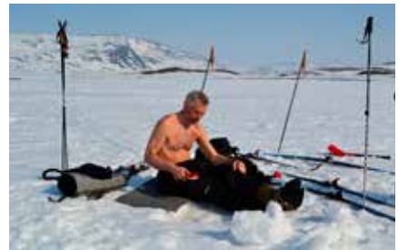
Artikkelforfatteren på Vuoma en godværsdag i mai.

av fullmåne. En ting er sikkert – fjellfisken er lunefull og bettet kan variere betydelig. Det gjelder å være på rette plass til rette tid.