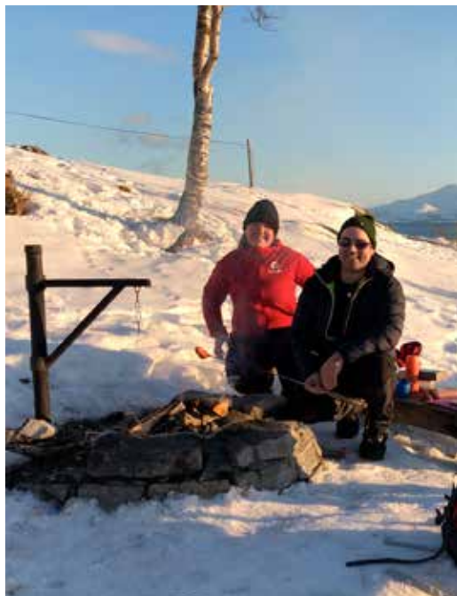
Snart vår – bålturn i Telegrafbukta.