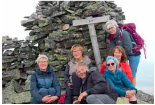
De «spreke» på toppen Store-Svuku.

Av Solveig Kjerran, Åsmund Kaspersen og Bjørnar Seljehaug