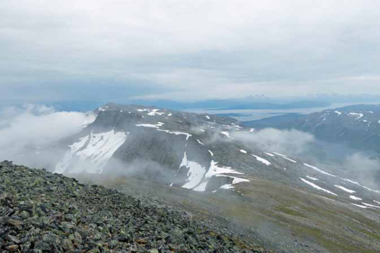
Utsikt fra Tredjefjellet og sørøstover mot Andrefjellet og Solbergfjorden. Kapervatnet til høyre på bildet.