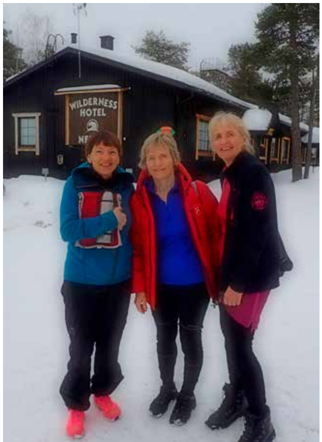
Turfølget fremme i sivilisasjonen.