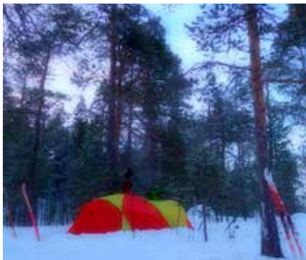
Teltleir i skogen.