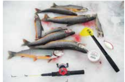
Fiskeutstyr og fangst. Rundvatnet i Skaktardalen.