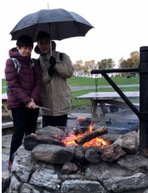
Turister fikk pølse, null nordlys.