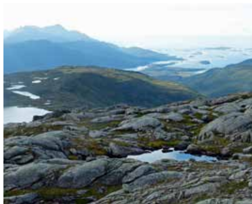
Bratthaugen. Senjabu ligger ved vatnet midt i bildet.

Tur 2: Fra Senjabu, følg «Senja på langs»-merkinga over myrene i sørvestlig retning, ta av fra stien ved første litt større bekk (før