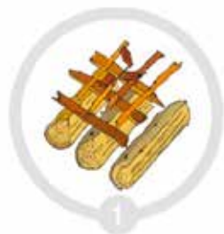
1 Bygg bålet riktig