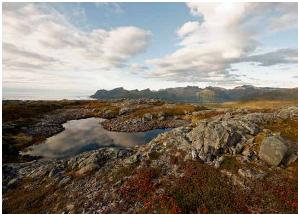
Barstindkneet utafor Senjabu.

Trondalselva), gå sørover og opp til 344 moh. Her får du flott utsikt over Svandalen.