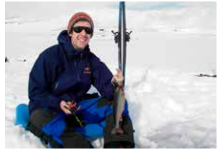
Glad isfisker på Vuoma.