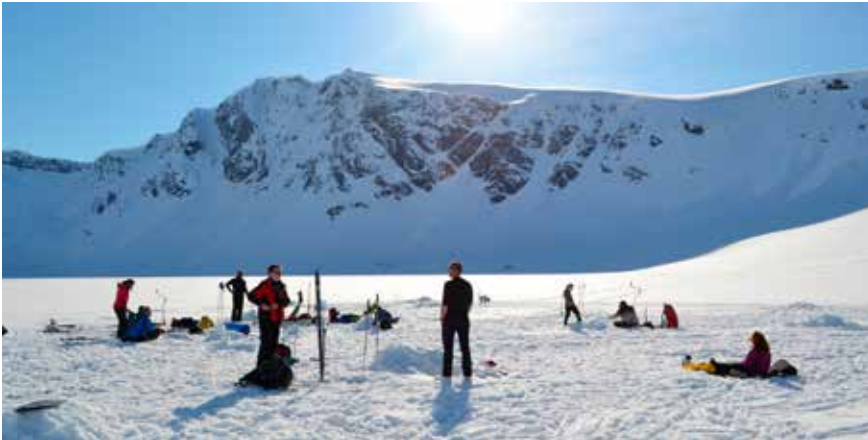
Isfiske på Trollvatnet.