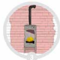
3 Sørg for nok luft