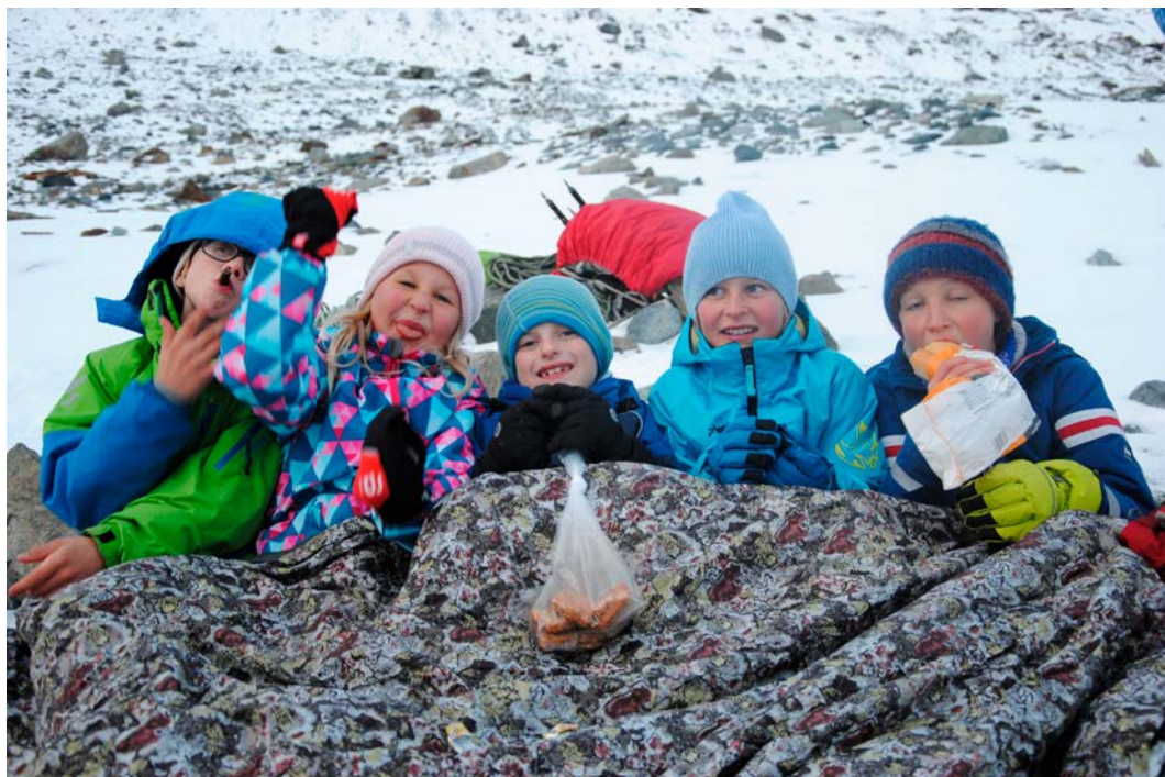
Fra breturen.