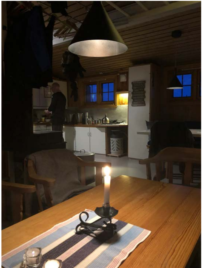
Gamle Gappo har fått solcellebelysning.

Det er ikke montert noen stikkontakter eller USB-uttak. Det vil eventuelt gjøres når vi vet om det er nok kapasitet på anlegget. Sørg for egne batterier til hodelykter og elektronisk utstyr du har med.