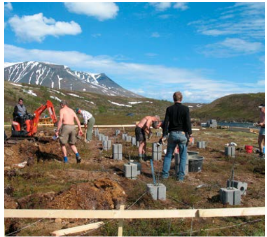
Grunnsteinene snart på plass

ansvarlig byggeleder. Dugnadsviljen var formidabel. Frivillige dro til fjells på fredagskvelden, jobbet 35-40 timer og dro heim søndagskvelden.