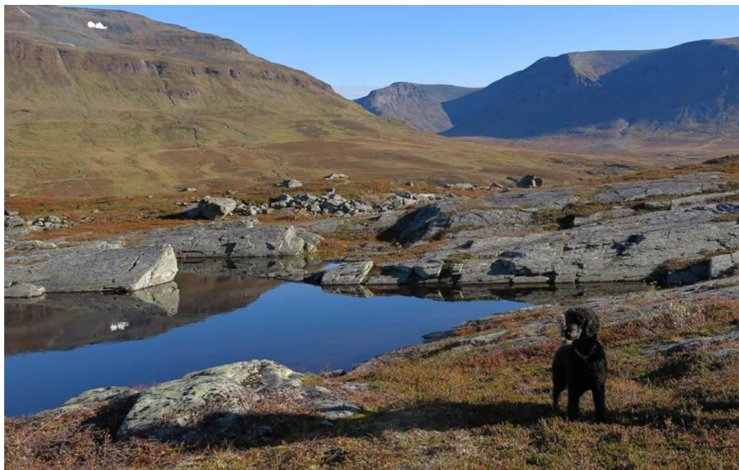
Mot Isdalen og Moskángáisi

av at den er en av de mest besøkte hyttene til TT. Den er mye benytta av barnefamilier, og skoleklasser kan booke seg inn. Inntil vintersesongen 2016-17 var den vinterstengt. Fra nå av vil «annekset» være stengt i vintersesongen.