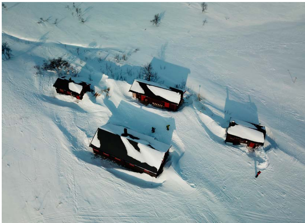
Oversiktsbilde vinter