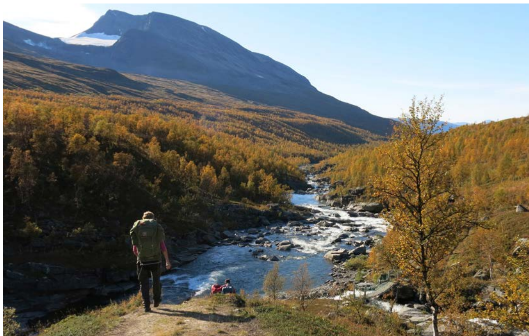
Rostadalen og Høgligga

fang og vedlager. Oppholdsdelen var delt i nesten to identiske rom med ovn, spise-plass, kjøkkenkrok og fire køyeplasser. Videre var det dør inn til neste avdeling som hadde de samme fasilitetene. Denne døra mellom de to rommene kunne låses av slik at tilsynet kunne ha det innerste rommet som «sitt» rom. I realiteten ble det da tilgjengelig bare fire brisker for vanlige hyttegjester som ville benytte hytta. Dette skapte stor misnøye blant publikum, og etter ganske kort tid ble det bestemt at det ikke skulle låses mellom de to rommene