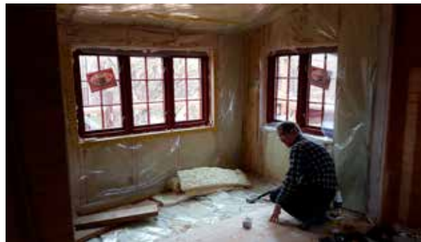
Gudmund Sundlisæter legger golv 15. september.