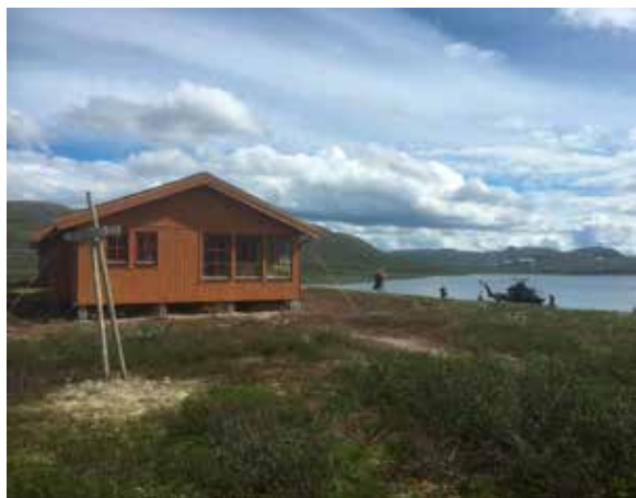
Nyeste Vuoma.