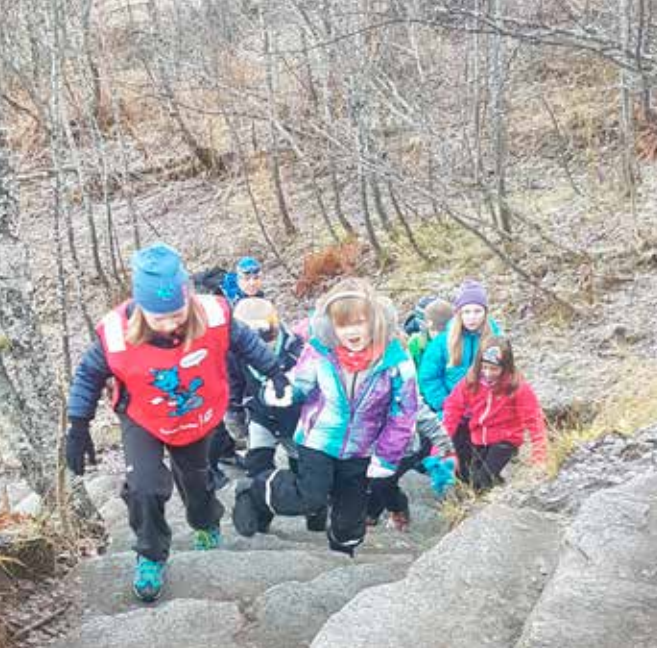
Sherpa-trappa opp til Fjellheisen