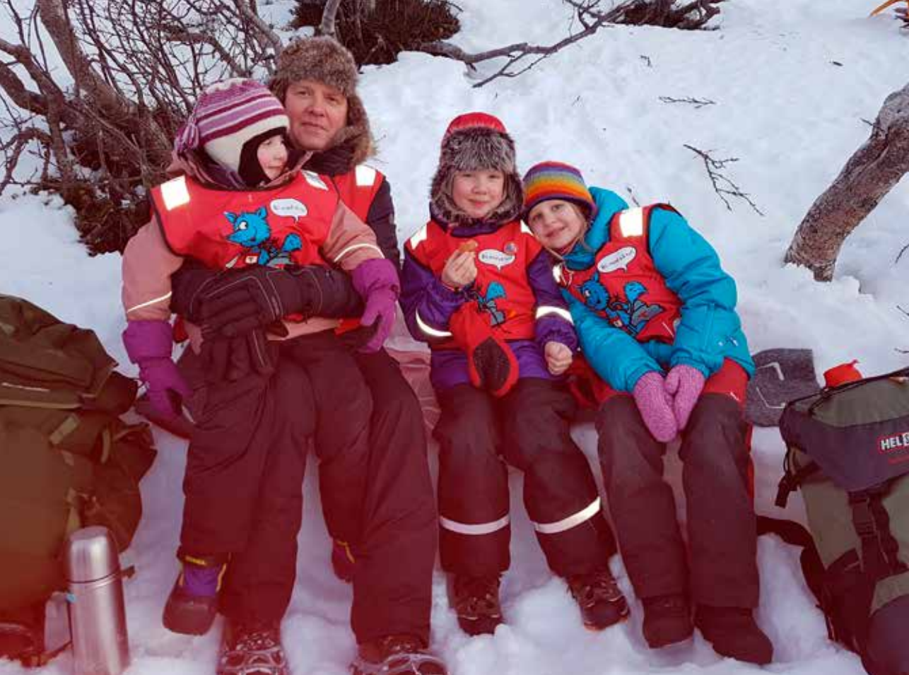
Kos for små og store.