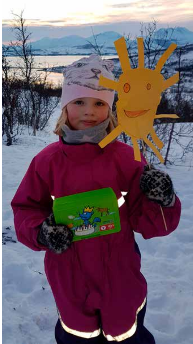
Det hjelper å mane fram sola.