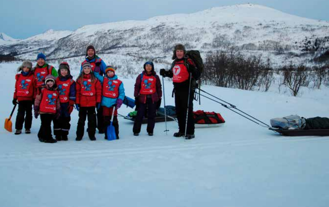
Gode hjelpere.

raskt bestemte seg for at det i første omgang bare skulle være solboller til barna.