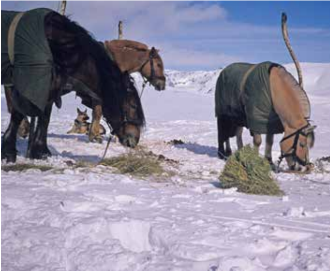
Kløvhest m Njunis i bakgrunnen