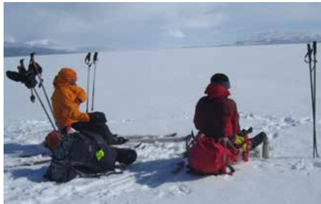
Matpause på Torneträsk

Vi vaknar til blå himmel og sol. Det er 25 kilometer til Sälkastugorna. Vi får sterk vind i stigninga opp mot skaret Tjåktjajattja, ca 1100 m.o.h., og det er godt med ei pause i vindskyddet. Nedkøyninga i Tjåktjadalen går med flotte svinger i mjuk pudder, Sälkastugorna skimtast i det fjerne. Nok ein triveleg stugvert tek i mot, vi får bo i den gamle hytta frå 1930-talet, den har sjel