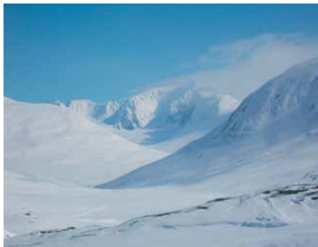
På veg mot Haukajavre. Kebnekaise i bakgrunnen.