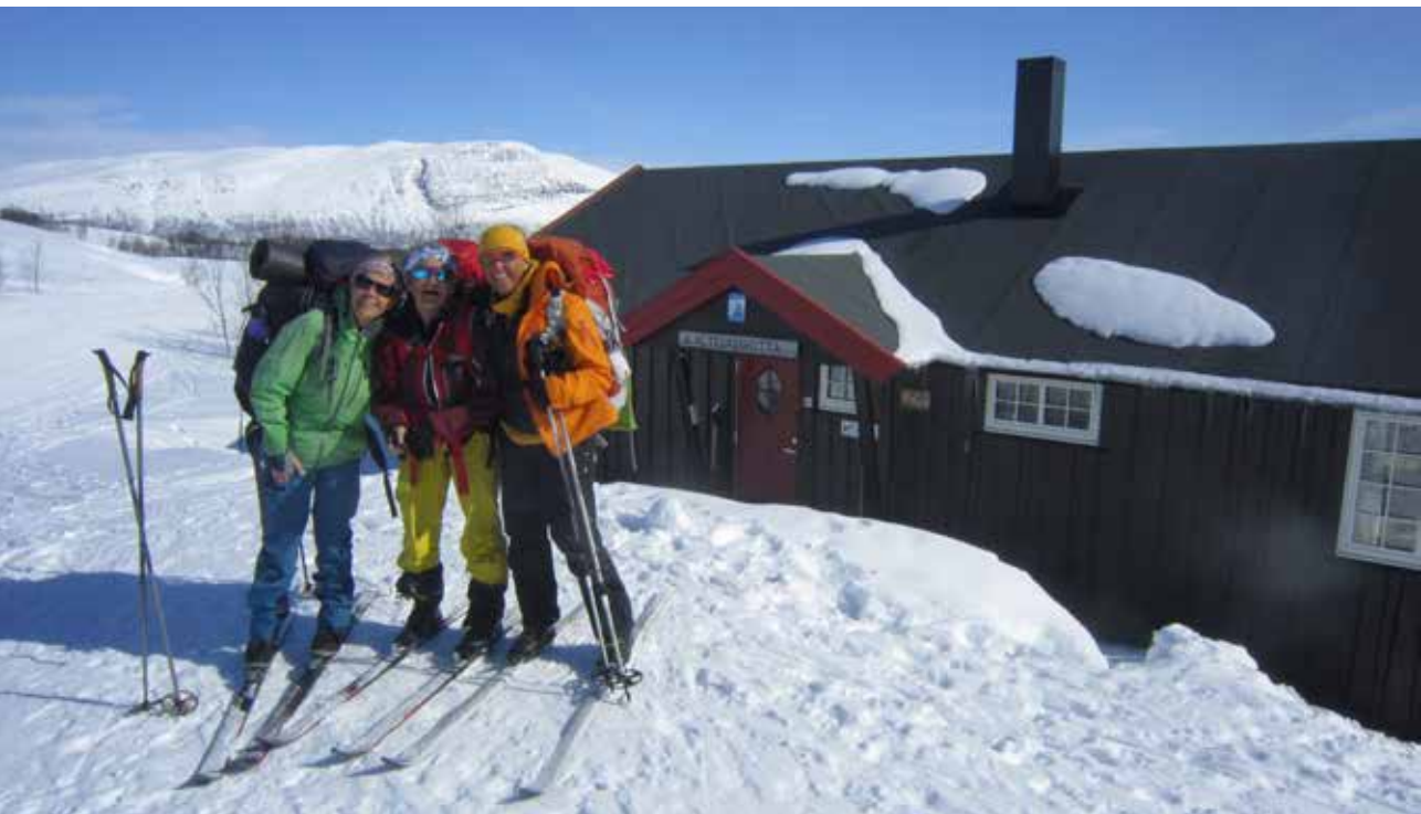
Avmarsj fra Altevasshytta

Tre gode turvenninner flyr til Bardufoss 17. april 2017 og får transport inn til Altevasshytta av ein god ven der nord. Sola skin, snøen er kald og fin. Framkomstmiddelet vårt er framleis ski, men i år utan pulk og telt. Vi vil leggje ruta på svensk side, gjennom Abisko, Sarek og Padjelanta, og der ligg hyttene tett i tett..