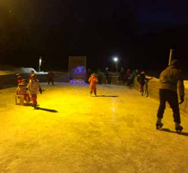
Fra skøytedisco.