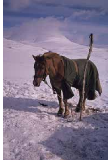
Kløvhester kviler ut etter en tung transport