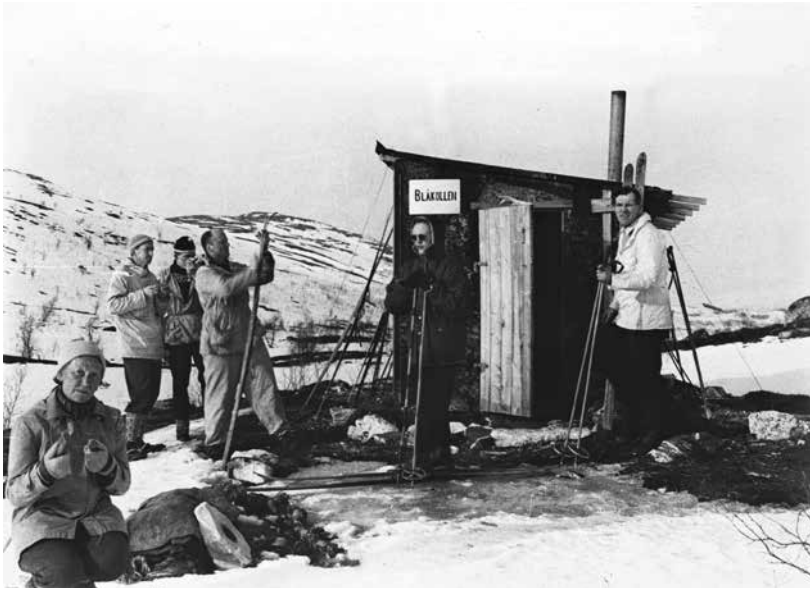
Folksomt på gamle Blåkollkoia.

har det gått oppover av flere årsaker. De viktigste er nok tilstrømminga av turister, utviklinga av universitetet og Tromsø som utdanningscenter og en ny trendbølge mht til friluftsliv og trening. Bedre merking av stier, bygging av bru over elva (tidlig 90-tall) og omlegging av sti opp Tønsvikdalen har også bidratt til utviklinga. Det at hytta er så lett tilgjengelig gjorde at studenter og ungdom uten bil i økende grad begynte å bruke hytta ut over 2000-tallet. Allerede rundt 2005 ble spørsmålet om utbygging tatt opp. Dessverre fenget ikke forslaget helt, men i 2016 kom vi endelig i gang. I 2017 er koia blitt til hytte. Fra ett kombinert oppholds-/sove-rom med 4,5 soveplasser er det nå 2 soverom med 9 soveplasser, utvidet kjøkken og oppholdsrom samt eget uthus for ved/toalett. I tillegg er det bygd to platter og med bord/benk på platingen mot sydøst.