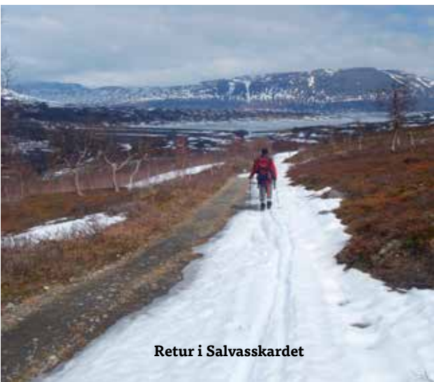
Retur i Salvasskardet