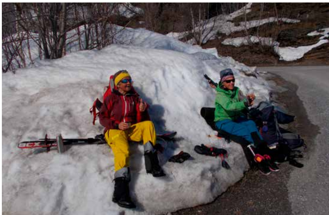
Målet er nådd!

triveleg prat i ettermiddagssola. Når vi studerer kartet, ser vi at vi i løpet av neste dag vil passere riksgrensa og nå fram til Sorjushytta på norsk side. Vi nærmar oss endepunktet for årets eventyr.