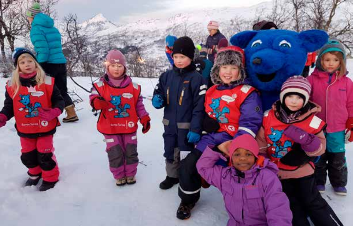
Solfest ved Eidhaugen.