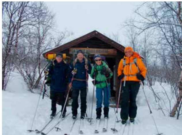
Starten på Kungsleden