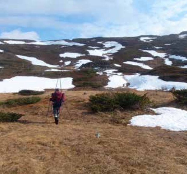
Skitur i juni kan by på mye bæring