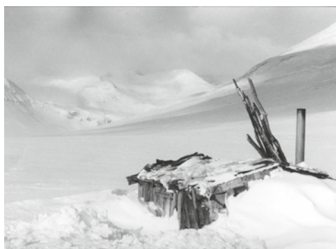
Den gamle Moskanhytta.