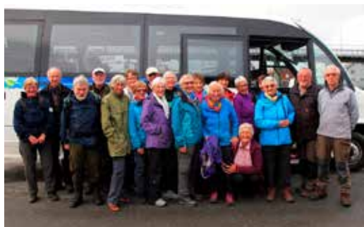
Blide og fornøyde veteraner

Er du interessert? Send din søknad til turlagskontoret; troms@dnt.no og søkere vil bli innkalt til samtale om oppdraget. Vi ser fram til å høre fra deg! :-)