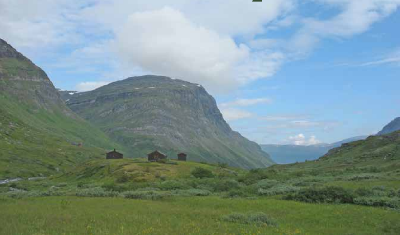
Slik ser Stordalsstua ut når man kommer sørfra.

Stordalsstua er relativt lite besøkt. I 2016 var det totalt 255 besøkende på de to hyttene. Grunnen til at det er få besøk, vet man ikke. Men den er ikke en naturlig del av hyttekjeden. Folk synes kanskje at kjøreavstanden fra Tromsøområdet er for stor, sjøl om avstanden ikke er lengre enn til Altevatn.