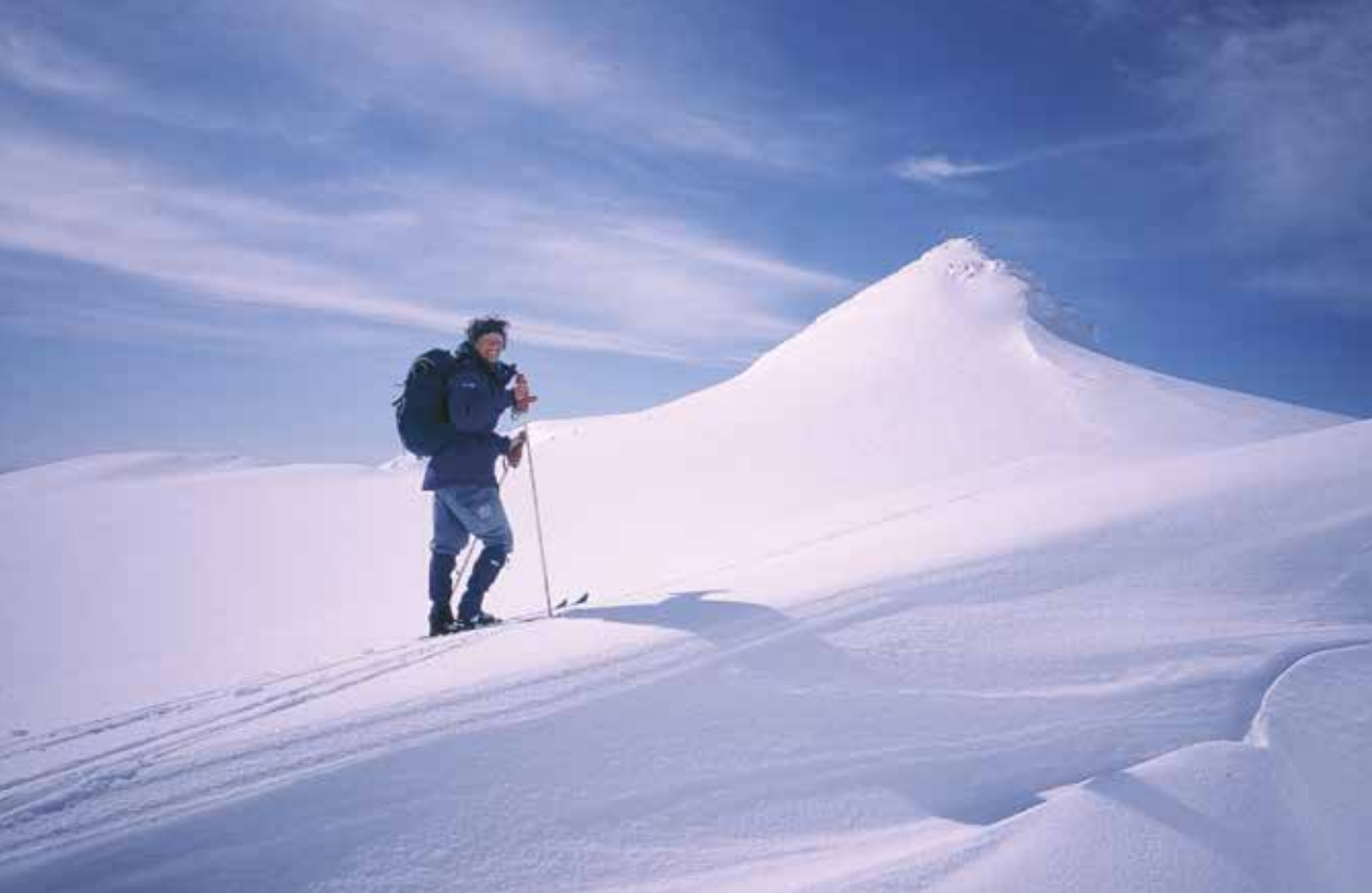
Oppover mot Nevertind.