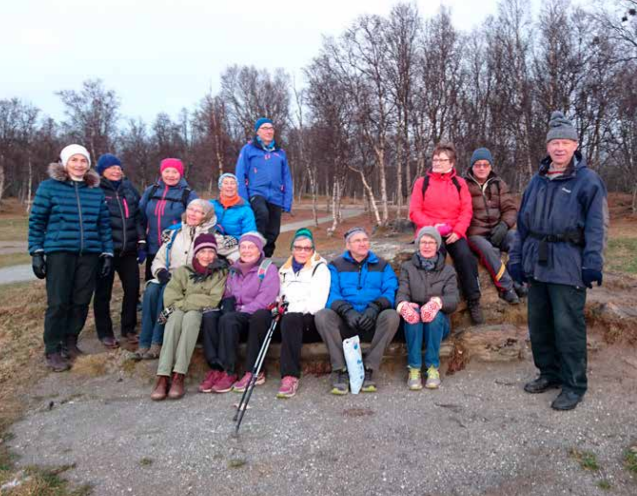
Veteraner koser seg i Telegrafbukta