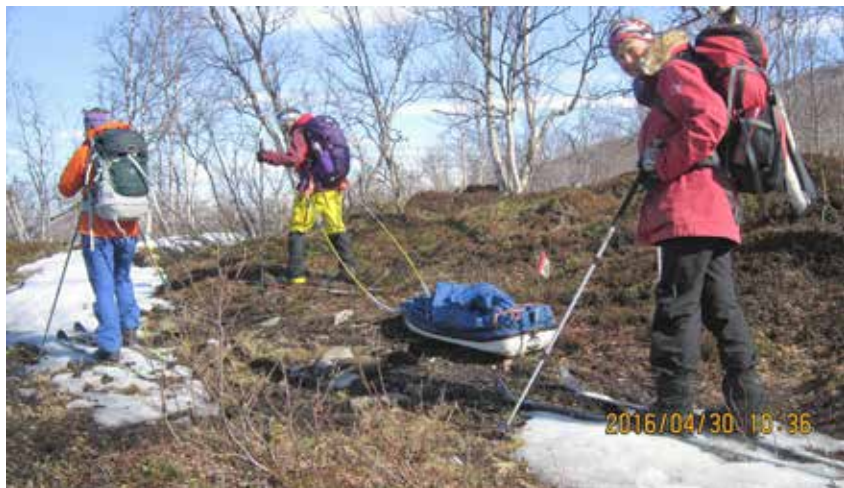
Vårlig i Dividalen