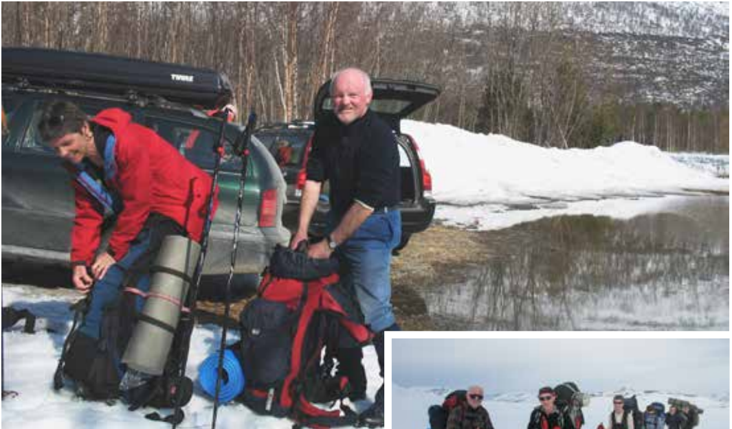
Klar til avmarsj.