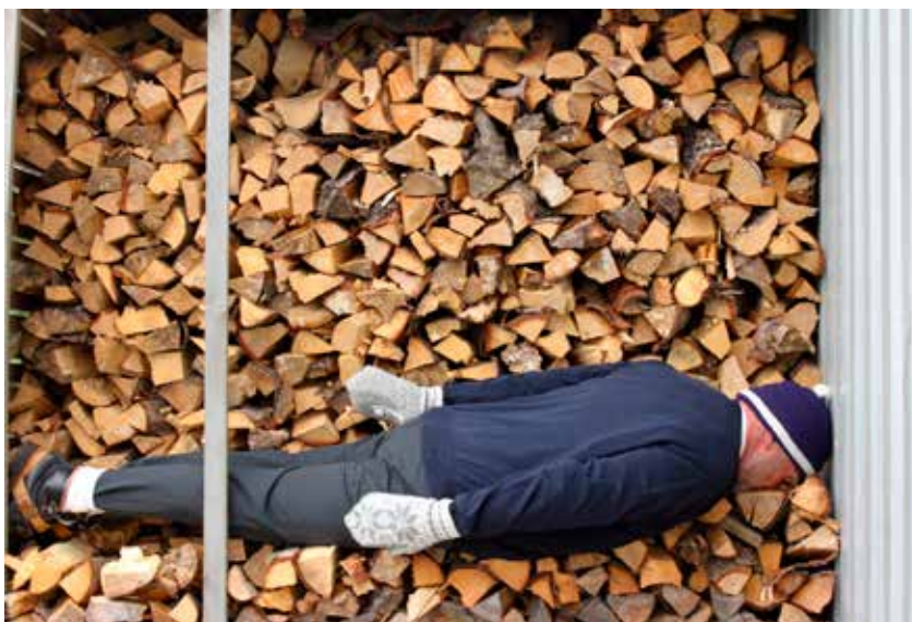
Fra årets barmarkssamling: Jeg trener ved-stil.