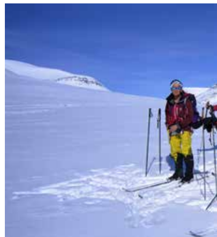
Blide damer passerer Moskanvarri