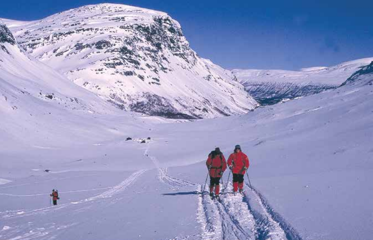
På veg sørover, hyttene i bakgrunnen.

sida ligger Leigastinden, Rivtinden, Nevertind og Istind. Traseen er god, og det siste stykket ned til Stordalsstua er det sidebratt. Om vinteren er det sikrest å holde høyden, gå så vidt inn i Sverige før man svinger inn i Stordalen.