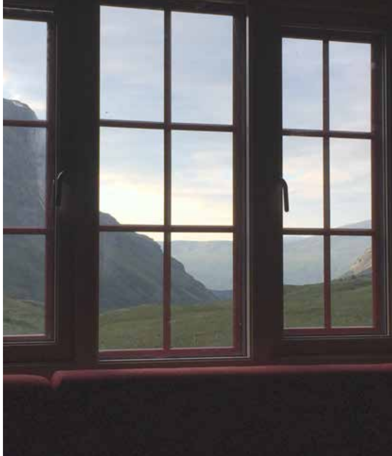
Forvandling fryder...

Etter rallartida og transporten som den medførte, ble det stillstand i trafikken gjennom dalen. I årene omkring 1905 ble hytta blant annet brukt til opphold for de som gikk nøytralitetsvakt.